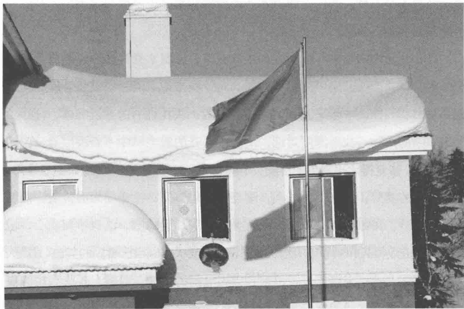
(国旗哨所白雪)