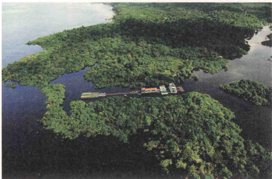
亚马孙河的淡水含量与水资源之丰沛，让多少人都会觉得它是独孤求败

“金”，巴西有非常丰富的地下矿藏资源，这一点自然没得说；“木”，巴西的热带雨林与林木资源绝对独步天下；“水”，亚马孙河的淡水含量与水资源之丰沛，让多少人都会觉得它是独孤求败；“火”，巴西最近发现了近海的石油，将来甚至可以出口到国外，更重要的是巴西把甘蔗转化成了乙醇，为汽车提供源源不断的能量，这可是为巴西熊熊燃烧的火，绝对无人能及；最后说到“土”，850多万平方公里，世界第五大的国土面积，居然还有大量未开采的土地，可以说巴西是一个真正的农业超级大国，让人羡慕嫉妒“恨”。