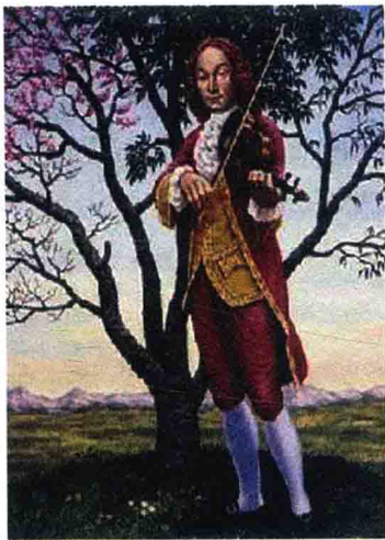
图 1.1 安东尼奥·维瓦尔第 (Antonio Vivaldi, 1678— 1741)

父亲那遗传得来的头发颜色使得他被称为“红发神父”。1703—1740年的30多年里，维瓦尔第先后数次在威尼斯仁爱教养院任职，担任过指挥、作曲家、音乐教师、音乐总监。维瓦尔第的主要职责是为仁爱教养院举办的音乐会提供大量新作品，包括清唱剧和协奏曲。1725年前后，维瓦尔第的小提琴协奏曲《和声与创意的实验》出版，其中第一号到第四号作品，合称《四季》。这四部协奏曲是维瓦尔第最著名的作品，悠扬的旋律至今仍长盛不衰。