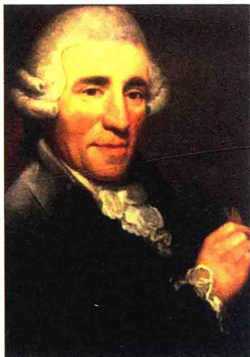
图 1.4 弗朗茨·约瑟夫·海顿 （Franz Joseph Haydn, 1732—1809）

弦乐四重奏是古典主义时期最重要的室内乐形式，也是室内乐中最理想、最融洽、最经典的组合。尽管在这种组合中找不到交响乐庞大的气势，看不到歌剧中宏大的场景，但这种体裁的音乐以精致抒情为本，能营造出人与人之间亲切交谈式的音乐氛围。弗朗兹·克萨韦尔·里赫特（1709—1789）是首先运用弦乐四重奏组合进行创作的作曲家之一，而最终确立弦乐四重奏形式的是海顿。从 1760—1802 年这四十二年间，海顿共创作了 68 部弦乐四重奏。古典乐派促