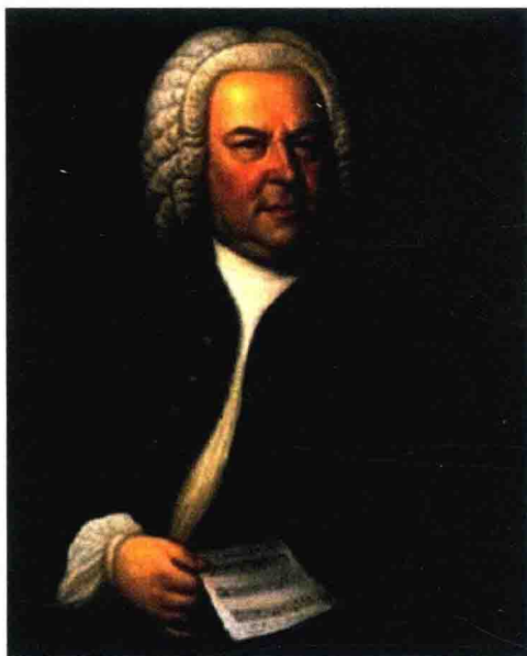
图 1.3 约翰·塞巴斯蒂安·巴赫 (Johann Sebastian Bach, 1685—1750)

约翰·塞巴斯蒂安·巴赫 (Johann Sebastian Bach, 1685—1750)，巴洛克时期的德国作曲家，杰出的管风琴、小提琴、大键琴演奏家，西方“现代音乐之父”。