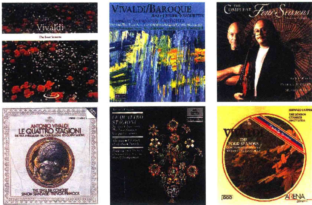
图 1.2 维瓦尔第《四季》的录音版本多达 1000 多种