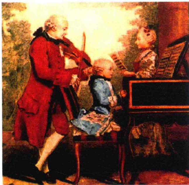
图 1.6 童年时代的莫扎特（中）在弹琴，身旁是他的姐姐南内尔和父亲列奥波尔得

沃尔夫冈·阿玛多伊斯·莫扎特（Wolfgang Amadeus Mozart, 1756—1791），奥地利音乐家，欧洲最伟大的古典主义音乐家之一。