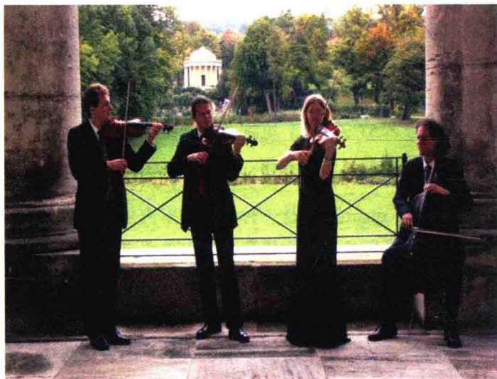
图 1.5 声名远扬的海顿四重奏乐团，他们是奥地利海顿音乐节的固定嘉宾