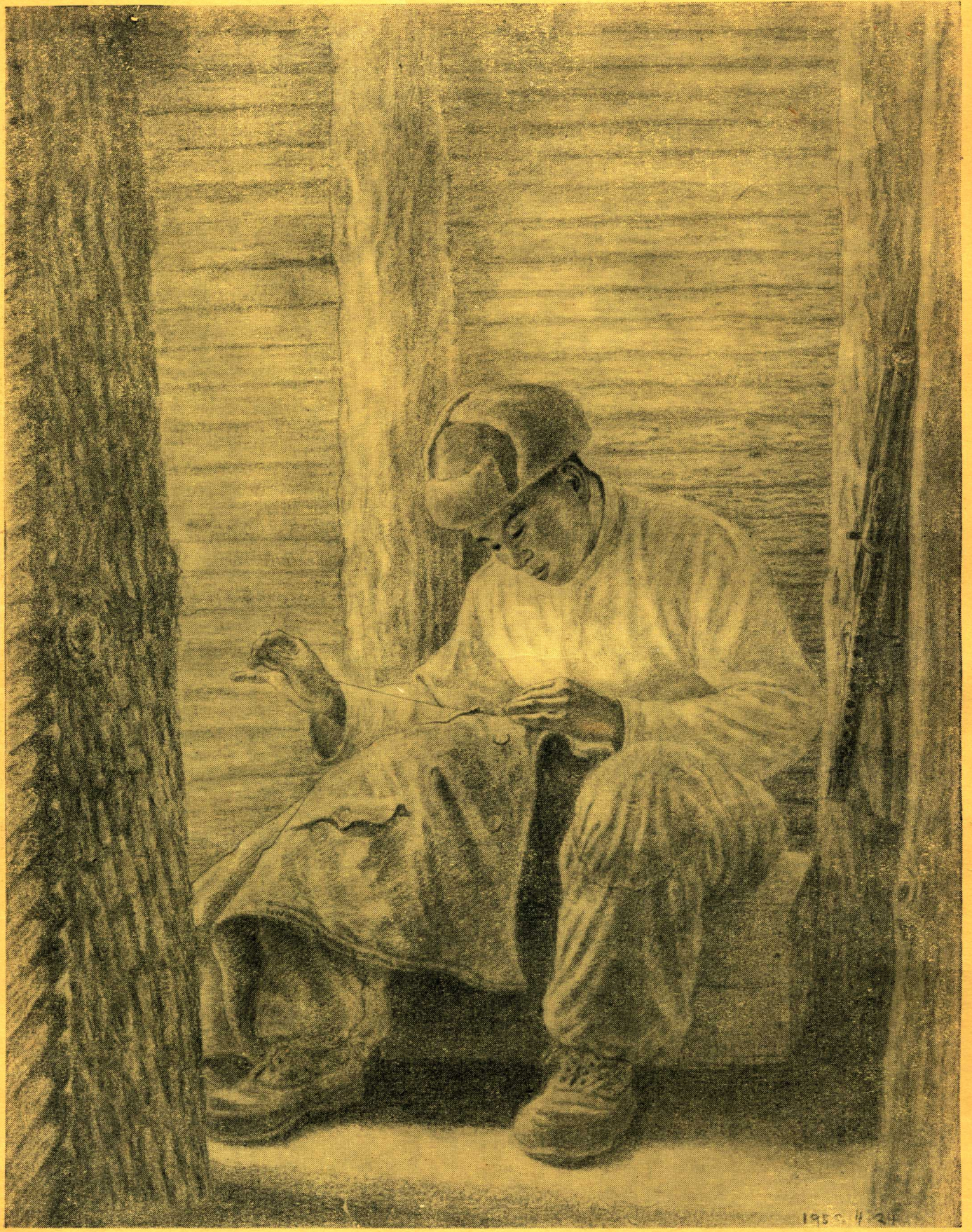
補 征 衣