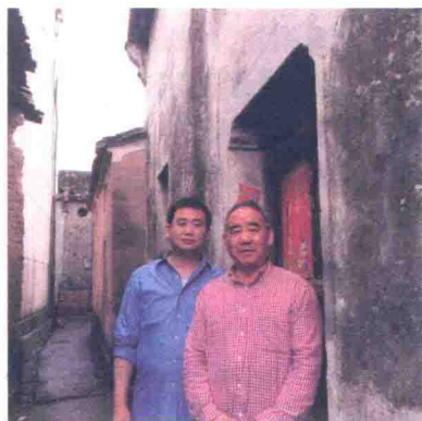
父子俩摄于老宅门口

我父亲于2002年10月12日前撰写了《家族考查概况》《我的家史》和《汤溪家乡记述》,详见附录2。