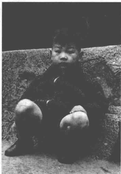
倪匡小時候(攝於 1940 年上海)