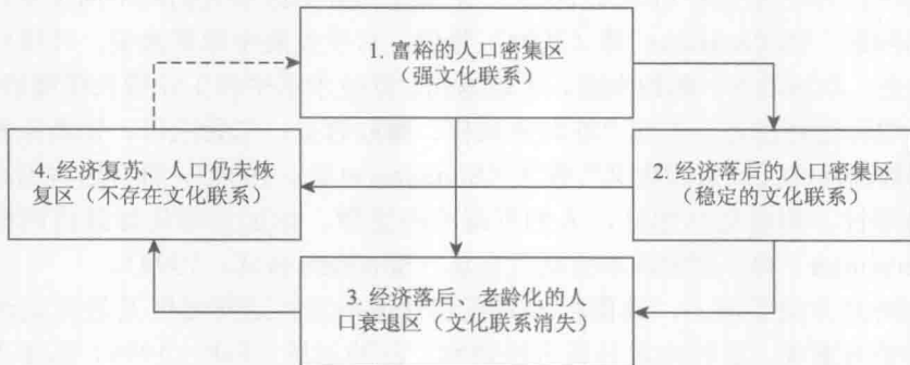
图 1.1 文化边际化循环模型