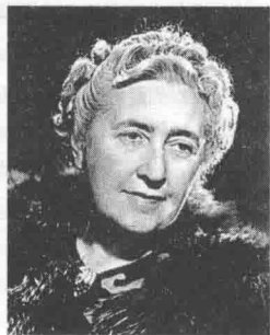
阿加莎·克里斯蒂 Agatha Christie (1890—1976)