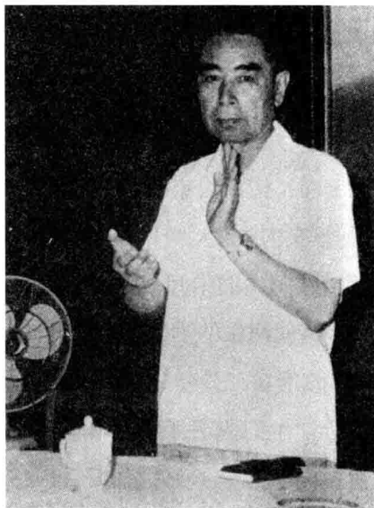
1966年7月，周恩来总理来二外视察并作报告