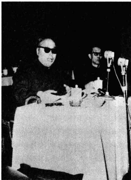
1964年10月22日，陈毅副总理（左）在二外开学典礼上作报告

一般学校都是先召开成立大会，然后再正式上课。二外则是1964年9月14日开学上课，把学校成立大会放在10月下旬举办，而且举办了两次成立大会。第一次是在10月22日，第二次是在10月24日。