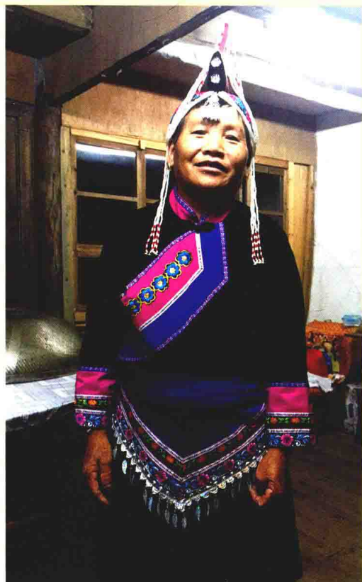
畲族叙事歌