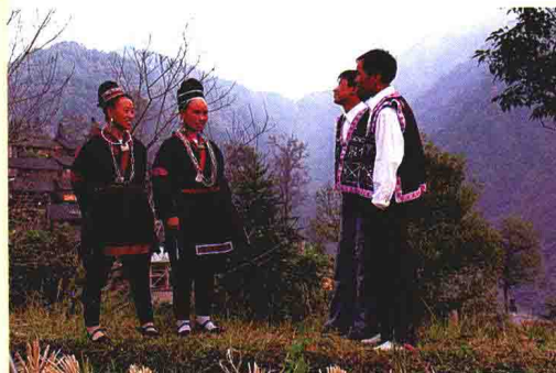
苗族叙事歌《仰阿莎》