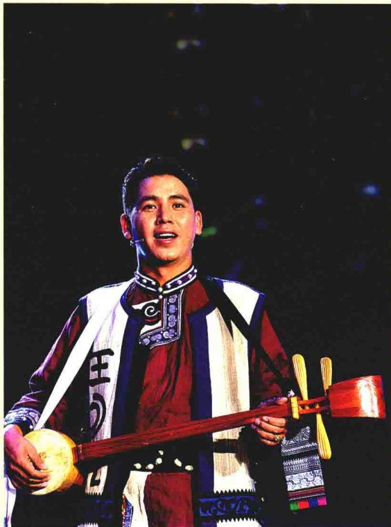
彝族《曼昂阿诗玛》