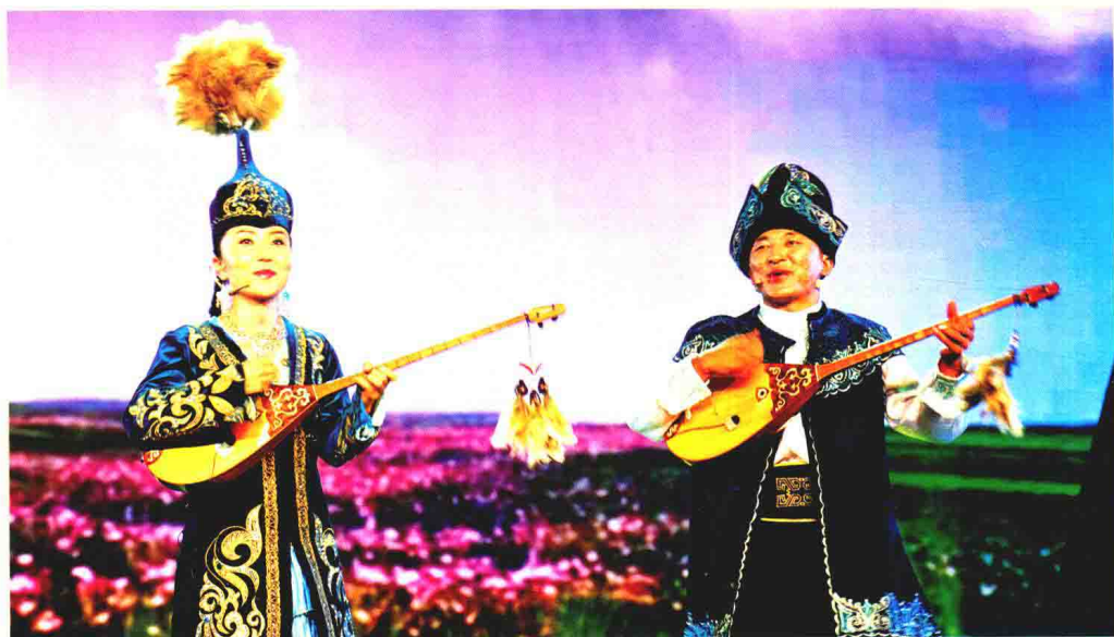
哈萨克族阿肯弹唱《故乡》