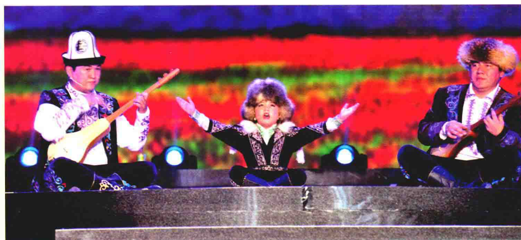
柯尔克孜族《玛纳斯》