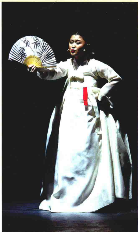
盘索里《春香传·狱中歌》演出照