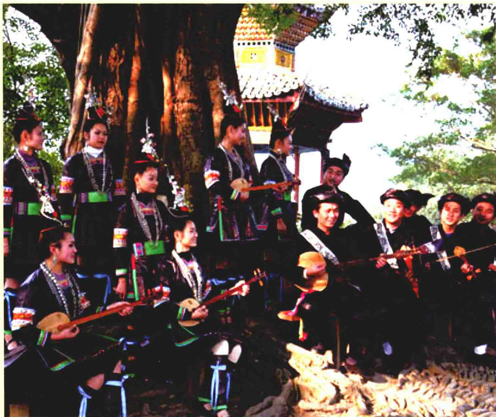
侗族琵琶歌