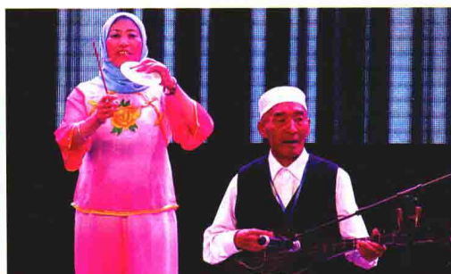
松潘土琵琶弹唱《南桥汲水》