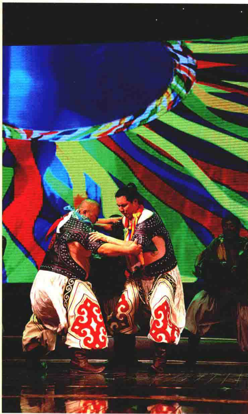
斯琴领唱赞词好来宝《博克赞》