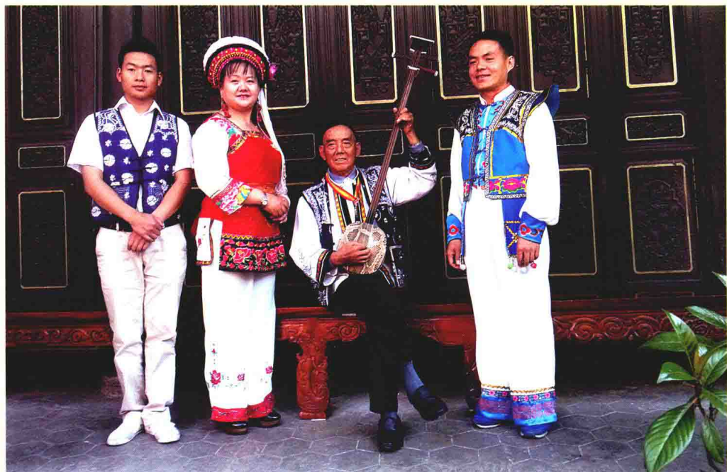
白族 大本曲