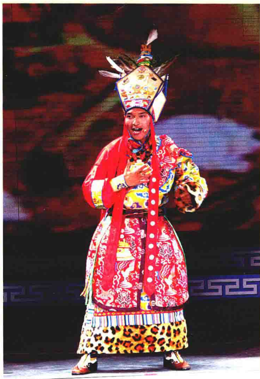
格萨尔说唱《门岭之战》片段演出照