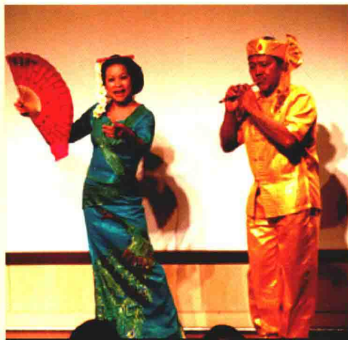
傣族赞哈《欢迎你远方的朋友》