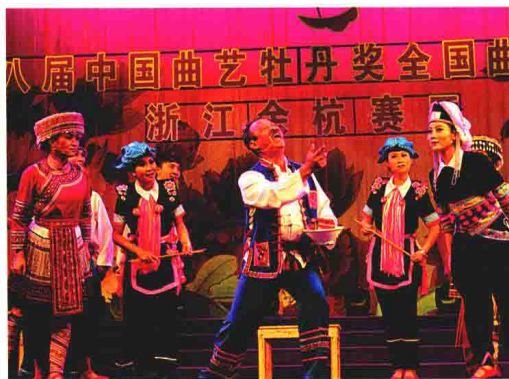
壮族仓考《新桌子歌》