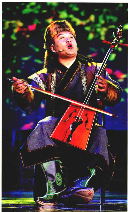
蒙古族《扎萨克图赞》