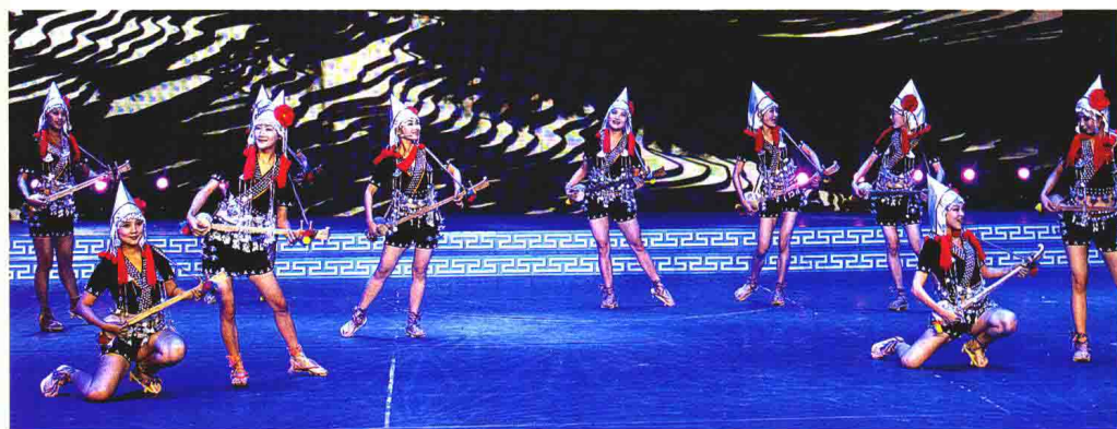
哈尼族 小三弦弹唱《白鹇姑娘》