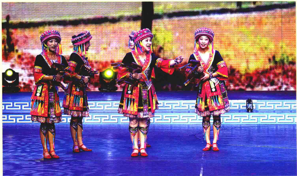
瑶族铃鼓《打锣挖地歌满坡》