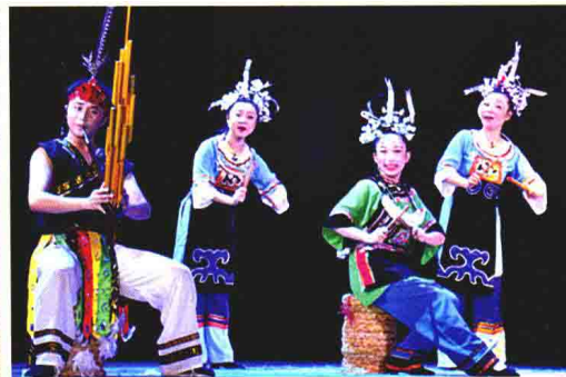
水族旭旱《水寨除魔》