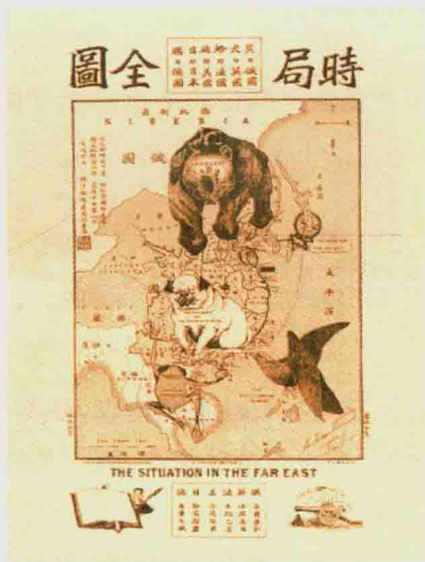
《时局全局图》由近代爱国者谢缙泰绘于1898年。图中以黑熊代表俄国、狗代表英国、红日代表日本、肠子代表德国、青蛙代表法国、秃鹰代表美国，生动展现了列强瓜分中国的形势

度支那为基地，长驱直入云南、广西和广州湾（今湛江市）。1894至1895年，在中日甲午战争中，中国又一次战败，与日本签订《马关条约》，从此，中国国际地位一落千丈。19世纪末，沙俄、德国、英国、法国、日本、美国等西方列强掀起了瓜分中国的狂潮。随着民族危机的加深，中国人民反抗帝国主义斗争情绪日益高涨。1898年，全国掀起了颇具声势的戊戌变法，但这场变革却以废除一切新政法令，大批维新人士惨遭杀害，维新派重要人物康有为、梁启超逃亡国外的结局匆匆告终；1900年，一场