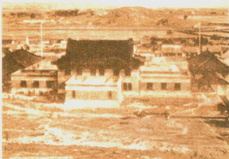
江宁自治实验县政府旧址

代，由此开创了湖熟的文明史。湖熟建县始于西汉，初作胡孰，东汉作湖熟县，东吴设典农都尉，晋复为湖熟县，隋废。明代开始繁荣，清代为上元县五大镇之首，民国一跃成为江宁县最大镇。《同治上江两县志》载，因在刘阳湖畔，物产丰饶得名“湖熟”。湖熟之名，便从此相沿至今。湖熟地处江宁、句容、溧水三地边缘的中心地带，面赤山，滨秦淮，地扼襟要，素有“金陵东门户”之称，历来为兵家必争之地。东汉末年，周瑜征笮融曾在此激战；三国时，孙策渡江首先攻下湖熟，亲自与吕范率兵在此镇守；晋咸康三年（337），“毛宝以苏峻之乱，领兵烧湖熟积聚”；南朝时，陈霸先“自拒徐嗣于湖熟”；清咸丰年间，太平军曾多次在这里与清军激战。