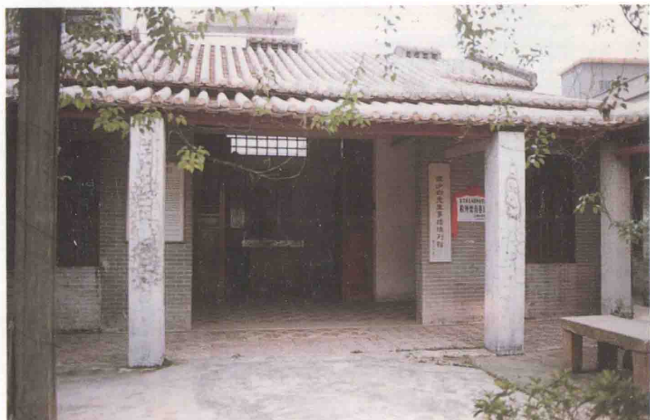
陈少白故居内的《陈少白事迹陈列馆》