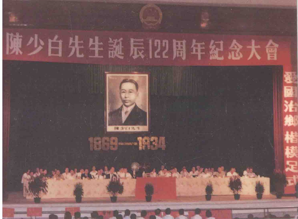
江门市隆重纪念陈少白先生诞辰 122 周年