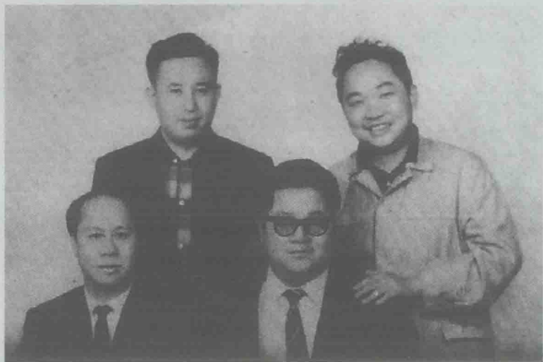
左一 卧龙生,左三 诸葛青云,右一 古龙。