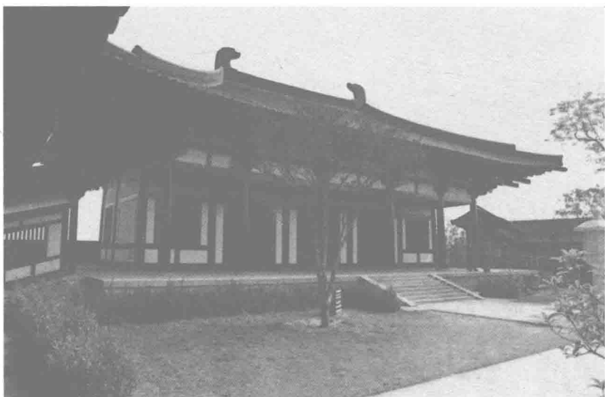
鉴真和尚纪念堂（一）