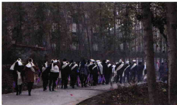
图 1-6 孝子贤孙

zài zhōng guó gǔ dài de wǔ fāng shuō 在中国古代的五方说 zhōng xī fāng wéi bái hǔ xī 中，西方为白虎，西 fāng shì xíng tiān shā shén zhǔ xiāo 方是刑天杀神，主萧 shā zhī qiū gǔ dài cháng zài qiū 杀之秋，古代常在秋 jì zhēng fá bù yì chù sǐ 季征伐不义、处死