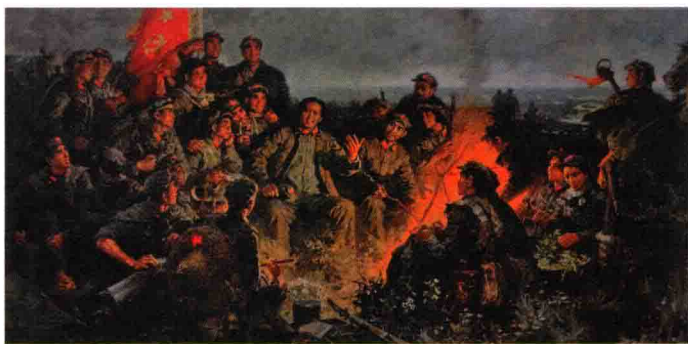
图 1-5 《革命理想高于天》油画

de zhèng quán jiào hóng sè zhèng quán zuì zǎo de wǔ zhuāng jiào hóng jūn 的政权叫“红色政权”，最早的武装叫“红军”， zhèng zhì shàng yāo qiú jìn bù yè wù shàng kè kǔ zuān yán de rén bèi chēng wéi 政治上要求进步、业务上刻苦钻研的人被称为 yòu hóng yòu zhuān děng tā yě xiàng zhēng shùn lì chéng gōng rú rén de jìng “又红又专”等；它也象征顺利、成功，如人的境 yù hěn hǎo bèi chēng wéi zǒu hóng hóng jí yí shí dé dào shàng sī chǒng 遇很好被称为“走红”“红极一时”，得到上司宠 xìn de jiào hóng rén fēn dào hé huǒ jīng yíng lì rùn jiào fēn hóng gěi rén 信的叫“红人”，分到合伙经营利润叫“分红”，给人 kuì zèng huò jiǎng lì jiào sòng hóng bāo děng tā hái xiàng zhēng měi lì piào liang rú 馈赠或奖励叫“送红包”等；它还象征美丽、漂亮，如 zhǐ nǚ zǐ shèng zhuāng wéi hóng zhuāng huò hóng zhuāng bǎ yàn zhuāng nǚ zǐ 指女子盛妆为“红妆”或“红装”，把艳妆女子 chēng wéi hóng xiù zhǐ nǚ zǐ měi yàn de róng yán wéi hóng yán děng 称为“红袖”，指女子美艳的容颜为“红颜”等。