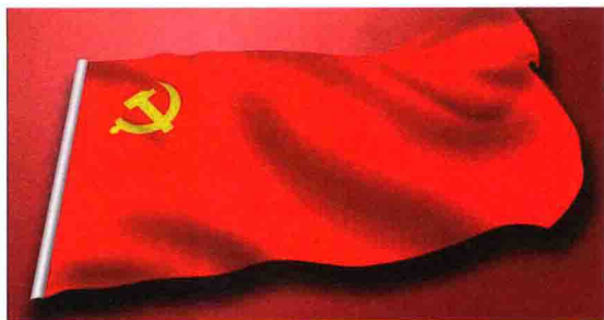
图 1-4 中国共产党党旗