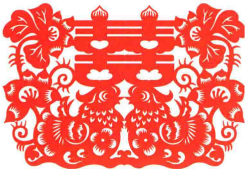
图 1-3 鸳鸯荷花

hóng sè shì wǒ guó wén huà zhōng de jī běn chóng shàng sè rén men jiāng zì 红色是我国文化中的基本崇尚色，人们将自 jī jīng shén hé wù zhì shàng de zhuī qiú dōu yòng hóng sè lái biǎo dá tā zhèng miàn 己精神和物质上的追求都用红色来表达。它正面 de yì yì xiàng zhēng kě yǐ zài gè zhǒng gè yàng de wén huà yǔ yán xiàn xiàng zhōng 的意义象征可以在各种各样的文化、语言现象中