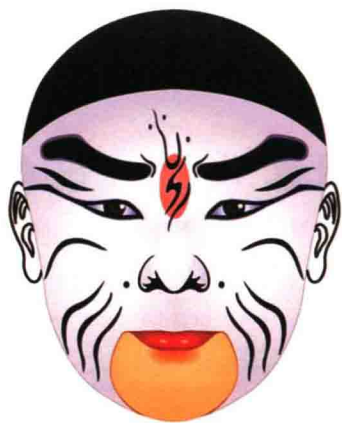
图 1-7 京剧脸谱

zhe bái qí biǎo shì tóu xiáng chēng zhì lì dī xià 着“白旗”表示投降，称智力低下 de rén wéi bái chī bǎ chū lì ér dé bù dào 的人为“白痴”，把出力而得不到 hǎo chù huò méi yǒu xiào guǒ jiào zuò bái máng bái 好处或没有效果叫做“白忙”“白 fèi lì bái gàn děng zài rú xiàng zhēng jiān 费力”“白干”等；再如象征奸 xié yīn xiǎn rú chàng bái liǎn bái liǎn jiān 邪、阴险，如“唱白脸”“白脸奸 xióng zuì hòu tā hái xiàng zhēng zhī shì qiǎn bó 雄”；最后，它还象征知识浅薄、