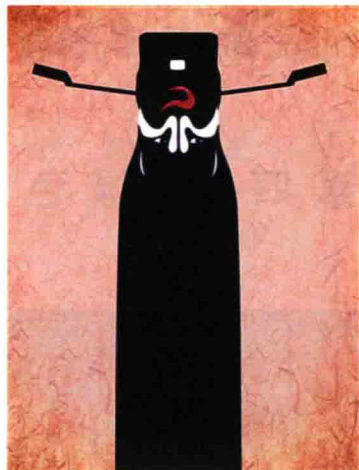
图 1-8 包公脸谱

另一方面它又由于其本身的黑暗无光给人以阴险、毒辣和恐怖的感觉。它象征邪恶、反动，如指阴险狠毒的人是“黑心肠”，不可告人的丑恶内情是“黑幕”，反动集团的成员是“黑帮”“黑手”，把反动势力为进行政治迫害而开列的革命者和进步人士的名单称为“黑名单”；它又表示犯罪、违法，如