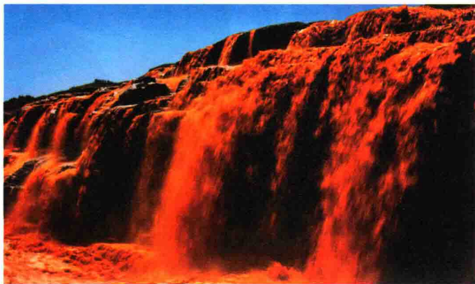
图 1-10 黄河

huáng sè yǔ zhōng huá mín zú yǒu zhe jí wéi mì qiē de guān xi zhōng guó 黄色与中华民族有着极为密切的关系，中国 gǔ dài huáng dì suǒ zhuó yī shān duō wéi huáng sè ér zhōng guó de shǐ zǔ chēng wéi 古代皇帝所着衣衫多为黄色，而中国的始祖称为 huáng dì zhōng huá mín zú de yáo lán wéi huáng hé huá xià wén huà fā “黄帝”，中华民族的摇篮为“黄河”，华夏文化发 yuán yú huáng hé yán àn nà yí piàn dì qū jí huáng tǔ gāo yuán zhōng guó 源于黄河沿岸，那一片地区即“黄土高原”，中国 rén zì gǔ yǐ lái jiù zì chēng wéi yán huáng zǐ sūn yǒu zhe huáng pí 人自古以来就自称为“炎黄子孙”，有着“黄皮 fū 肤”。