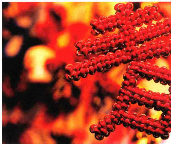
图 1-1 中国红

hóng sè zài zhōng guó wén huà zhōng kě yǐ shuō dài biǎo le yí qiè měi hǎo xǐ 红色在中国文化中可以说代表了一切美好、喜 qīng shì tài yáng de yán sè shì huǒ de yán sè shì shēng mìng de yán sè hóng 庆，是太阳的颜色，是火的颜色，是生命的颜色；红 sè shì gé mìng zhōng yǒng yǔ zhèng yì de xiàng zhēng yuán shǐ shè huì jiù yǐ jīng 色是革命、忠勇与正义的象征。原始社会就已经 cún zài hóng sè bì xié hóng sè jí xiáng de guān niàn tā yuán yú zhōng huá mín zú 存在红色辟邪、红色吉祥的观念，它源于中华民族 duì hóng sè de chóng bài shí dài zài biàn qiān chóng shàng hóng sè de sī xiǎng 对红色的崇拜。时代在变迁，崇尚红色的思想 bìng méi yǒu gǎi biàn ér shì chén diàn zài wén huà chuán tǒng zhōng bèi dài dài xiāng 并没有改变，而是沉淀在文化传统中，被代代相 chuán huàn huà wéi chuán tǒng fēng sú sù 传，幻化为传统风俗。