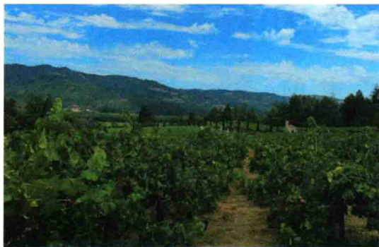
图 1-9 春色满园

lǜ sè shì yí gè tè shū de yán 绿色是一个特殊的颜 sè zài zhōng guó chuán tǒng wén huà 色，在中国传统文化 zhōng tā dài biǎo le liǎng zhǒng hǎo huài 中，它代表了两种好坏 duì lì de yì yì chú le biǎo shì yì 对立的意义，除了表示义 xiá wài hái biǎo shì yě è lǜ sè 侠外，还表示野恶。绿色