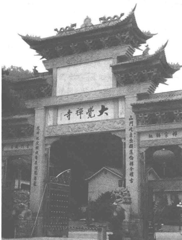
千年古刹云门山大觉禅寺