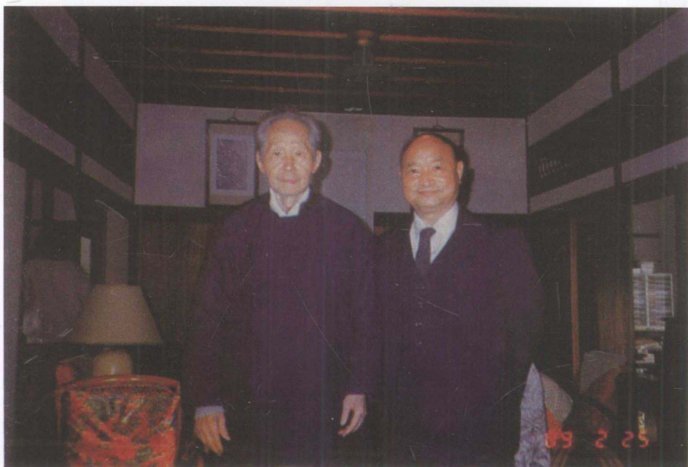
杨义富与孙立人合影