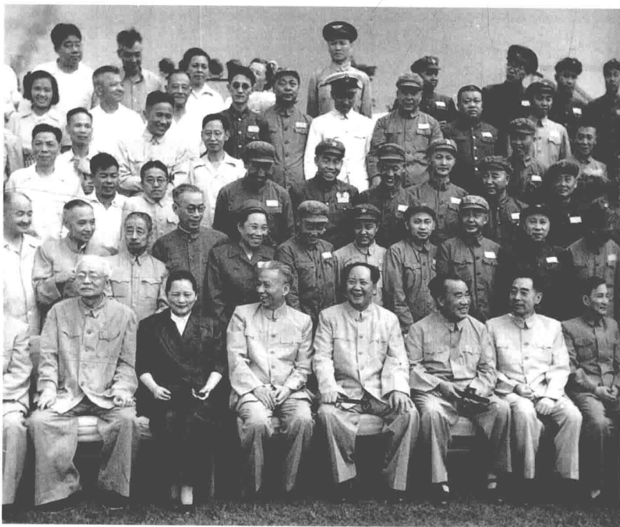
1955年7月26日第一届全国人民代表大会第二次会议合影局部(后排左二为冯雪峰)