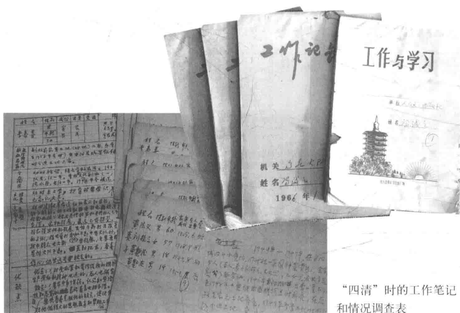
“四清”时的工作笔记和情况调查表