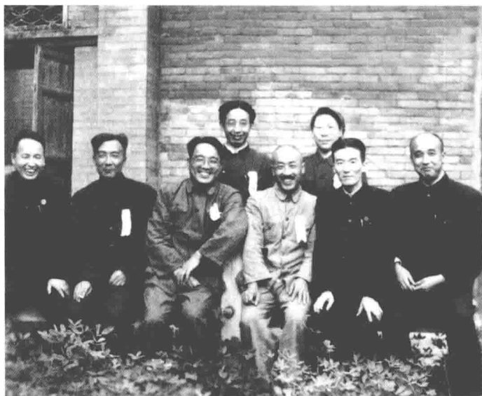
1950年，摄于北京全国英模大会时（前排左起：范长江、冯雪峰、章靳以、魏金枝、邓拓、胡风；后排左起：骆宾基、茵子）