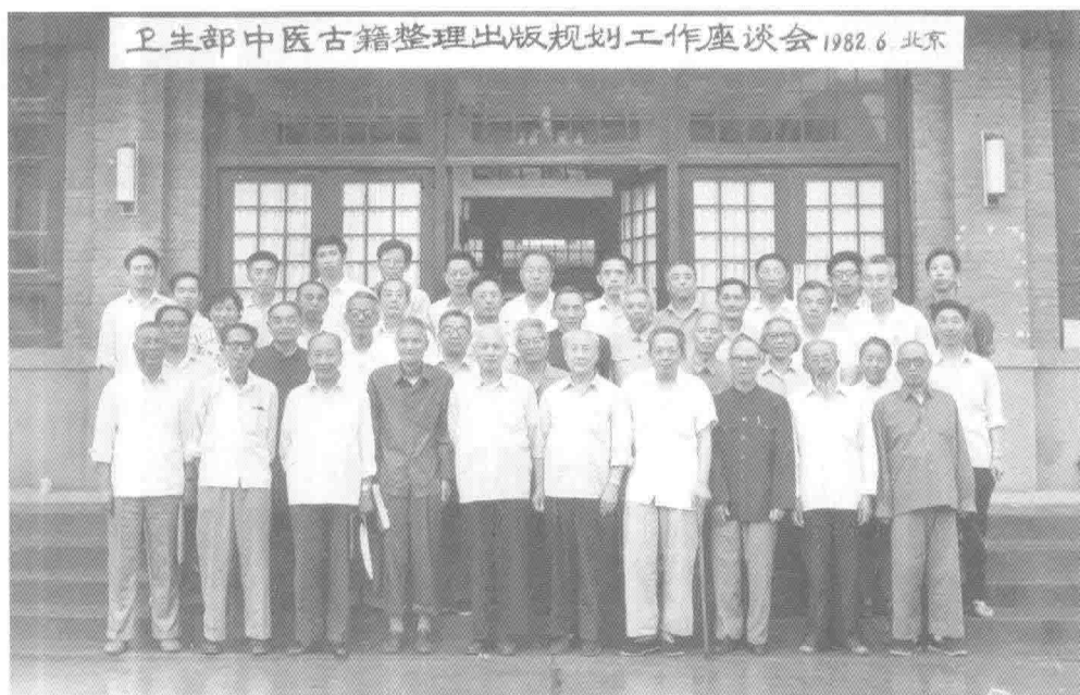
1982年6月 卫生部中医古籍整理出版规划工作座谈会