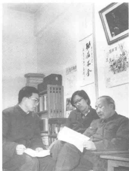
指导 1979 级研究生