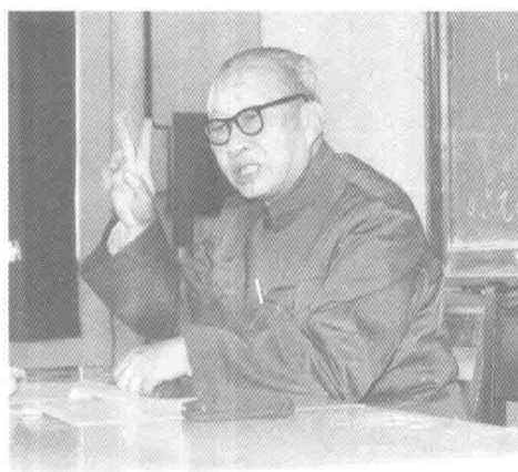
1979年11月于上海中醫學院