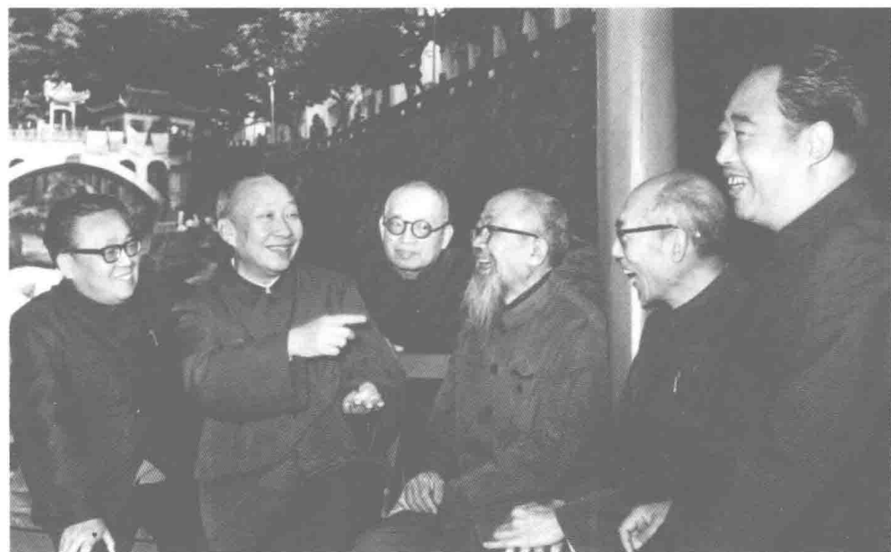
1981 年黄山医古文会议