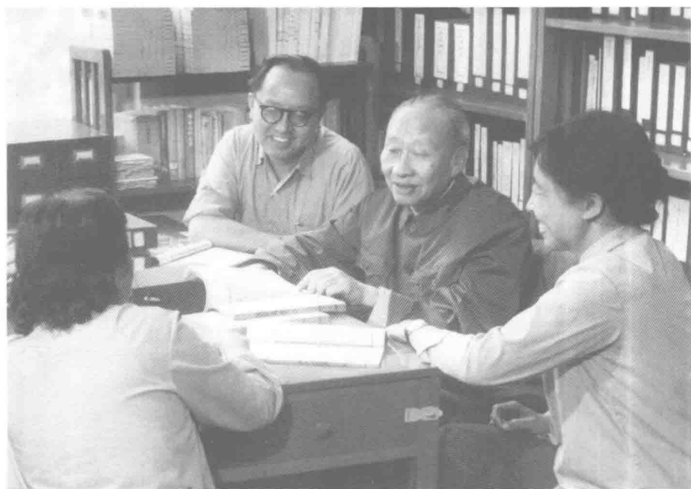
1979 年和青年教师在办公室