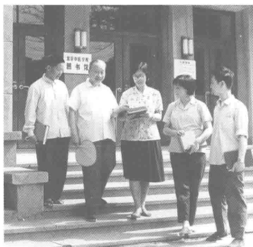
和首屆研究生在一起