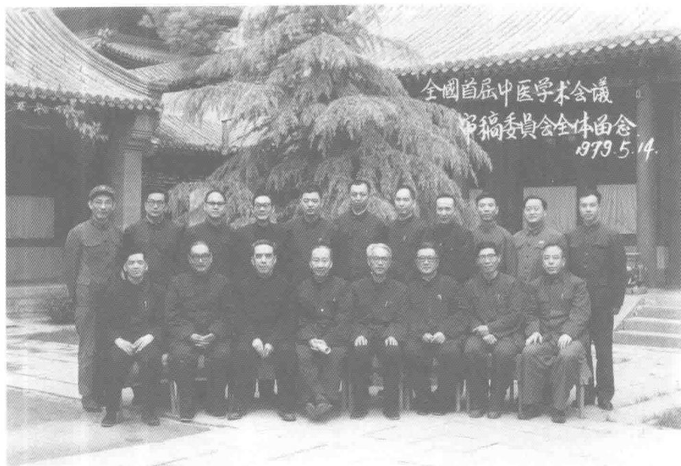
1979年首屆中醫學術會議