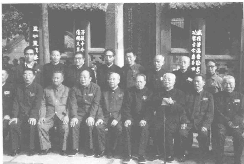
1982年主持首届仲景学说学术研讨会