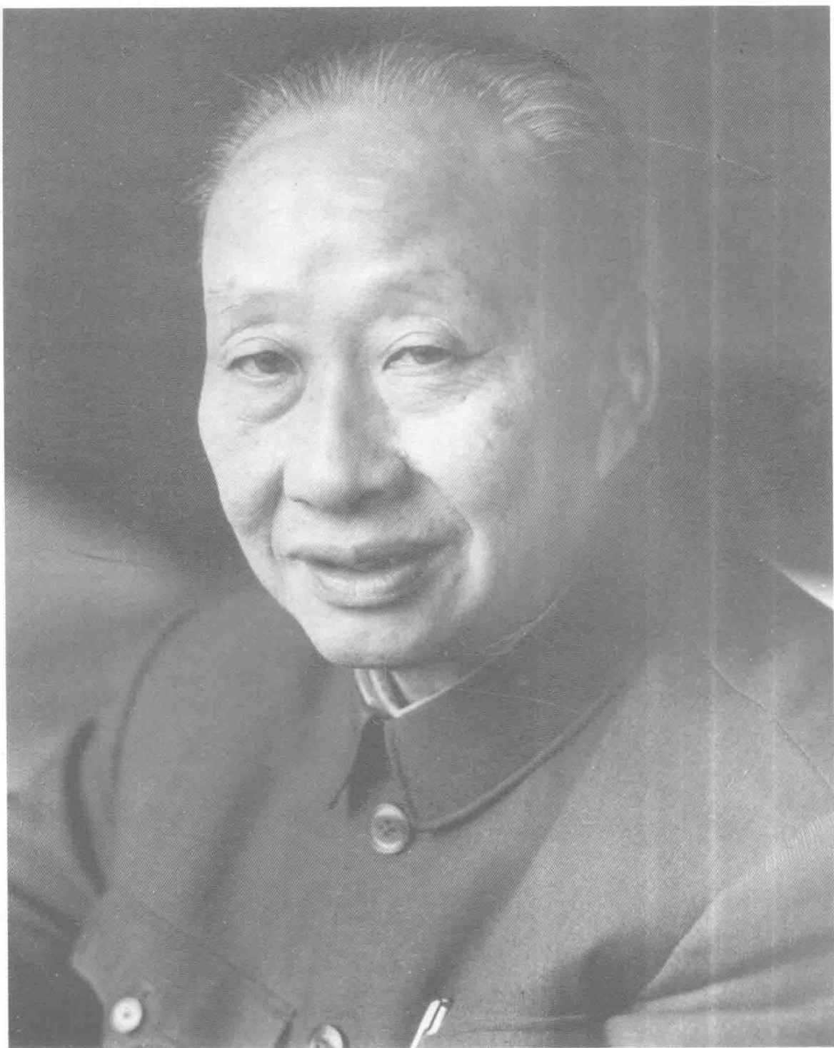
1980年10月20日昆明春城晚报记者摄