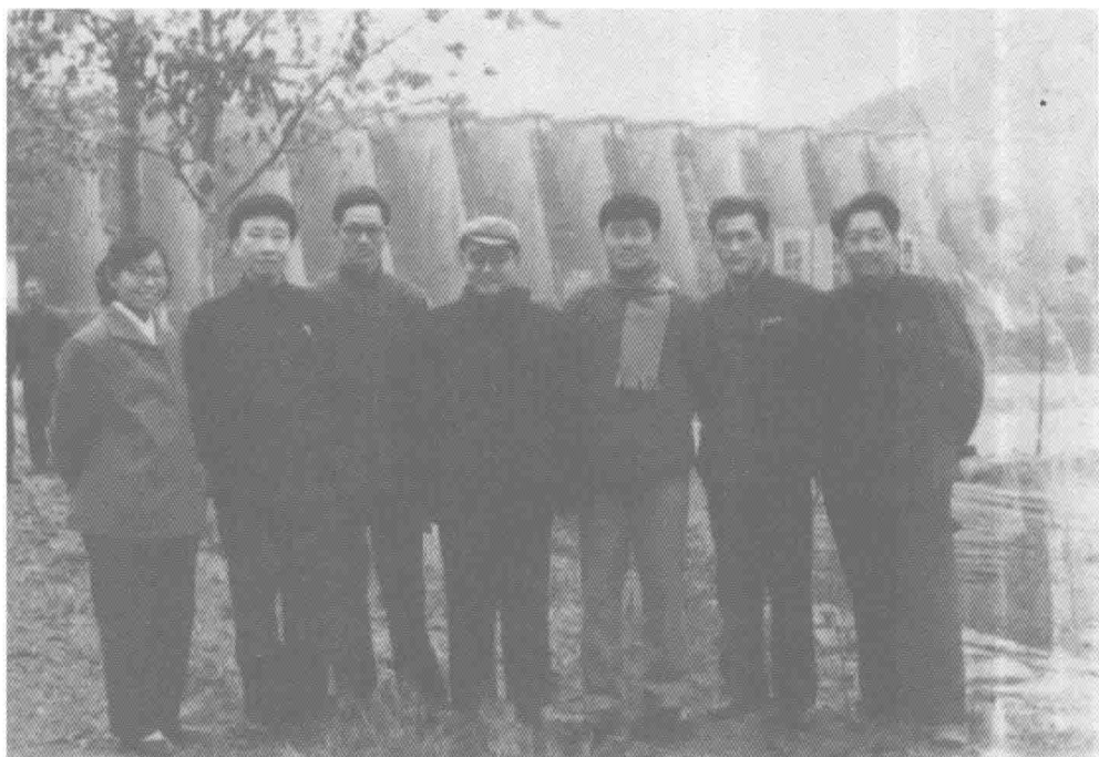
70年代和兄弟院校的同道在一起