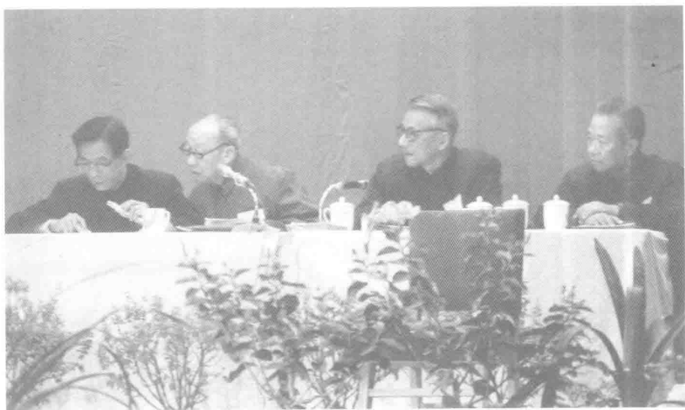
1981年10月伤寒学术交流会上