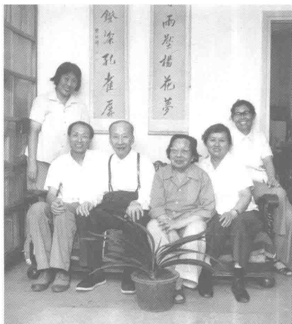
1978年和夫人及同事在家中