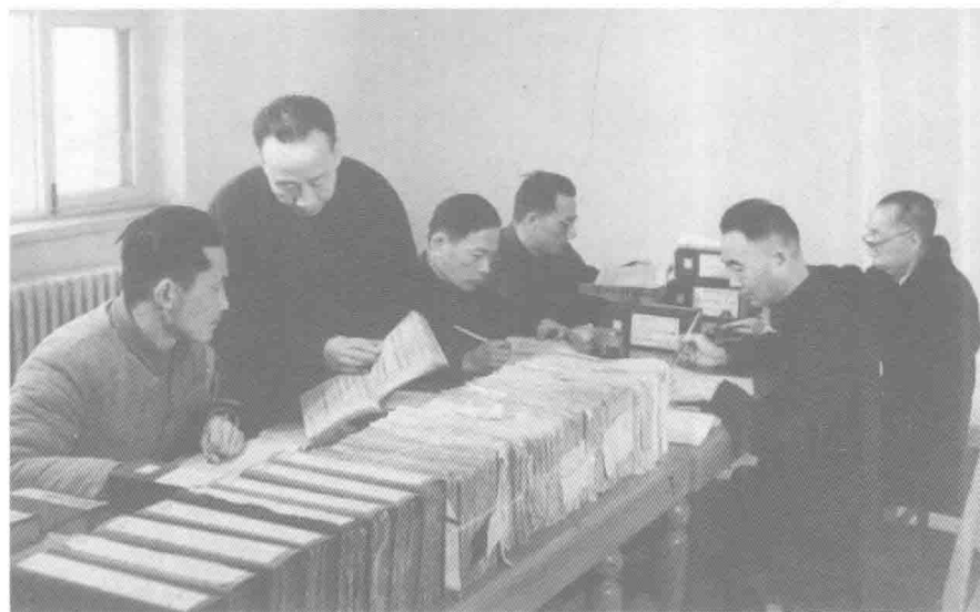
60年代和同事在一起