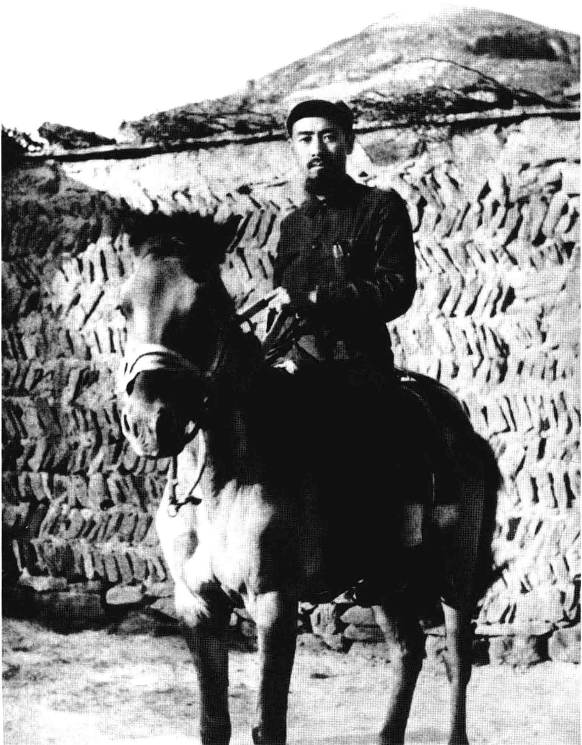
红军长征到达陕北后的周恩来。