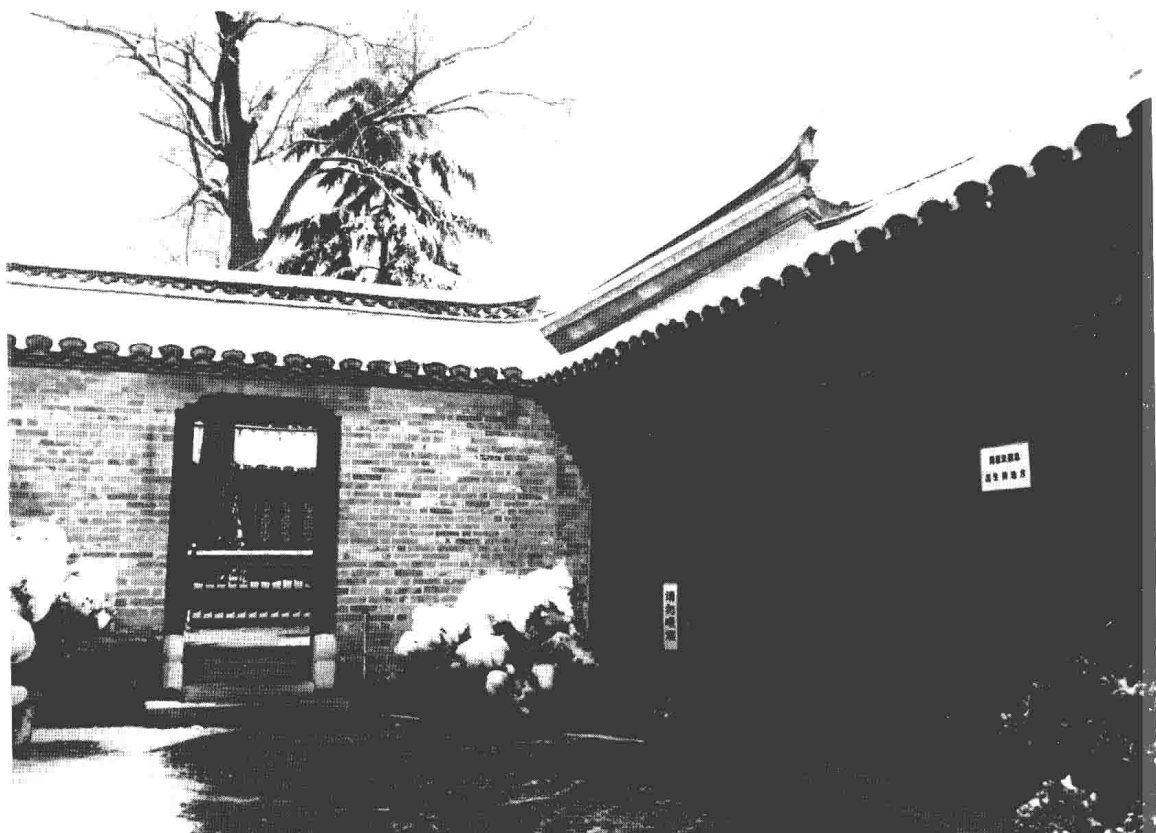
1898年3月5日，周恩来诞生在淮安城内驸马巷的这所住宅。