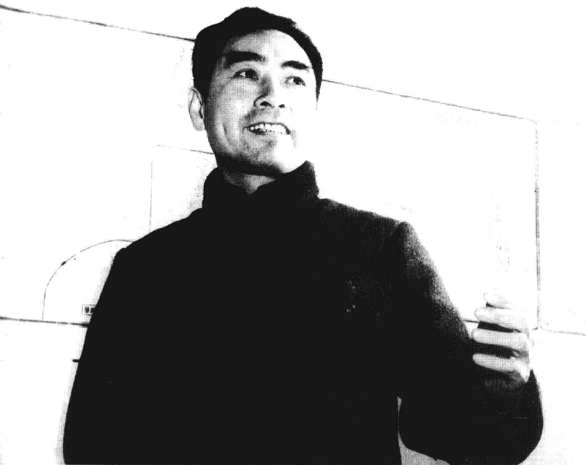
重庆时期的周恩来。