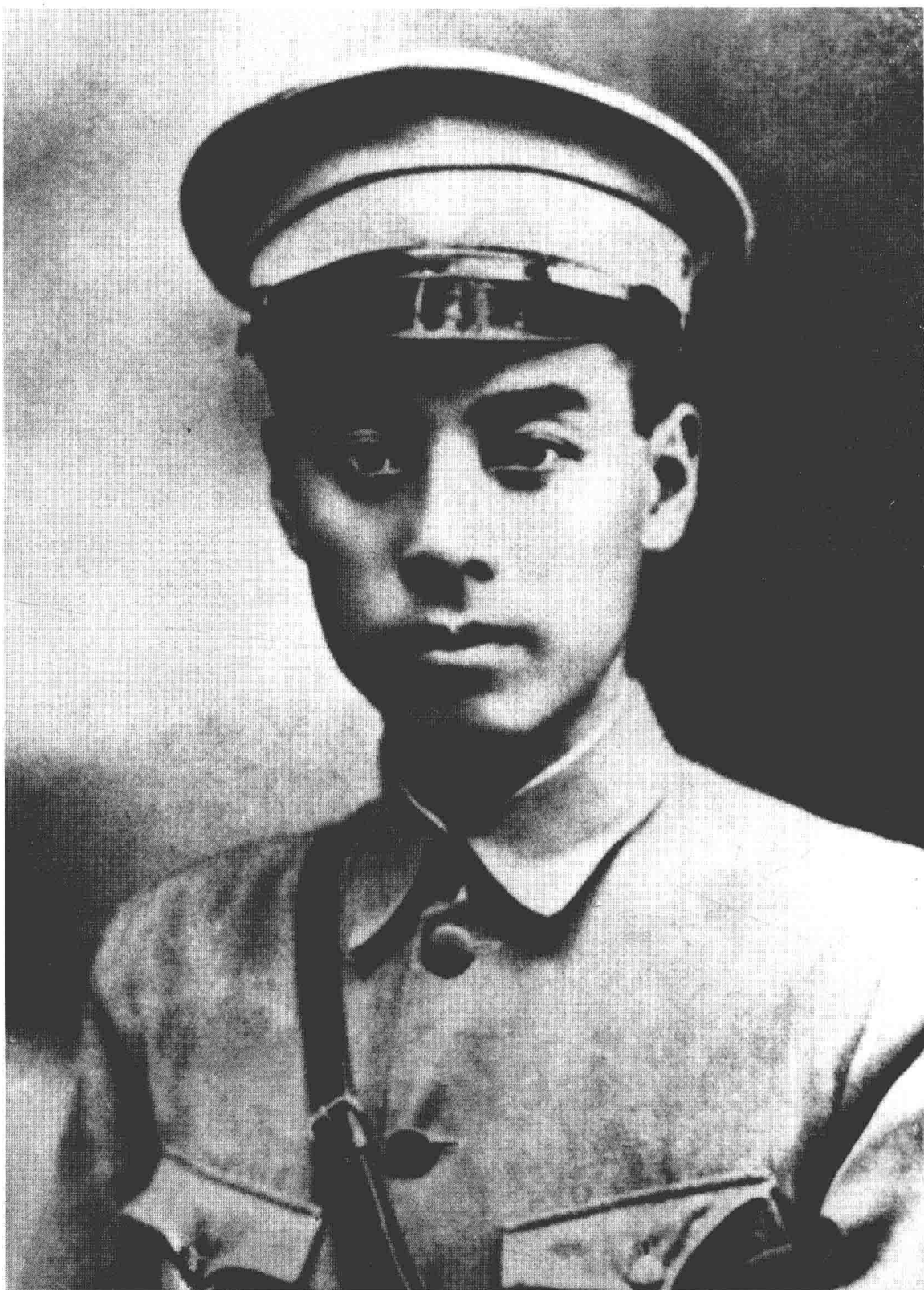
1924年11月，周恩来出任由国共两党合作创办的黄埔军校的政治部主任。他创建的行之有效的政治工作制度，使军校出现新面貌。