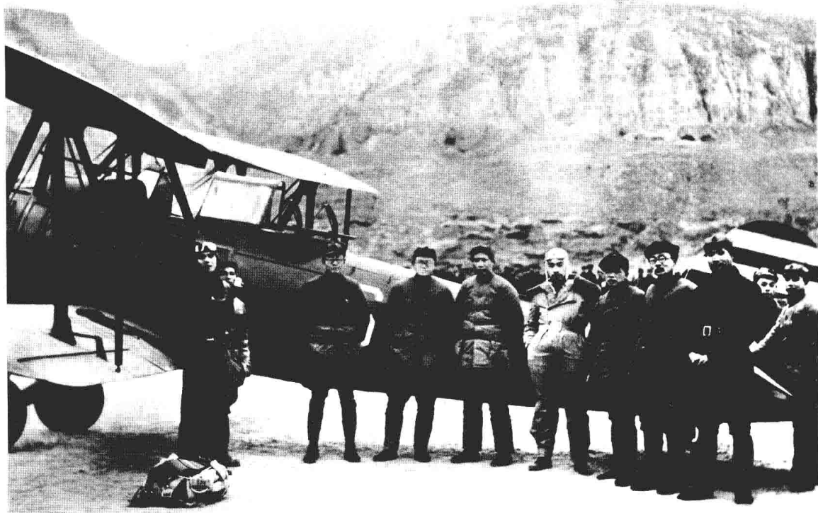
西安事变和平解决后，周恩来返抵延安时，在机场受到中共中央领导人欢迎。左三起：秦邦宪、张闻天、毛泽东、周恩来、彭德怀、林伯渠、萧劲光。