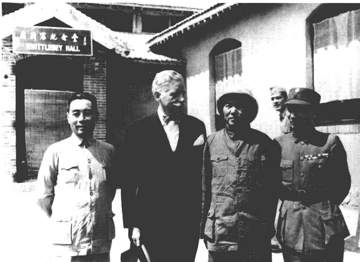
1945年8月，毛泽东、周恩来赴重庆与国民党谈判离开延安时，同张治中、赫尔利在驻延安美军视察组住处前合影。