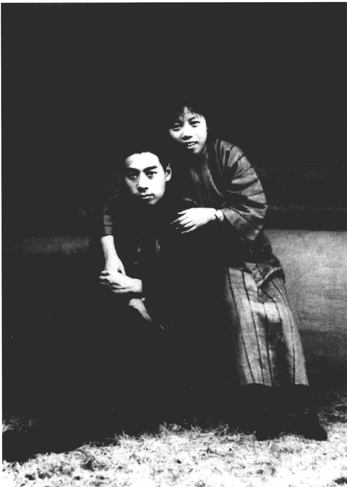
1925年8月8日，周恩来和邓颖超在广州结婚。这是1926年他任广东东江各属行政委员时和邓颖超在汕头合影。