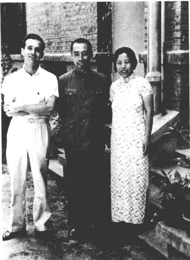
和新四军军长叶挺（右）、副军长项英在一起。