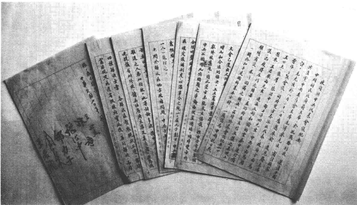
1945年10月10日，国共双方代表王世杰、张群、张治中、邵力子、周恩来、王若飞签订的《政府与中共代表会谈纪要》（即“双十协定”）。