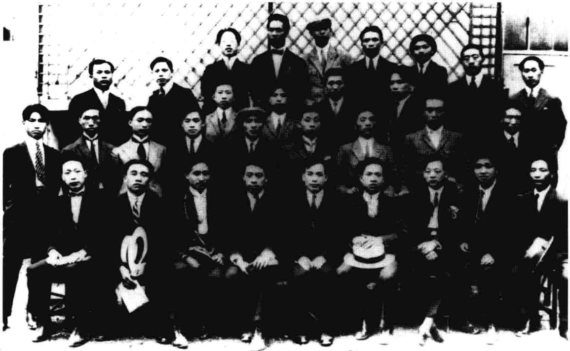
一九二四年攝於巴黎

1924年，中国社会主义青年团旅欧之部部分成员在巴黎合影。前排左四为周恩来，左六为李富春，左一为聂荣臻，后排右三为邓小平。