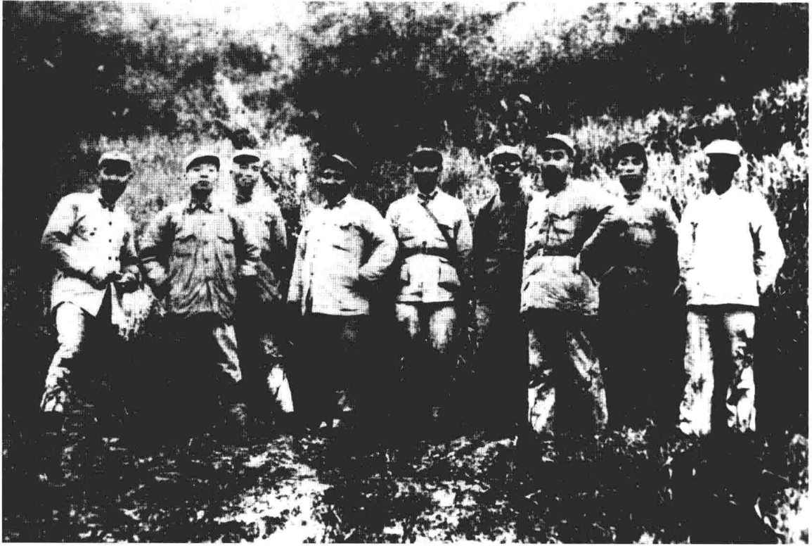
1933年12月，和红军第一方面军部分领导人在福建建宁合影。左起叶剑英、杨尚昆、彭德怀、刘伯坚、张纯清、李克农、周恩来、滕代远、袁国平。