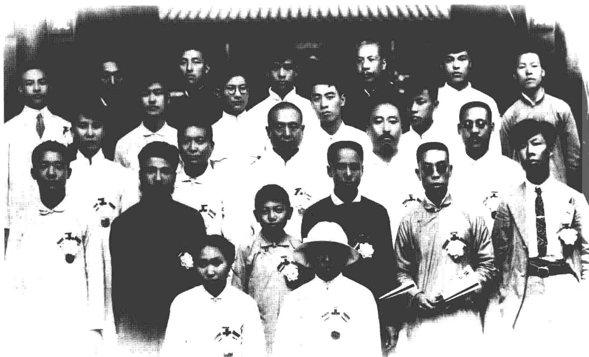
1920年1月，周恩来等在反帝爱国运动中被北洋军阀政府天津警察厅拘捕。在他们坚决斗争和各界爱国群众的声援下，反动当局被迫于7月将他们释放。这是周恩来等获释后的合影。