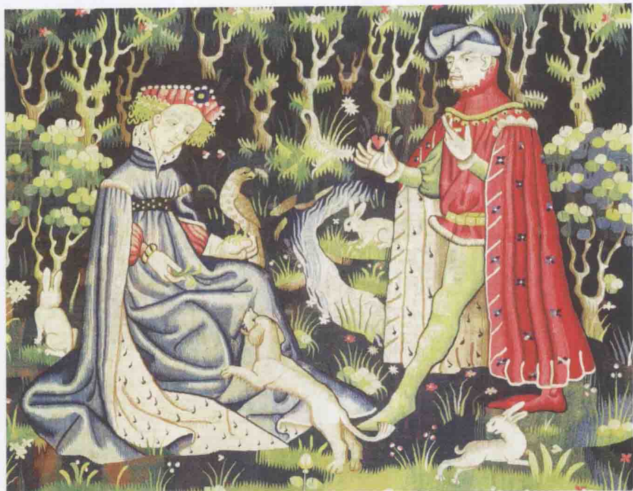
▲ 这幅挂毯《心之献祭》（约1400—1410）描绘了一位身穿红袍的年轻骑士的形象。他的上衣用胭脂虫卵染成，这种深红色被视为最尊贵的色彩，象征着封建特权。他倾注热情的对象身着蓝色衣物，这种颜色则与忠诚联系在一起。

时装这个概念通常被视作西方社会所特有，起源于14世纪的宫廷，当时正历经由农民装扮转向法国风格的强调轮廓、裁剪以及制作的缝纫技巧（上图）。很多服饰风格和织物因为禁奢法的限制无法为绝大多数民众所穿用，这就反映了阶级社会的特征。着装规定跨越了时代和地域，界定和分配出了社会地位的区别，例如日本德川幕府时代（1600—1868）对丝绸穿着的规定，1574年伊丽莎白一世和她的枢密院颁布了服装律令，禁止除公爵夫人、侯爵夫人及伯爵夫人之外的一切人等穿着包括黑貂皮在内的特定材质衣袍。