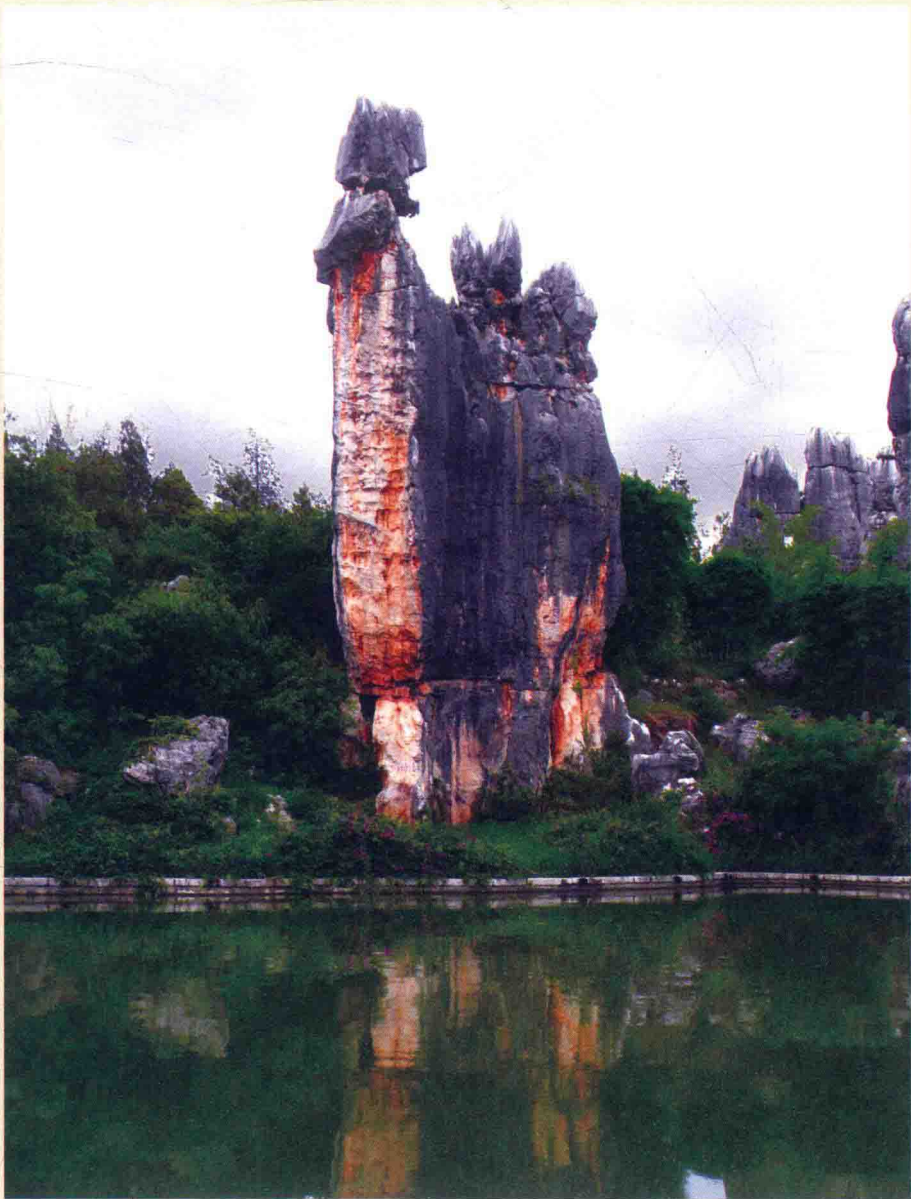
↑ 石林景区里的“阿诗玛”