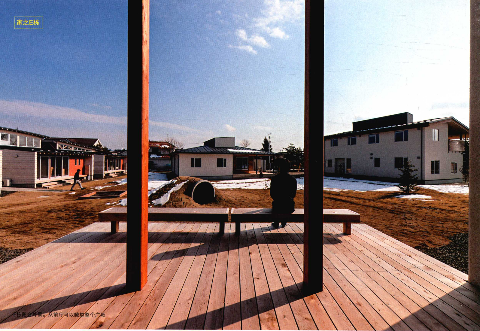
E栋阳台外景。从前厅可以瞭望整个广场