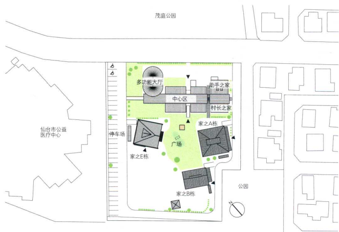
整体区域图 比例尺1:2000