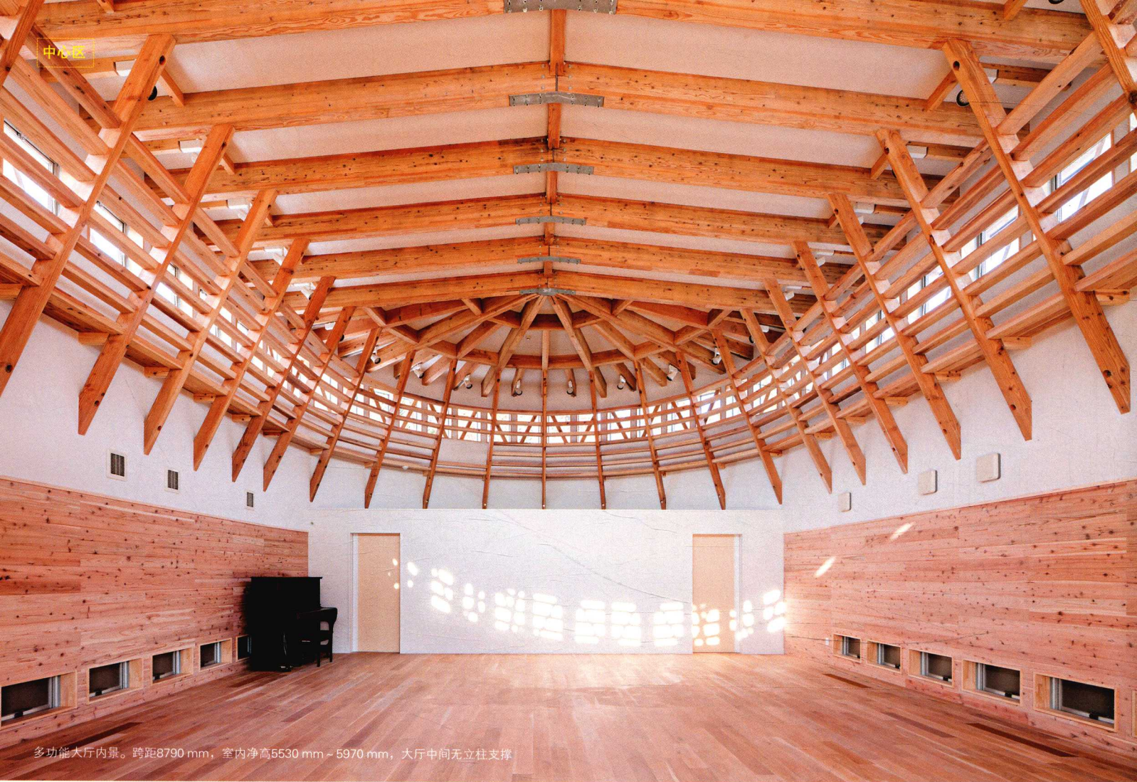
多功能大厅内景。跨距8790 mm，室内净高5530 mm - 5970 mm，大厅中间无立柱支撑