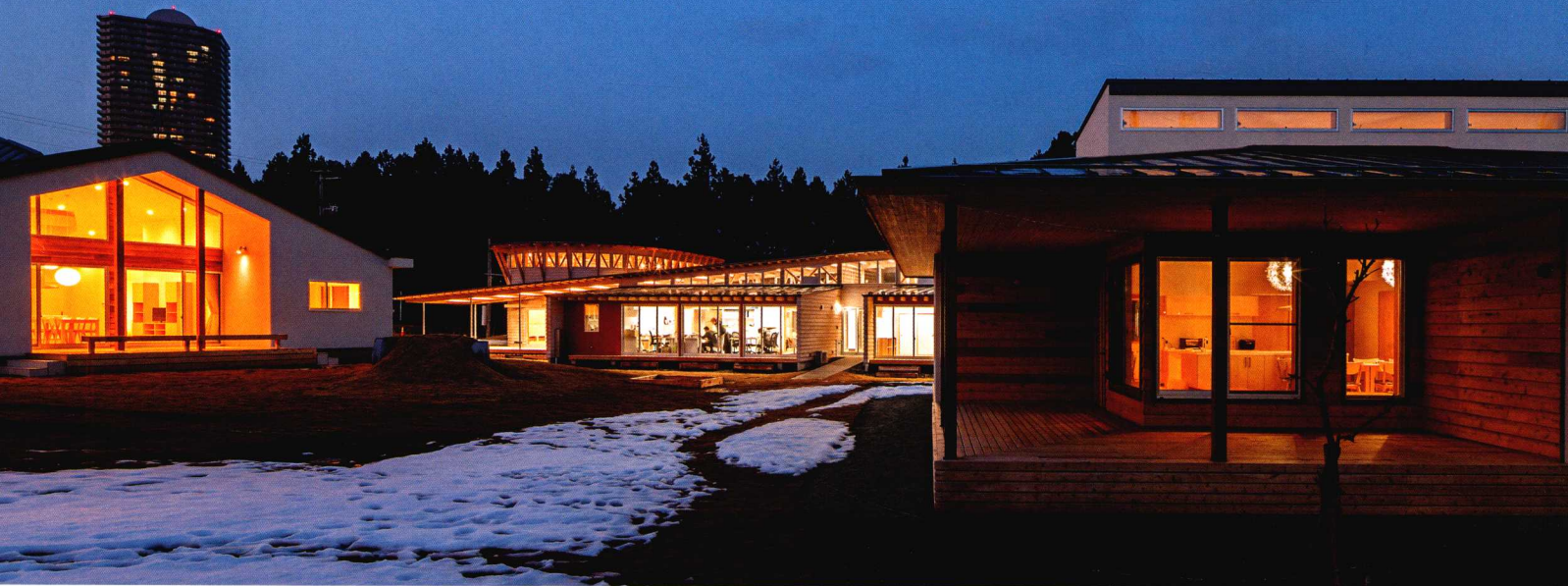
南侧夜景。连廊和阳台均面向广场而建，与此同时，为了使家之系列建筑具有家庭般的氛围，所有房屋都与外部道路相连