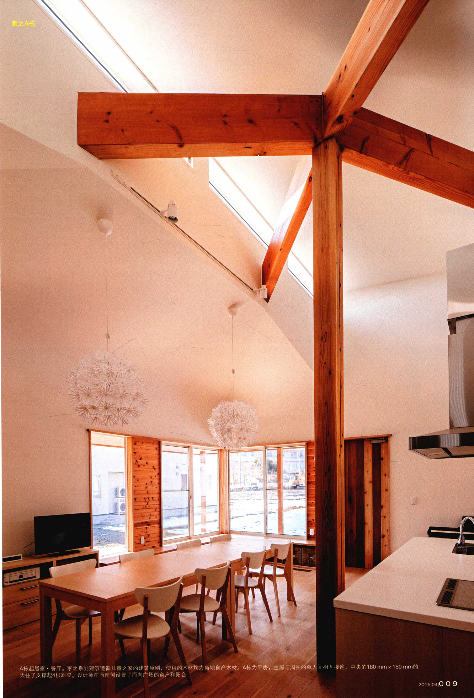
A栋起居·餐厅。家之系列建筑遵循儿童之家的建筑原则，使用的木材均为当地自产木材。A栋为平房，主屋与周围的单人间相互连接，中央的180 mm × 180 mm的大柱子支撑起4根斜梁。设计师在西南侧设置了面向广场的窗户和阳台