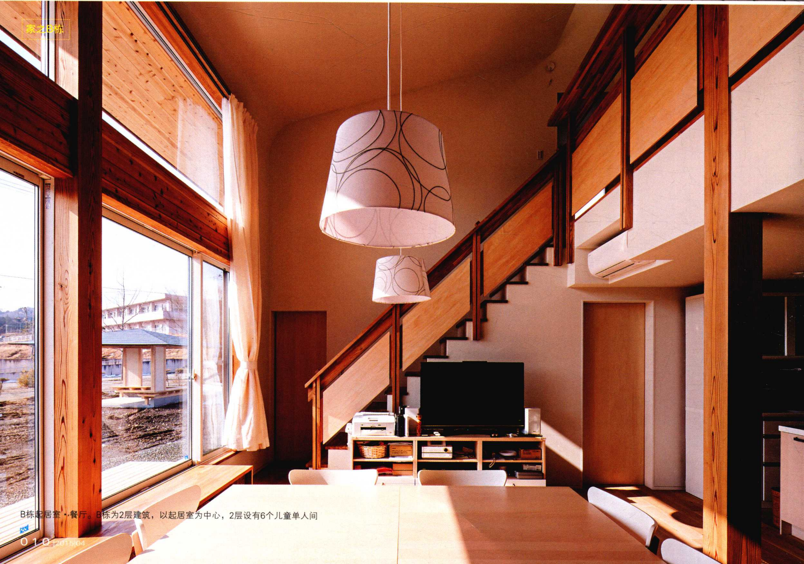
B栋起居室·餐厅。B栋为2层建筑，以起居室为中心，2层设有6个儿童单人房