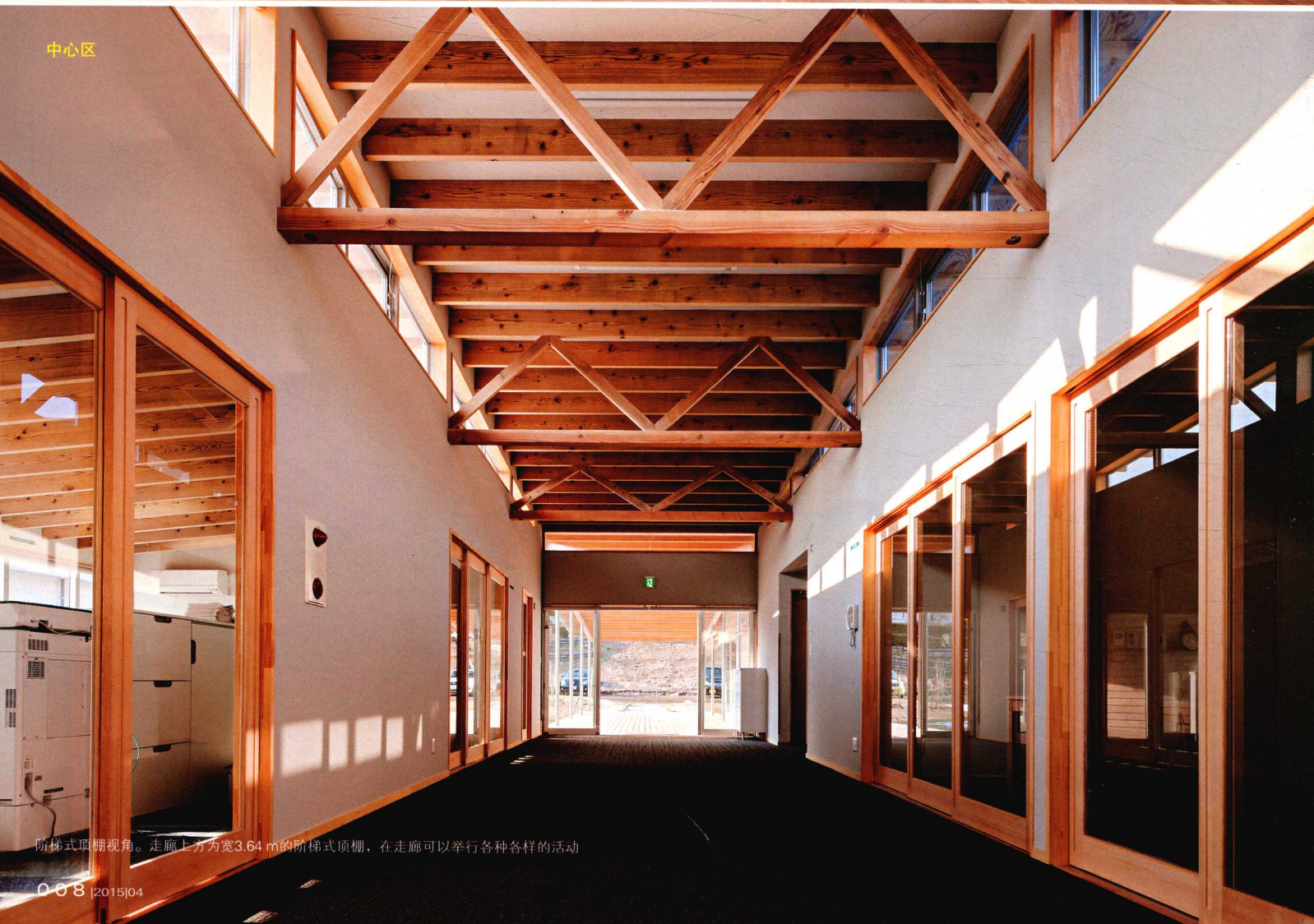
阶梯式顶棚视角。走廊上方为宽3.64 m的阶梯式顶棚，在走廊可以举行各种各样的活动