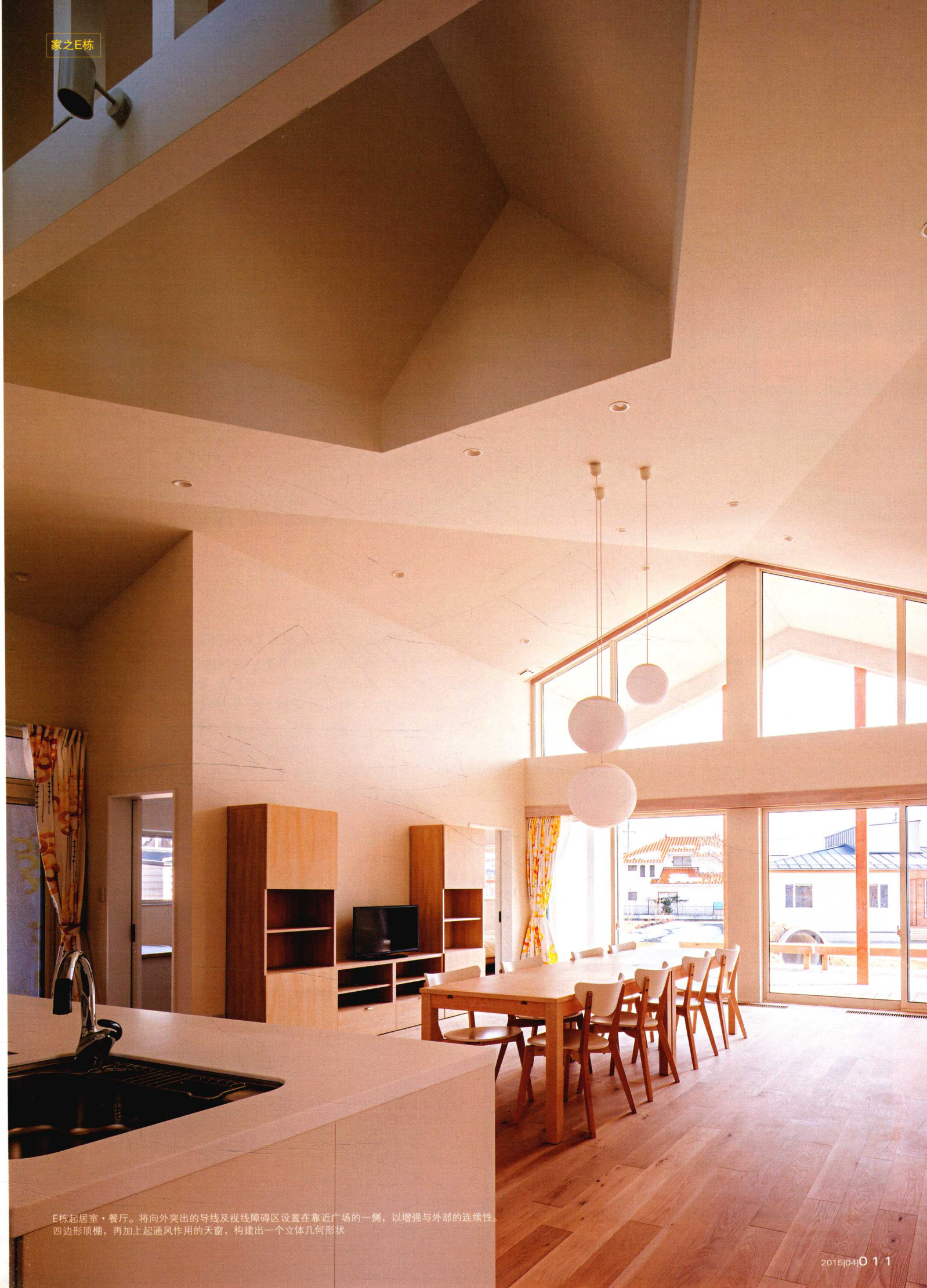
E栋起居室·餐厅。将向外突出的导线及视线障碍区设置在靠近广场的一侧，以增强与外部的连续性。四边形顶棚，再加上起通风作用的天窗，构建出一个立体几何形状