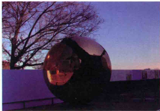
图 1-12 《破碎的地球》雕塑

城市景观雕塑是人与社会环境和自然环境的交流，是与自然、社会发展的和谐统一。它的综合特征包括自然美学、环境、人文、生态等不同的方面的特征，必须遵循公共的属性，才能融入公众的群体之中。当代艺术成为一种文化沟通与精神的激励，它表现为对公共想象力的培养和对公众民主的培养。群众个体对公共性的理解是不尽相同的，但自由和交流是公共性的基础。所以，并不是将雕塑放到公共环境中就是好的公共艺术。对艺术家来说，站在艺术的前沿、具有独创性、对公共事业抱以认真态度才能创作出优秀的公共艺术品。为了使大众接受艺术家的独特视角，就必须将公共性和亲和力融入艺术语言中。