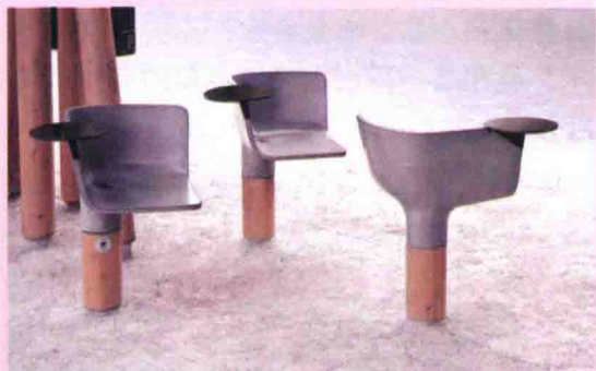
图 1-3 城市公共景观设施 (3)