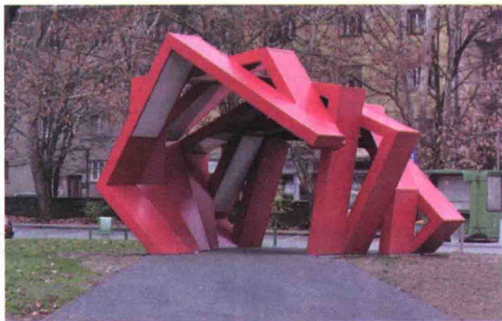
图 1-13 南斯拉夫卢布尔雅那雕塑

美国芝加哥广场的景观雕塑，位于芝加哥千禧公园云门，芝加哥人称之为“豆子 (The Bean)”，如图 1-14 所示。它由英国设计师安易斯 (Anish) 设计，整个雕塑用高度抛光不锈钢打造，表面采用镜面处理，整个雕塑像一面球形的镜子，在映照出芝加哥市的摩天大楼和天空的朵朵白云的同时，也如一个巨大哈哈镜，当人们站在它面前时，自己也和四周的建筑融合在一起，吸引游人驻足欣赏雕塑映出的别样的自己。