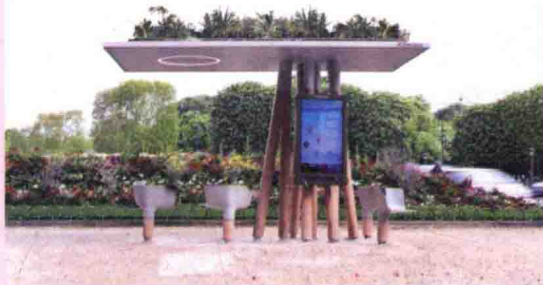
图 1-1 城市公共景观设施 (1)