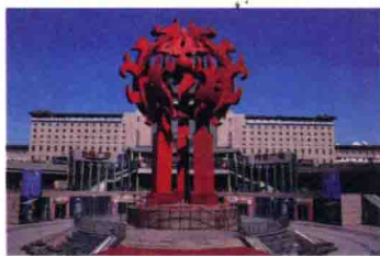
北京西站广场雕塑

按功能性质可分为纪念性、象征性、标志性、陈列性、装饰性、趣味性、商业性景观雕塑。按地理位置分类,这些景观雕塑在城市公共环境中又可分为广场雕塑、街区雕塑、步行道雕塑、公共建筑雕塑、园林雕塑、水景雕塑、地景艺术、雕塑公园等,如图 1-9 所示。