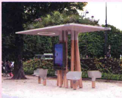
图 1-4 城市公共景观设施 (4)