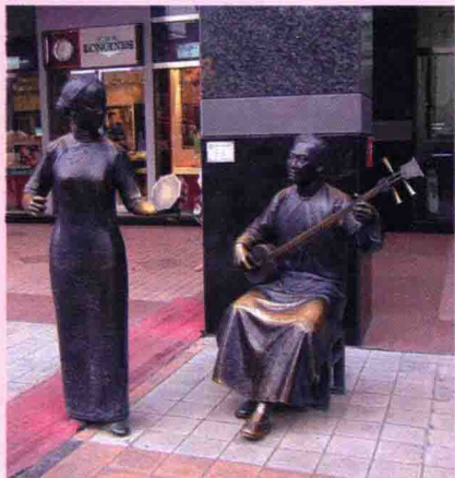
民国老北京人唱古戏的场景雕塑