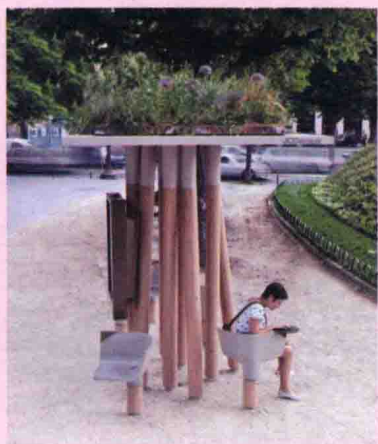
图 1-5 城市公共景观设施 (5)