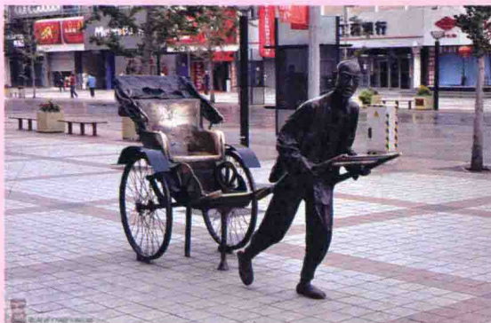
晚清拉洋车的人与老洋车雕塑