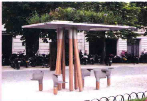
图 1-2 城市公共景观设施 (2)