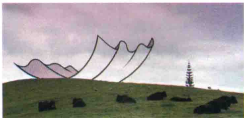
图 1-16 新西兰创意雕塑

城市景观雕塑是为特定环境而设计的，它与环境形成了一个整体。人们可以不去博物馆参观出土文物，也可以不去美术馆或画廊欣赏绘画或架上雕塑，但只要人们处在环境之中，就不得不看其中的雕塑，这也形成了一种强制欣赏性。强制欣赏性使得城市景观雕塑可以陶冶人们的心灵，教化人们的思想，引导人们的审美观。