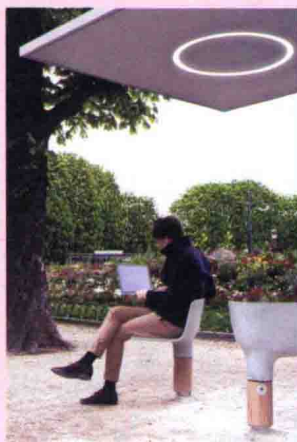
图 1-6 城市公共景观设施 (6)