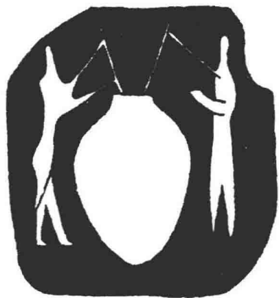
这幅图案刻制在一枚图章上，发现于美索不达米亚地区的提坡高拉。图案大约刻制于公元前 4000 年，表现了两人用苇管从大酒坛中吸饮啤酒的场景。

我们还不知道人类酿造世界上第一桶啤酒的确切时间，但可以确定，公元前 1 万年以前是没有啤酒的。啤酒在近东地区广为饮用应该是在公元前 4000 年。这可以从一幅发现于美索不达米亚地区（今天的伊拉克地区）的壁画上找到证据，上面画着两人正用苇管从一个陶制大酒坛中吸饮啤酒（因为古时酿的啤酒表面会漂有谷粒、谷壳和其他杂质，古人用苇管吸饮以避免把杂质喝进嘴里）。