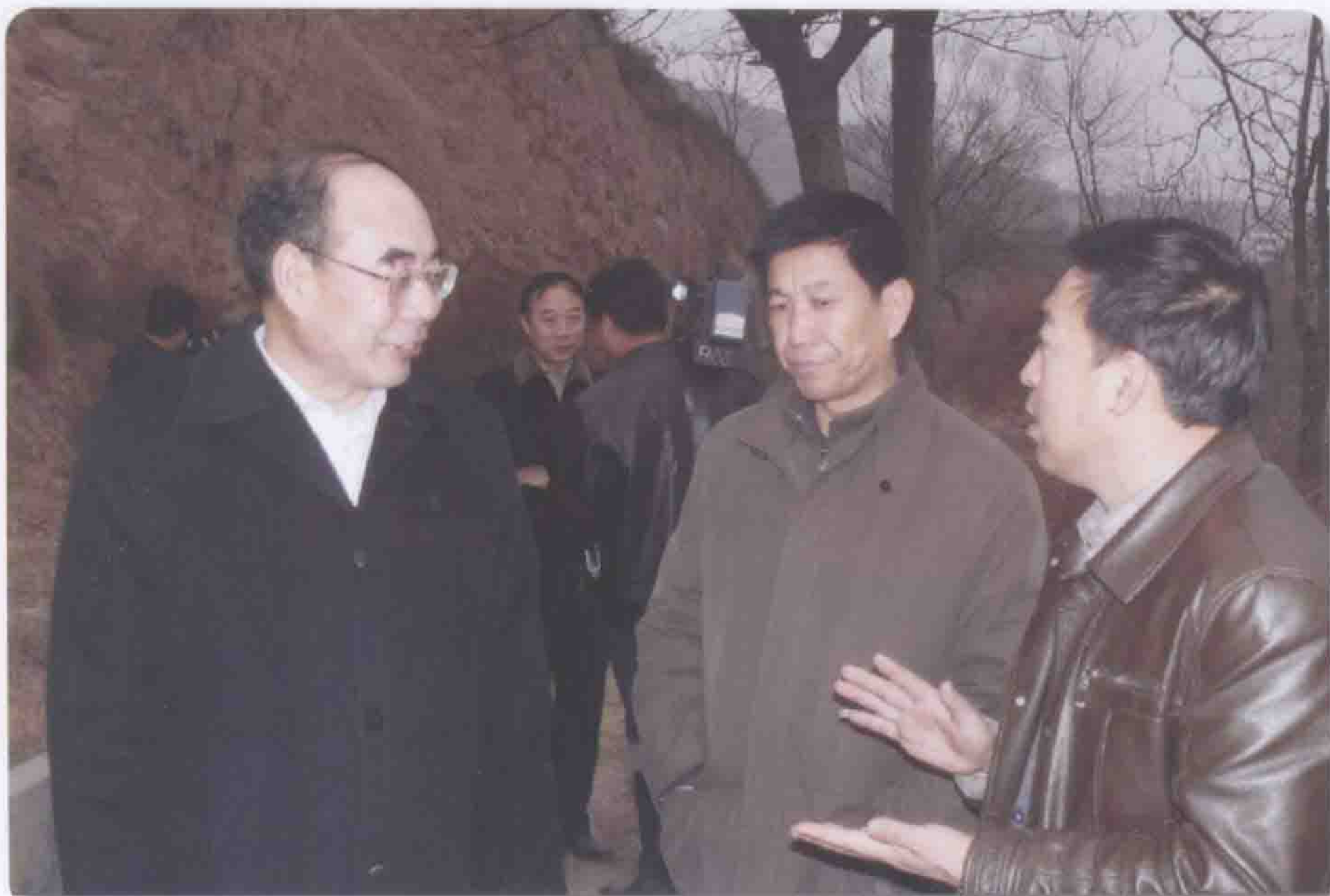
2009年2月7日天水市市长李文卿（左一）检查抗旱工作