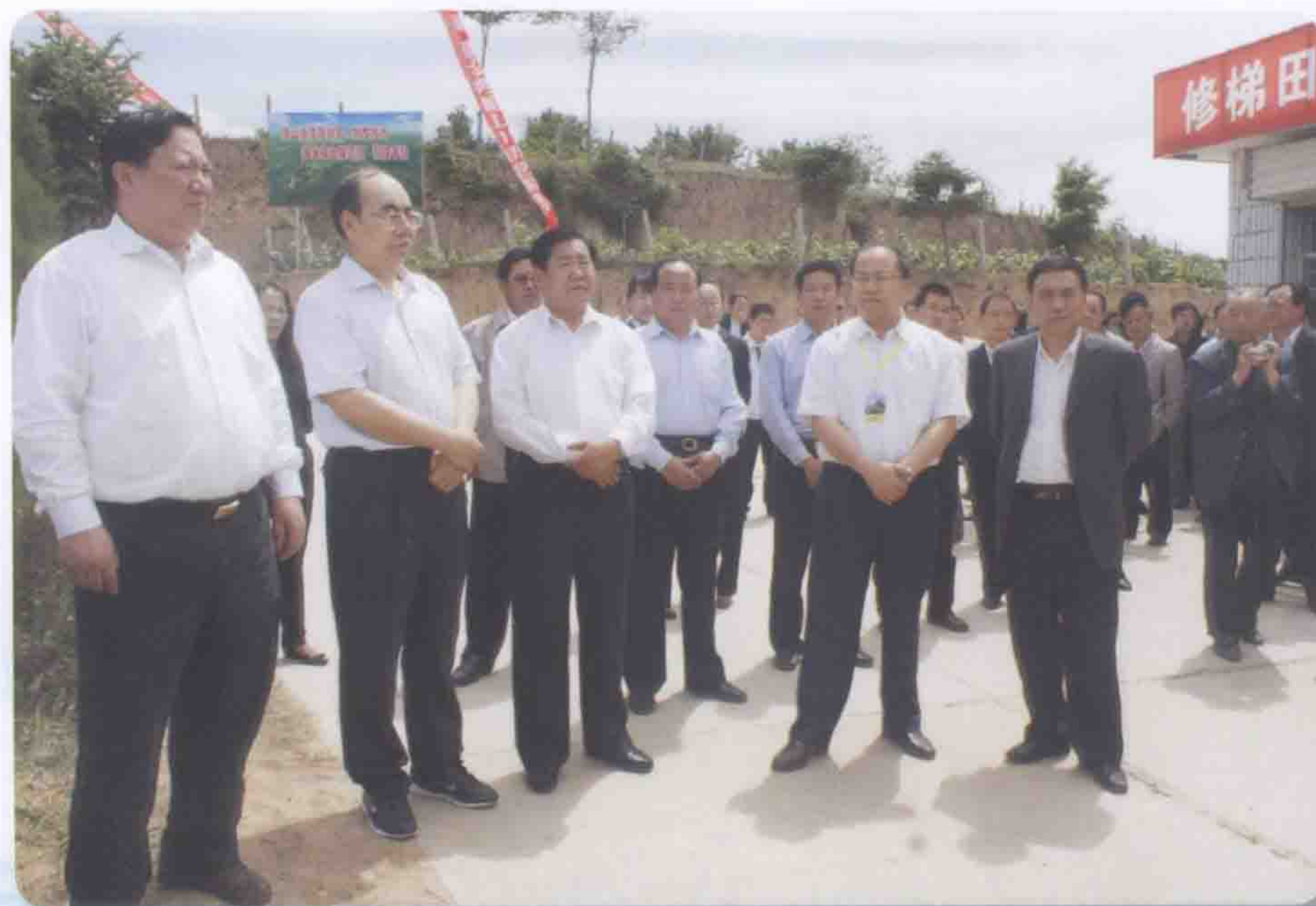
2010年6月9日全省梯田建设现场会在水召开，甘肃省副省长泽巴足（左一）、天水市市长李文卿（左二）、甘肃省水利厅厅长康国玺（左三）、天水市副市长彭鸿嘉（左四）、天水市水务局局长薄海明（左五）参加了现场会