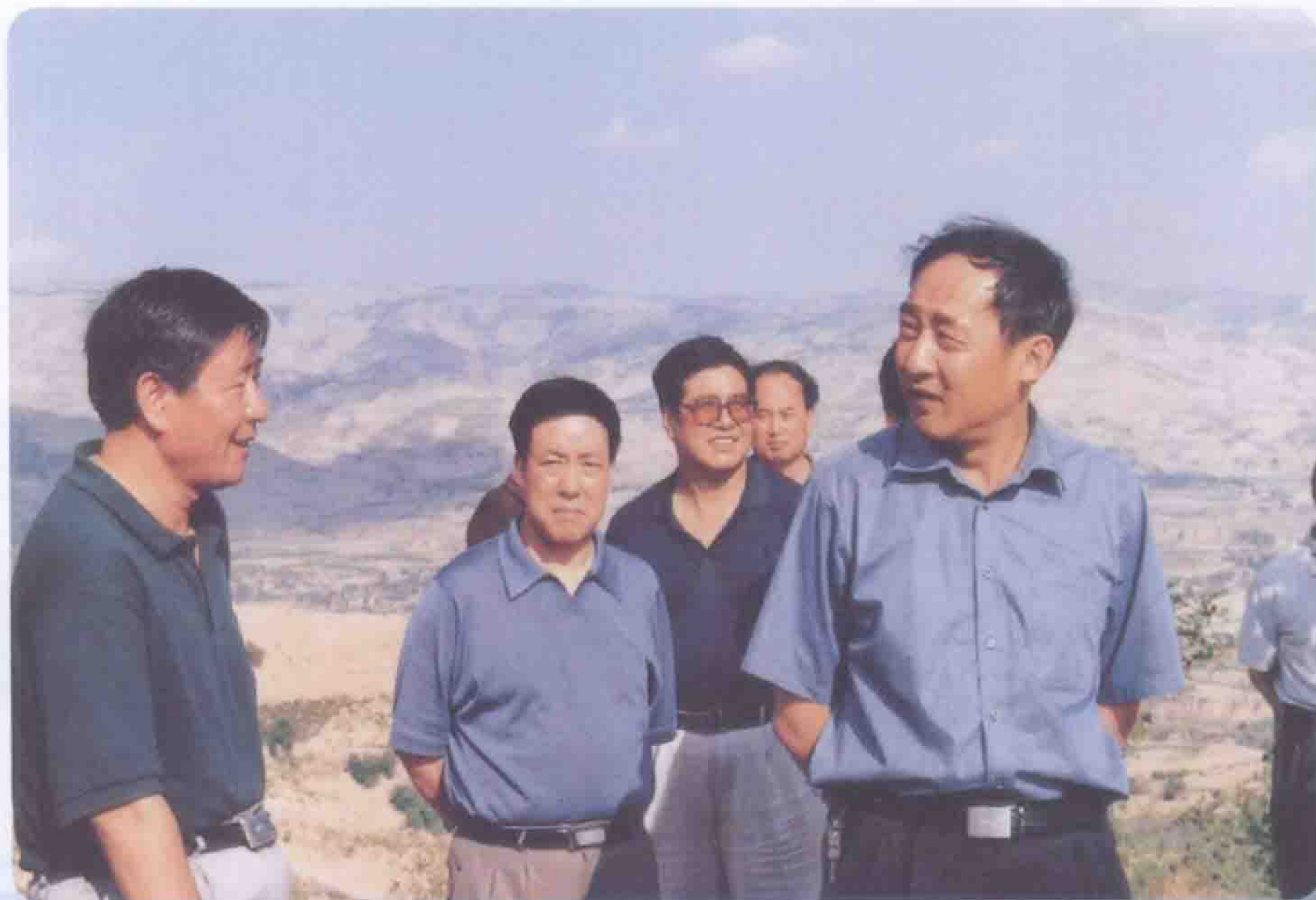
2003年8月中共天水市委书记赵春（右一）检查藉河示范区工程