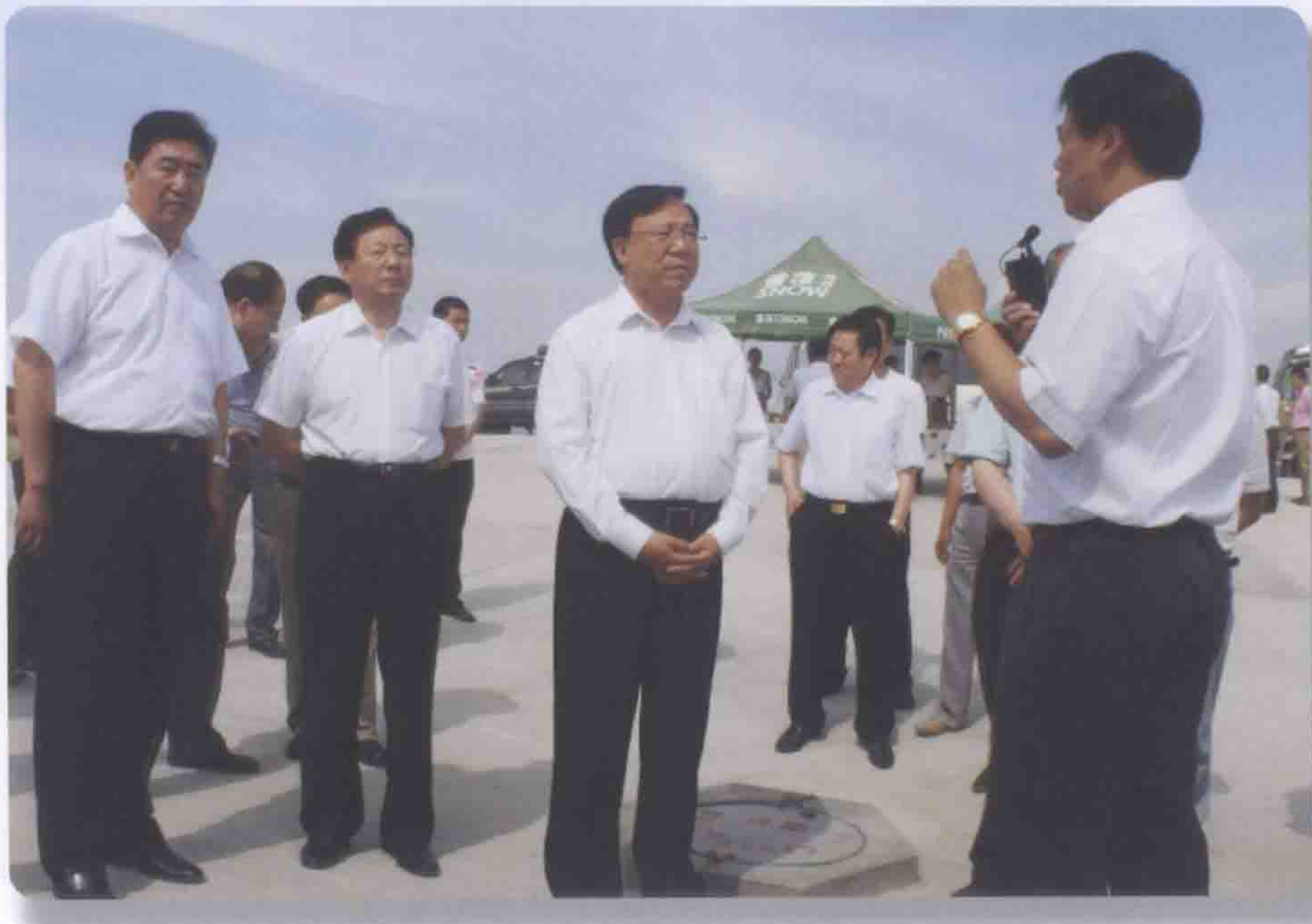
2010年6月22日甘肃省委书记陆浩（中）在天水市秦安县千户梁视察工作