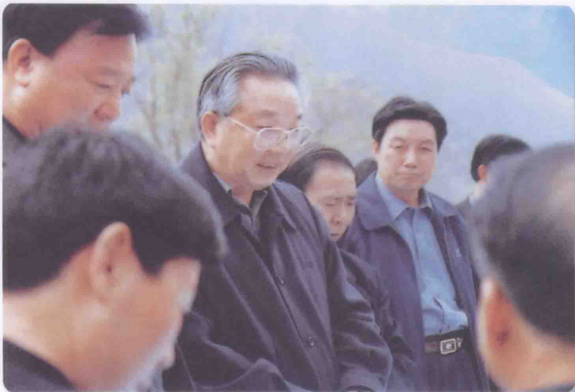
2002年11月27日中共甘肃省委书记宋照肃（左三）视察藉河示范区工程