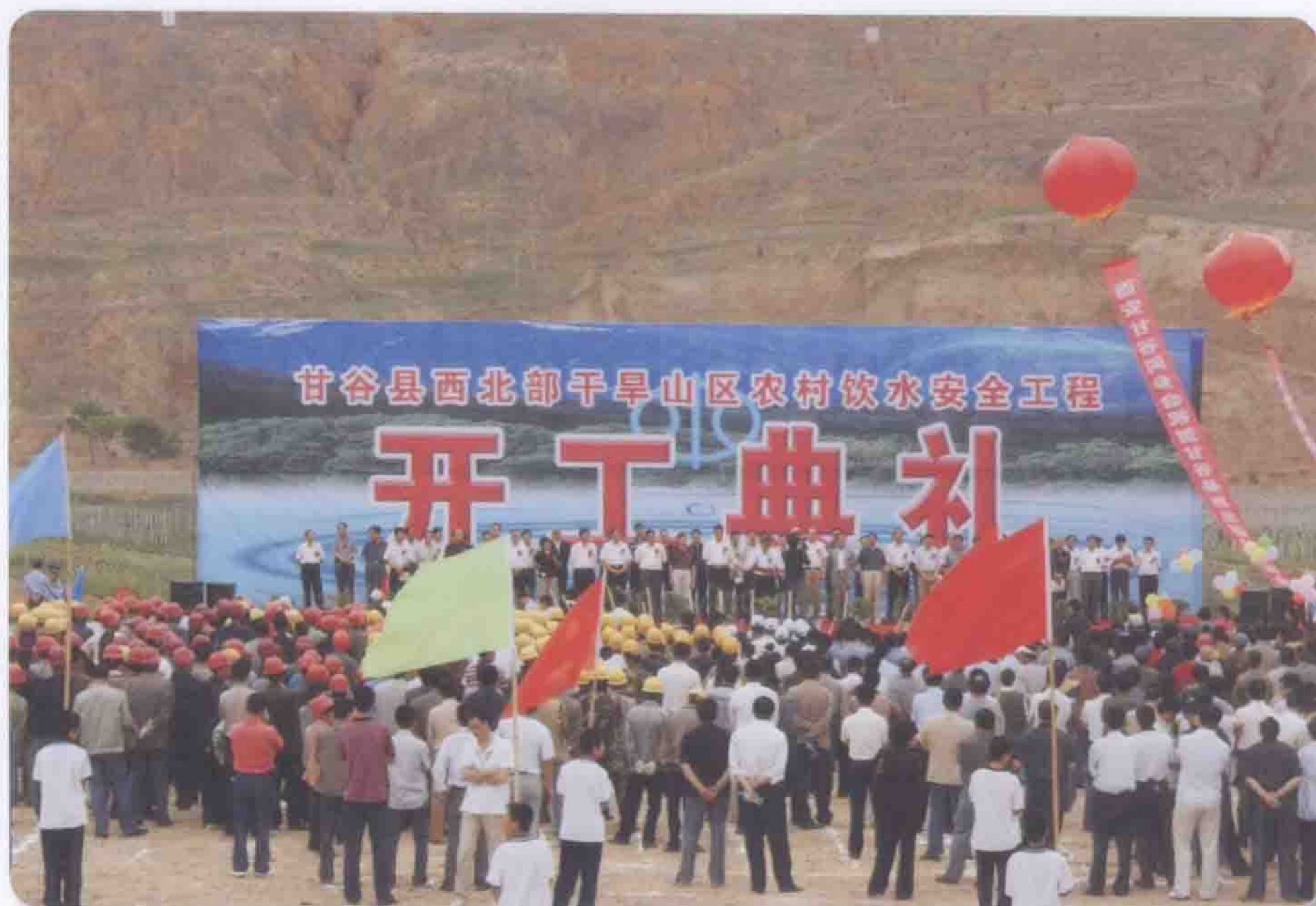
2009年6月9日甘谷县西北部干旱山区农村安全饮水工程开工典礼