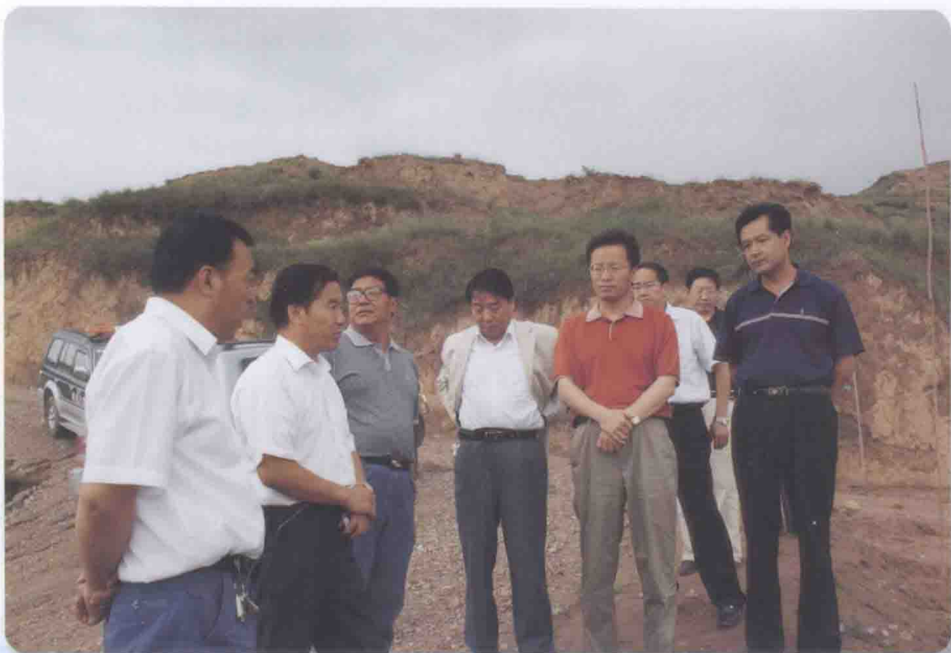
2008年8月14日甘肃省水利厅厅长许文海（右二）在甘谷县检查工作