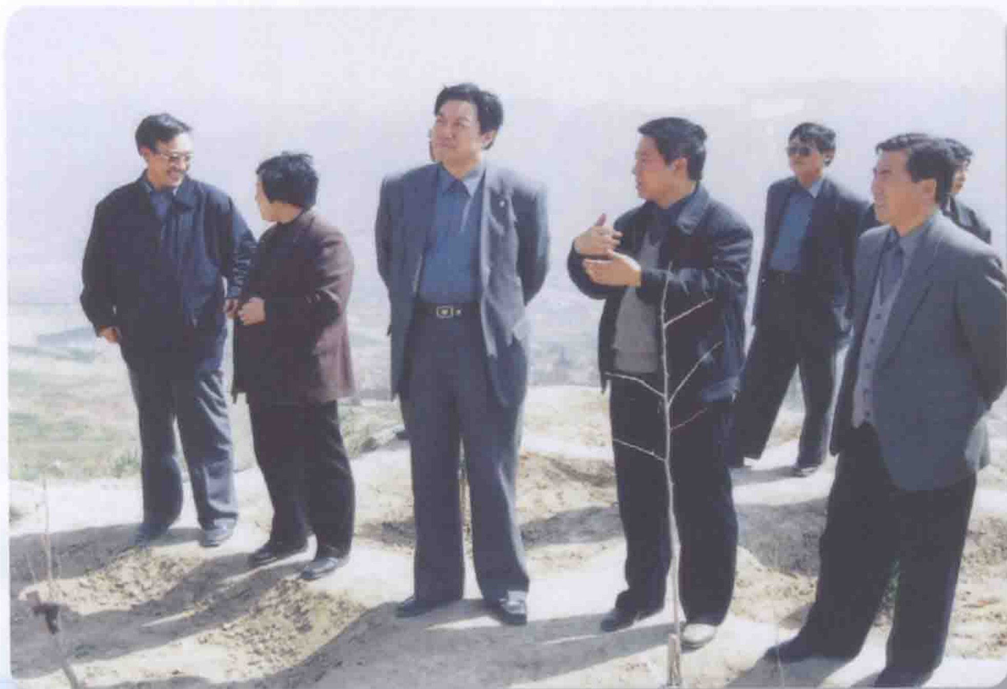
2000年3月中共天水市委书记张津梁（左三）检查藉河示范区工程