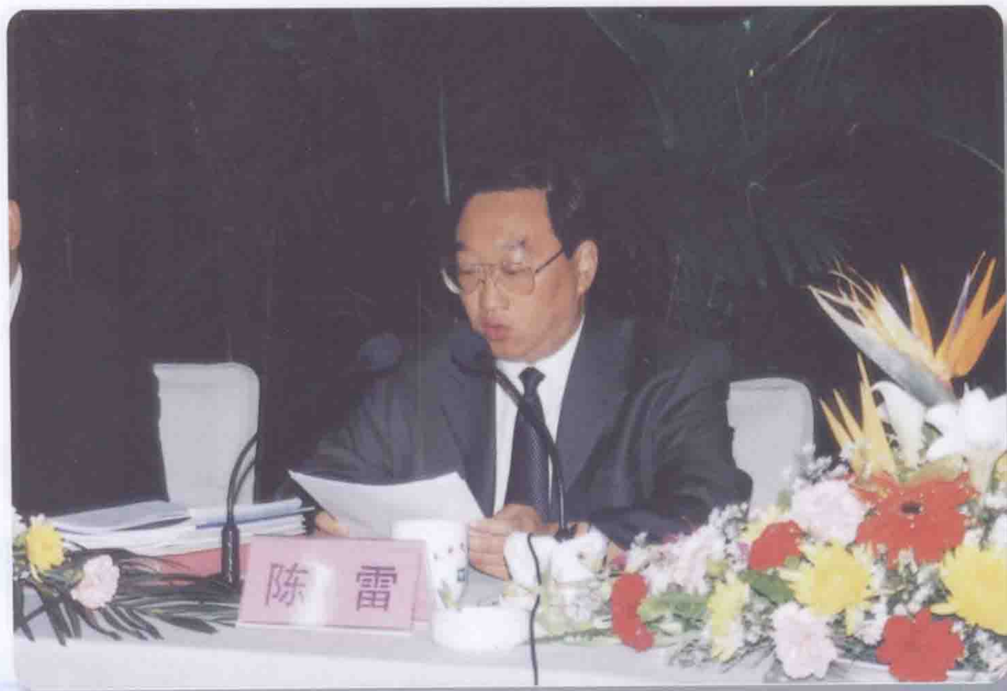
2002年9月17日水利部副部长陈雷在天水市藉河示范区黄河水保生态工程天水现场经验交流暨表彰会上