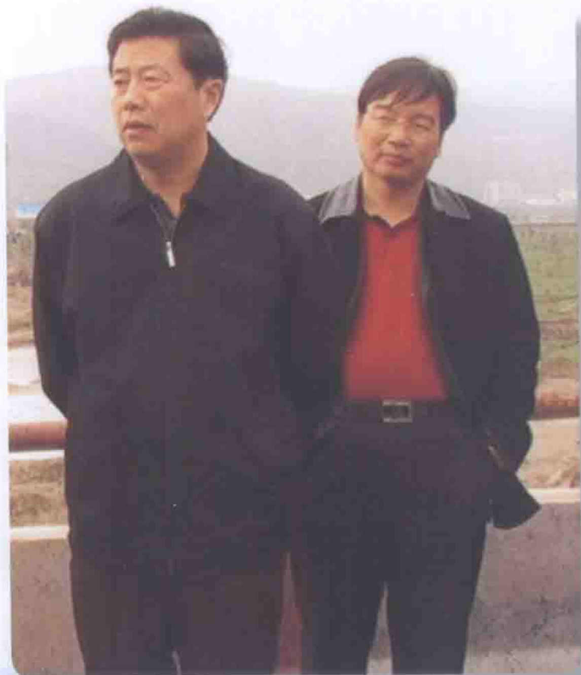
2004年10月21日水利部副部长鄂竟平（左）在天水视察工作