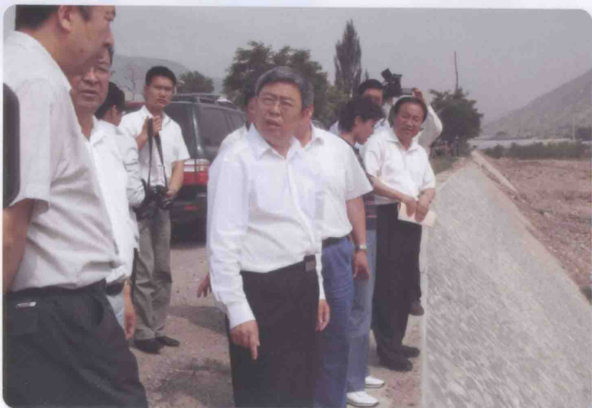
2008年6月10日甘肃省副省长刘永富（中）检查武山县响河沟堤防工程