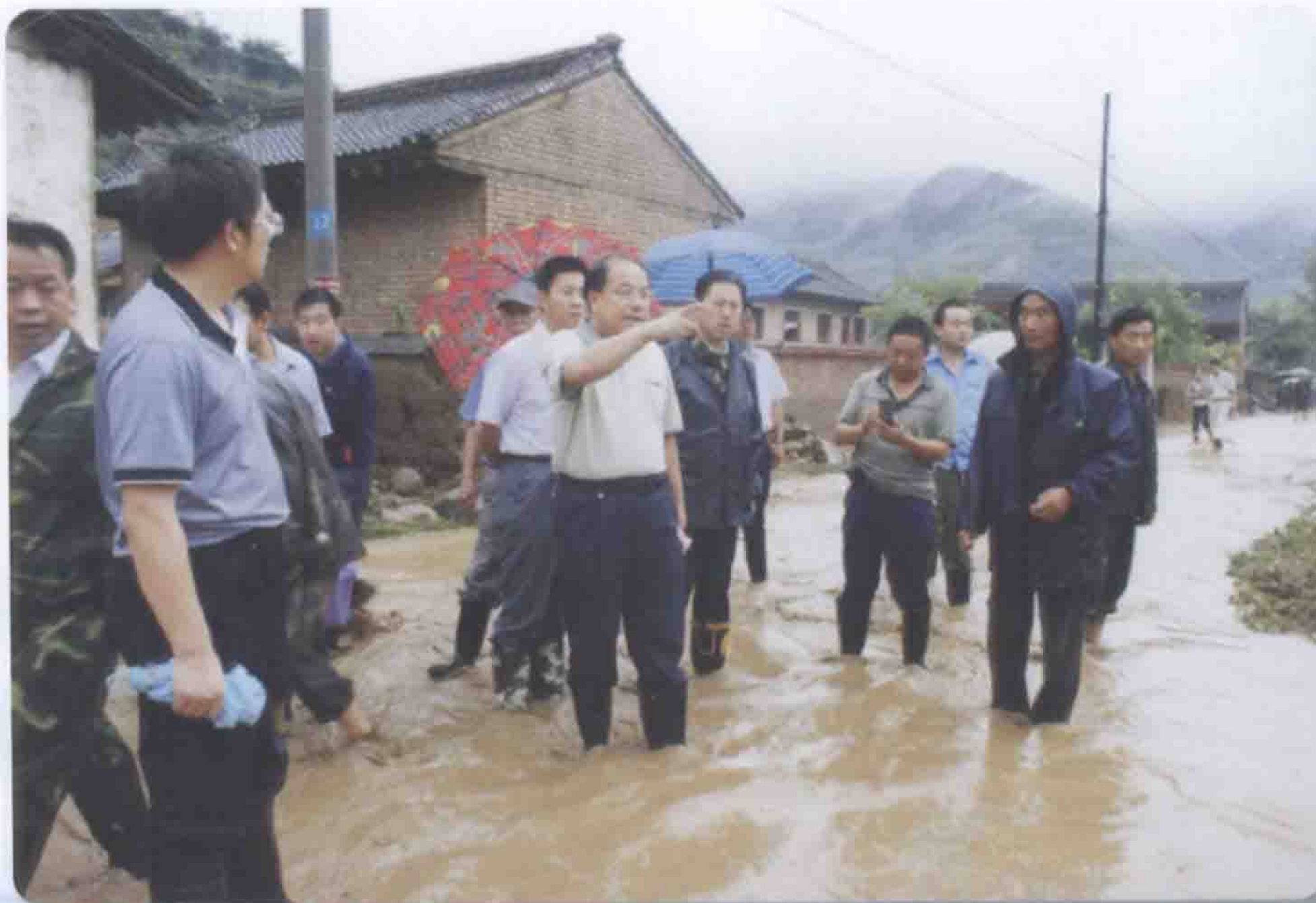
2010年8月12日天水市副市长彭鸿嘉(中) 率队赶赴秦州区娘娘坝乡，现场指挥抢救遭受水灾灾民