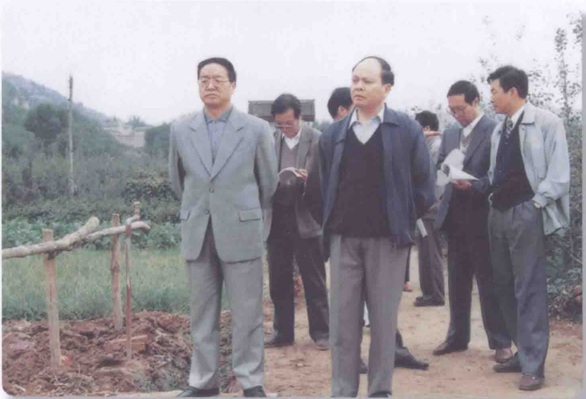
2001年10月31日黄委会副主任黄自强（中）视察藉河示范区工程