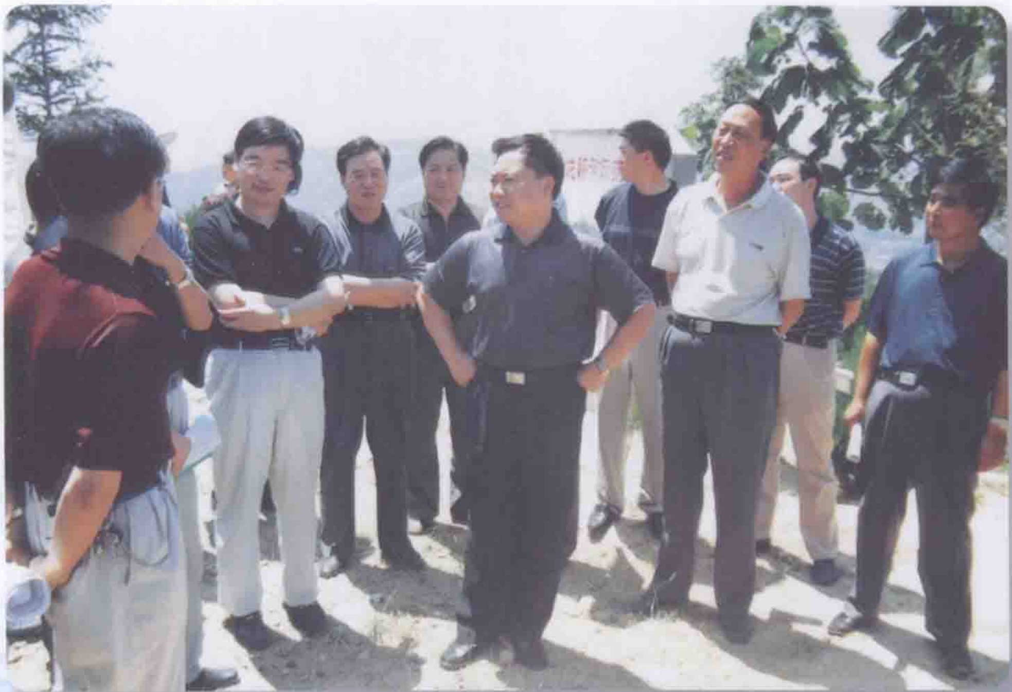
2002年8月6日黄委会主任李国英（中）在黄河上中游管理局局长周月鲁（左二）甘肃省水利厅厅长盛维德（左三）的陪同下视察藉河示范区工程