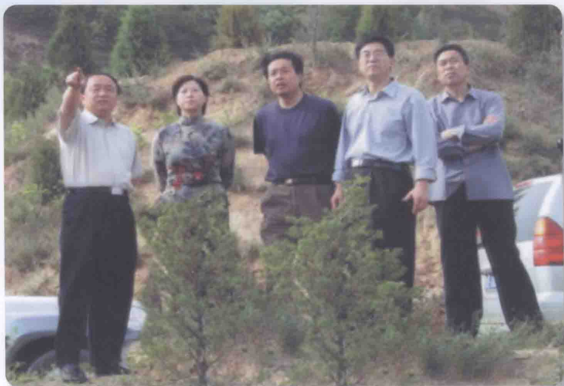
2004年6月天水市政府市长张广智（左一）检查藉河示范区工程