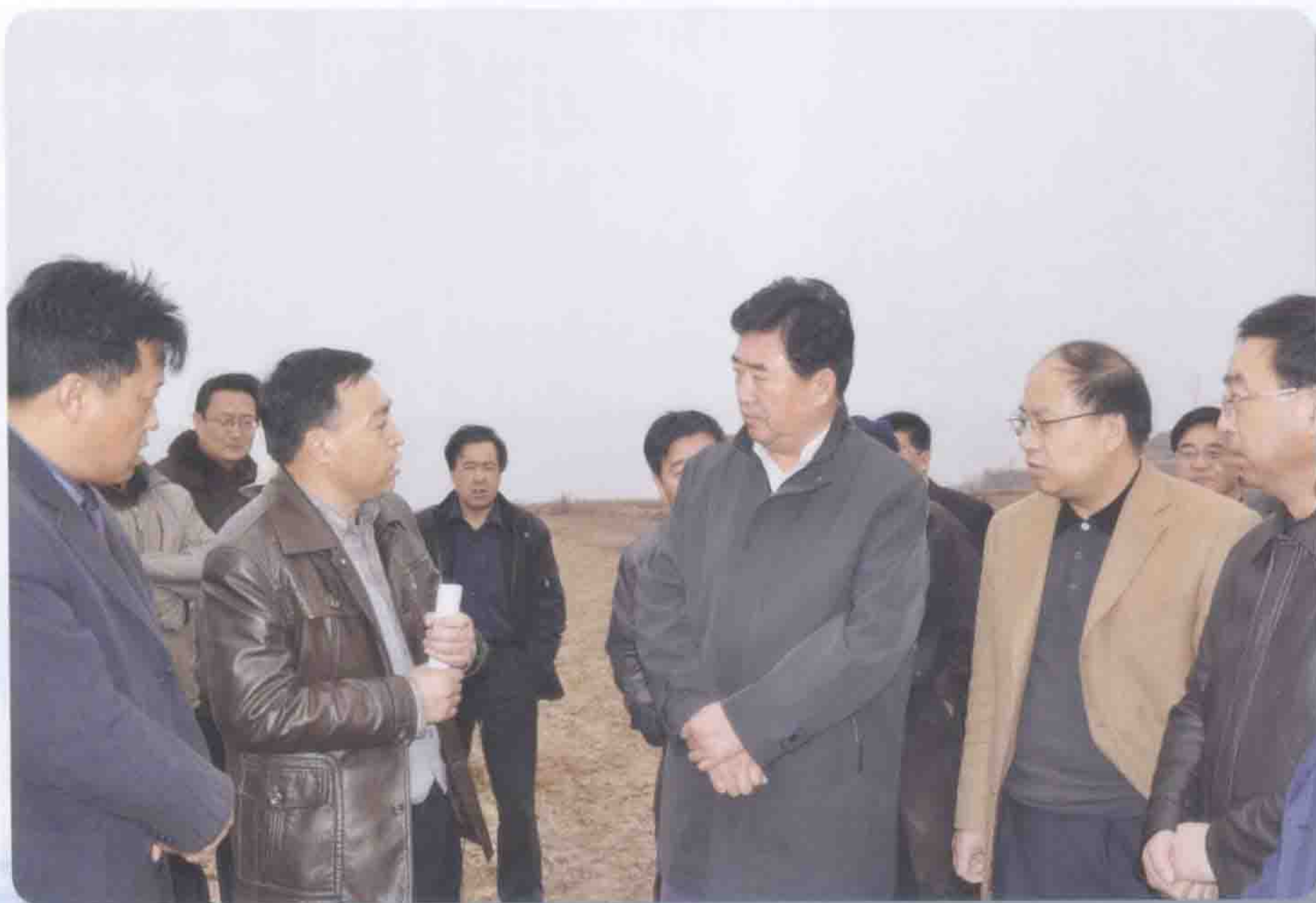
2009年2月11日天水市市委书记张景辉（中）检查指导抗旱工作