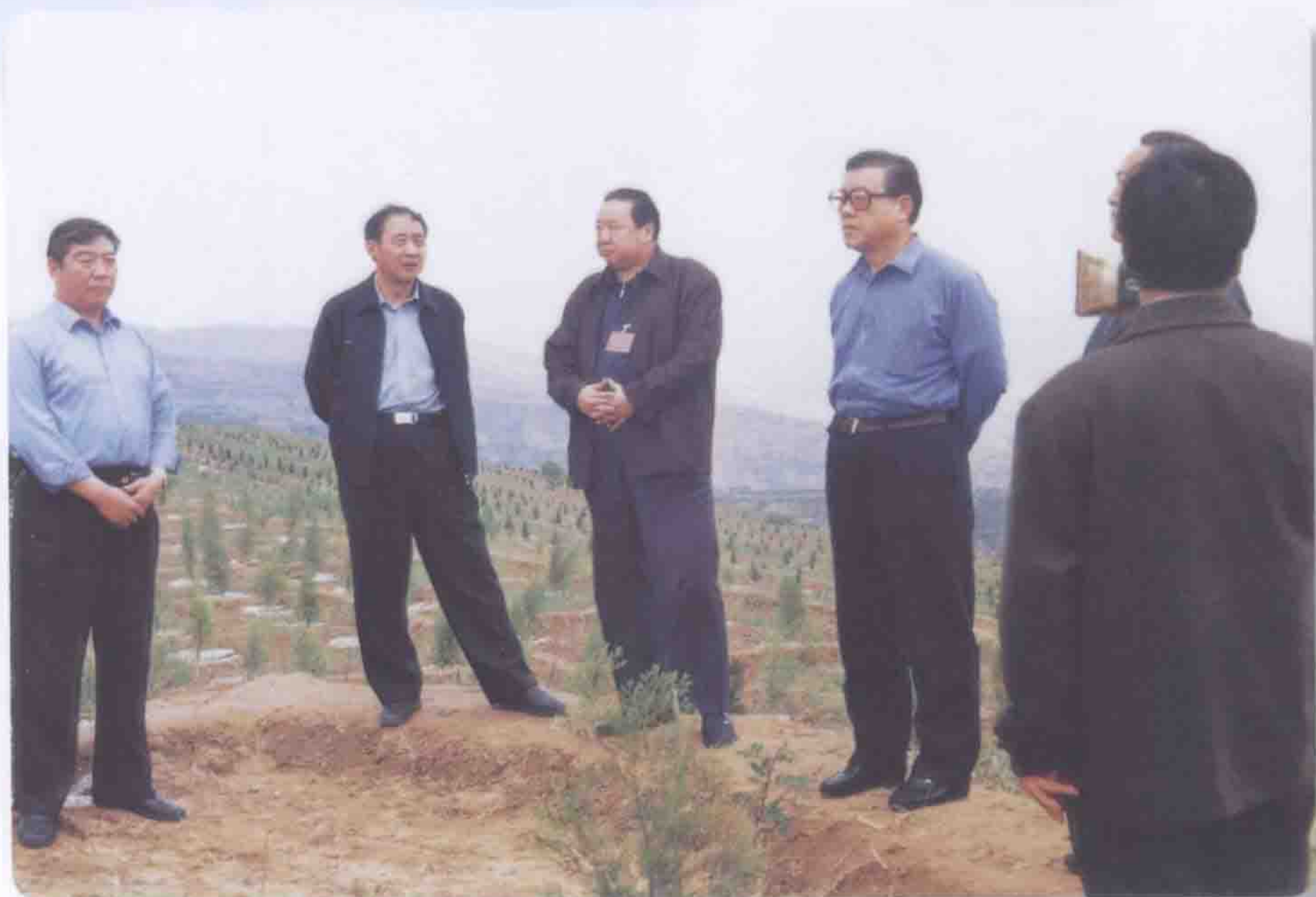
2002年9月16日甘肃省副省长负小苏（左一）视察藉河示范区工程