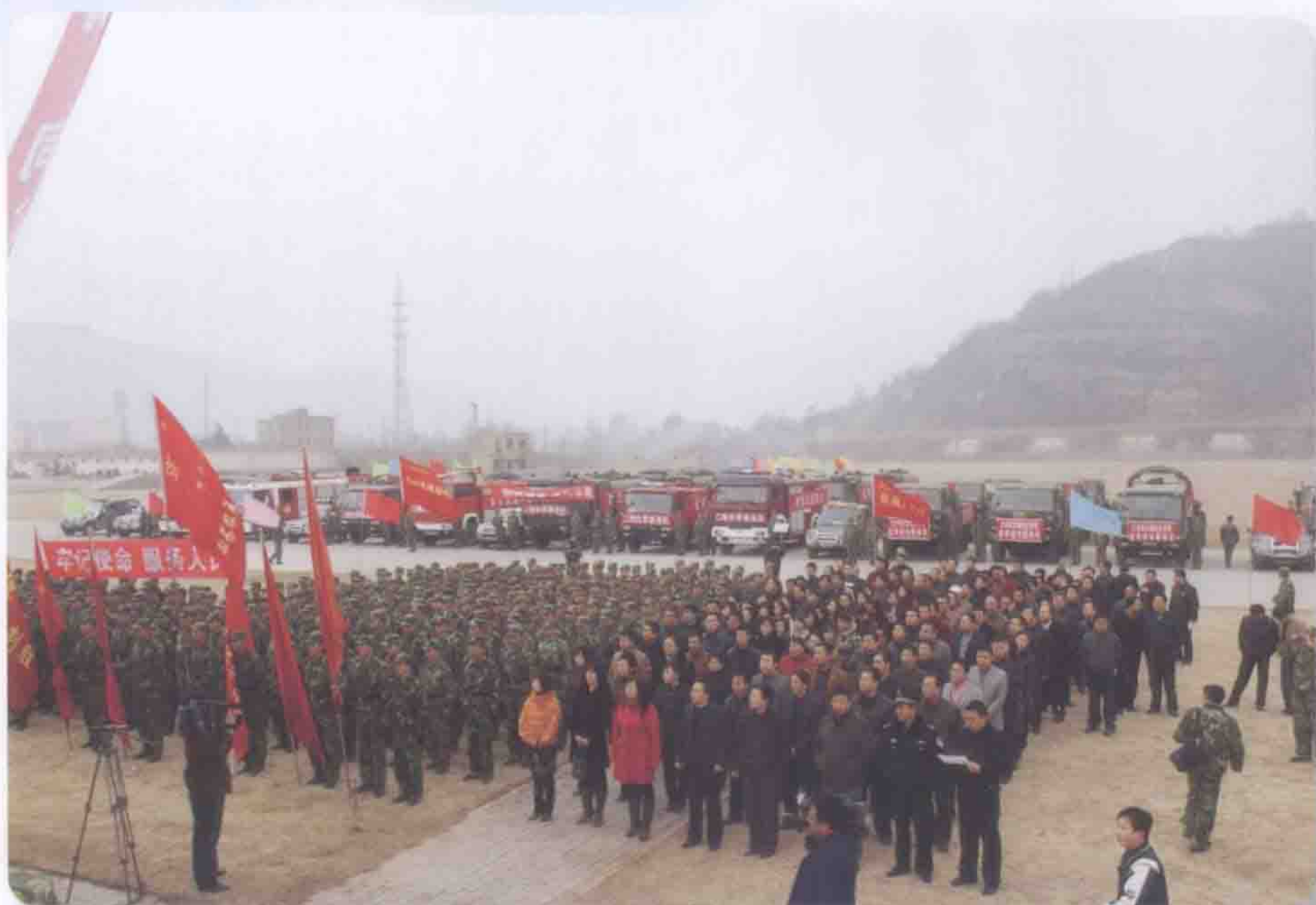
2009年2月18日天水市“钢铁红军师部队”抗旱送水