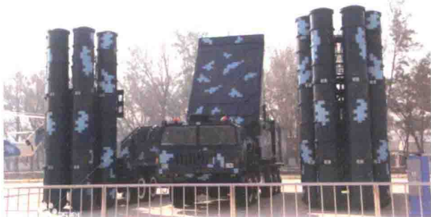
中国产红旗-9防空导弹系