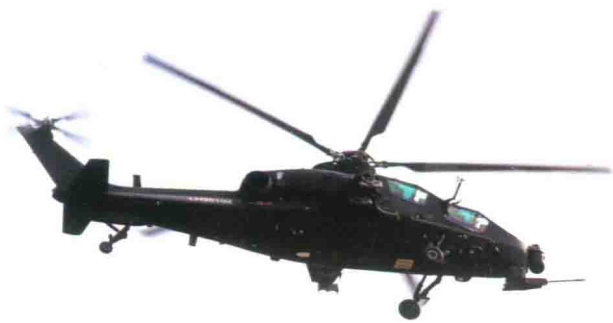
中国产WZ-10武装攻击直升机