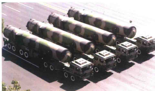
中国产“DF-31”洲际弹道导弹