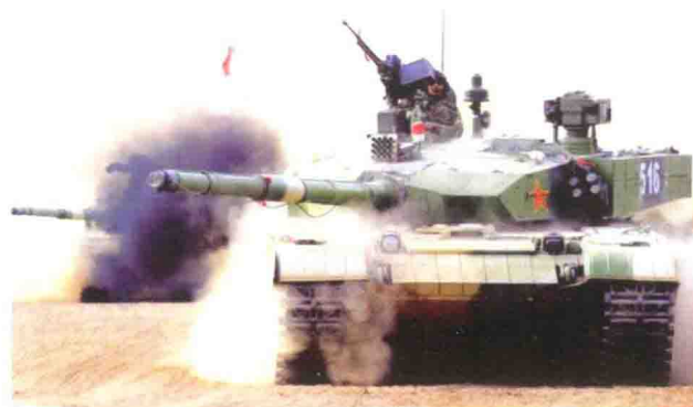
中国产“99型”主战坦克