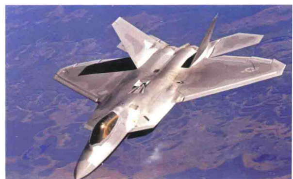
美国产F22“猛禽”隐身战斗机