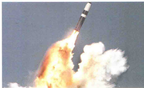
美国产“三叉戟”II潜射洲际弹道导弹