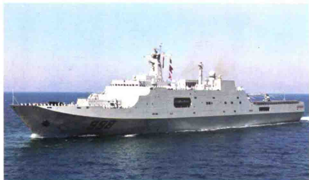
中国产“071型”两栖船坞登陆舰