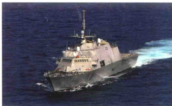
美国产“自由”号濒海战斗舰