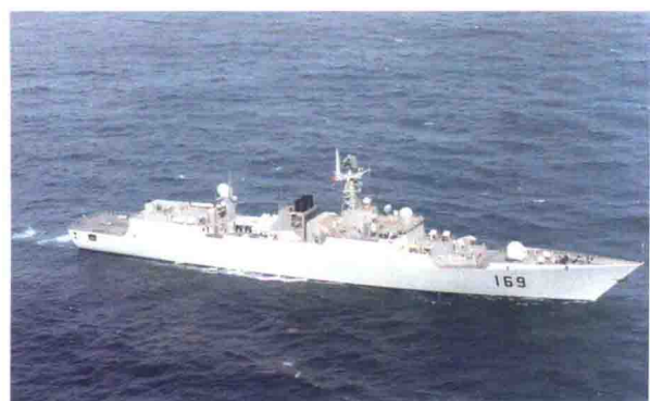
中国产052型导弹驱逐舰