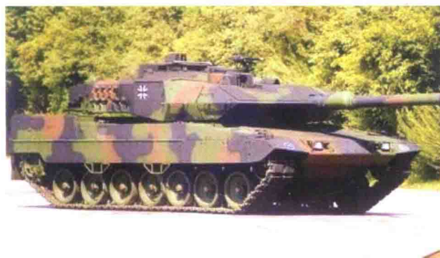
德国产“豹2”主战坦克