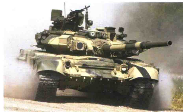
俄罗斯产“T-90”主战坦克