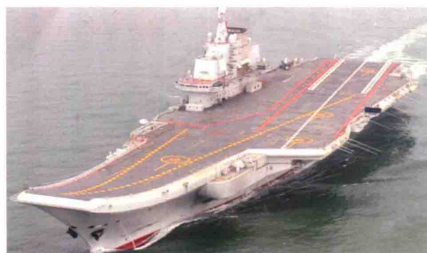
中国现役“辽宁”号常规航空母舰