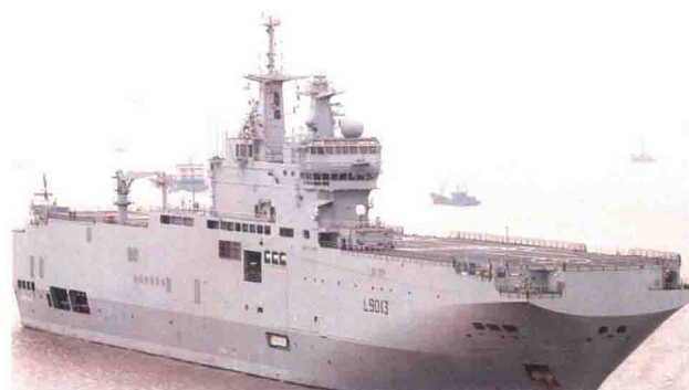
法国产西北风级两栖攻击舰