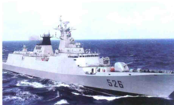
中国产054A型导弹护卫舰