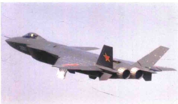
中国产“J-20”隐身战斗机