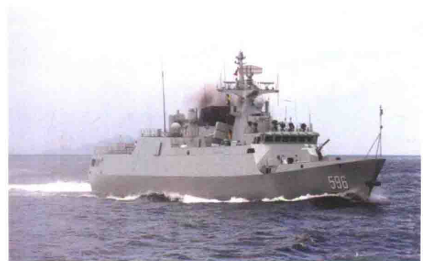
中国产056轻型护卫舰