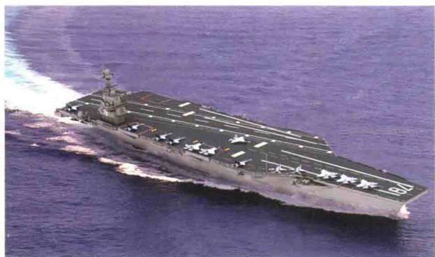
美国最新一代福特级核动力航空母舰