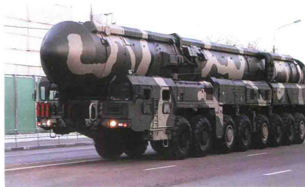
“白杨”-M 俄罗斯 射程：11000公里