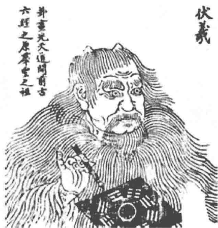
图 1-2 伏羲画像

巫文化是这一时期另一个重要特征,渗透到社会的各个领域。原始社会生产力水平低下,人们常常对大自然的风雨雷电的变幻莫测等自然现象感到敬畏、恐惧,形成各种各样图腾崇拜,如将蛇、鸟等某些动物,甚至植物作为氏族的标志或先神加以崇拜。巫就是一群可以与这些神进行交流的人,他们通过祭祀仪式和占卜、祈祷等巫术活动,向神表达人的愿望