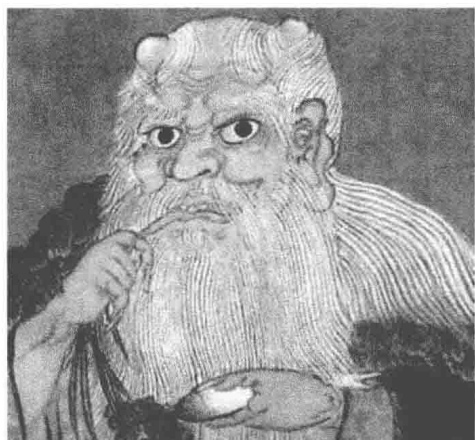
图 1-3 神农画像

图 1-3)”，这点在诸多古代文献中都有记载。如《淮南子·修务训》有“神农乃始教民，尝百草之滋味，当时一日而遇七十毒，由此医方兴焉”之说；《史记补·三皇本纪》也认为“神农氏以赭鞭鞭草木，始尝百草，始有医药”；宋代刘恕在《通外纪》中认为“民有疾病，未知药石，炎帝始味草木之滋，尝一日而遇七十毒，神而化之，遂作方书，以疗民疾，而医道立矣。”另一个传说“伏羲制九针”，认为中华民族的人文始祖伏羲氏发明了针刺治疗方法，说明针刺疗法在新石器时代就开始