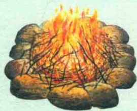
直立人学会使用火是巨大的技术进步。

火的出现也意味着他们能够在更为寒冷的气候条件下生存下来，这使得直立人比以前的人类走得更远。像能人，他们可能总是处于迁移的状态，搭建暂时的宿营地作为打猎和采集的基地。一些居住地可能是季节性的，在春夏季节，当水果、叶子和坚果丰富时，他们就居住下来。但是直立人走得更远，走出了他们的出生地非洲，定居在亚洲与欧洲。