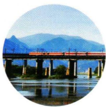
—— 北京周边最出片儿的线路 —— 丰沙线 /036