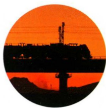
—— 北京周边山区线路 /068