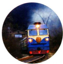
—— 启蒙之路 —— 京张铁路 /012