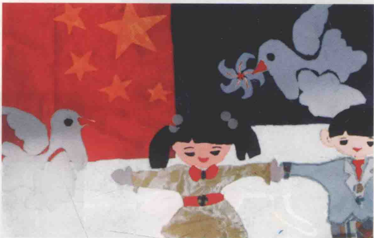
彩图1 《迎回归》 作者：孙红妹