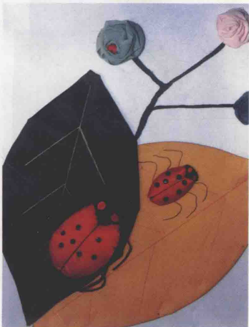
彩图3 《瓢虫》 作者：赵丽丽