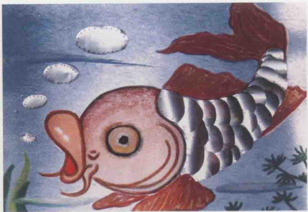
彩图 10 《大鲤鱼》 作者：王宁