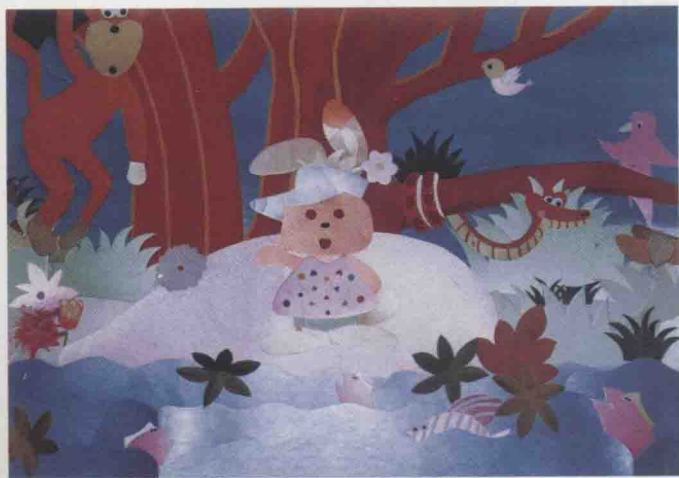
彩图 12 《动物乐园》 作者：杜晶、王艳哲