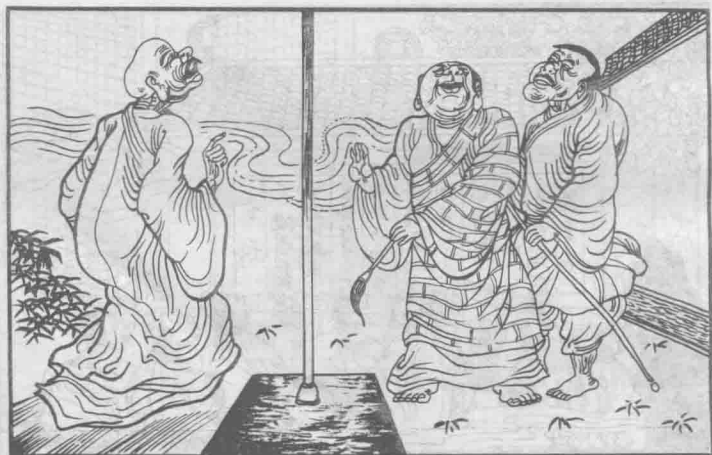
28 第二天又来了一个,叫米佉黎瞿奢罗,也歪着头在那里想法子。第三天又添了一个,叫阿夷头翅舍的,同样只看不动手。