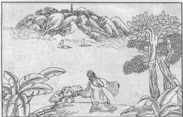
1 相传北部洲万寿山下有一老寺僧，名唤宾度罗，善使法术。