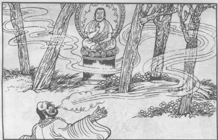
2 这天，宾度罗闲来无事，在寺内略施小计，把这寺庙都吹没了，光秃秃的，只剩下这佛祖塑像在林中端坐着，任凭风吹雨打。