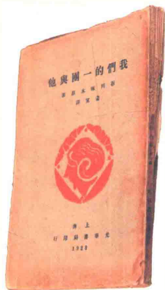
《我们的一团与他》，1928年