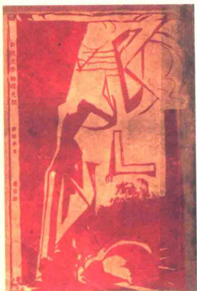
《新俄文学的曙光期》，1927年