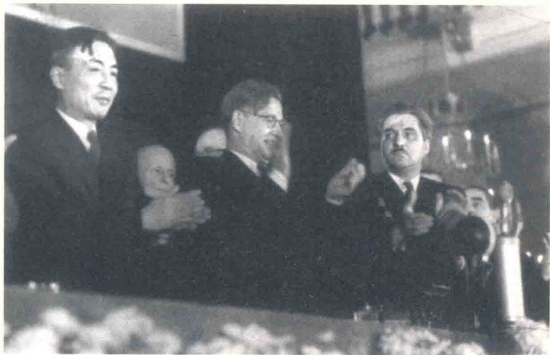
1951年11月冯雪峰（左一）、苏尔可夫（中）、西蒙诺夫（右）在世界作家保卫和平大会上