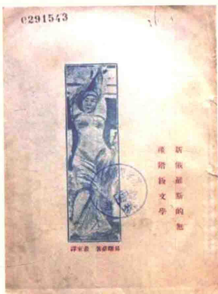
《新俄罗斯的无产阶级文学》，1927年