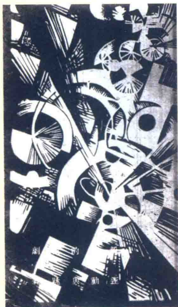
《新俄的演剧运动与跳舞》，1927年