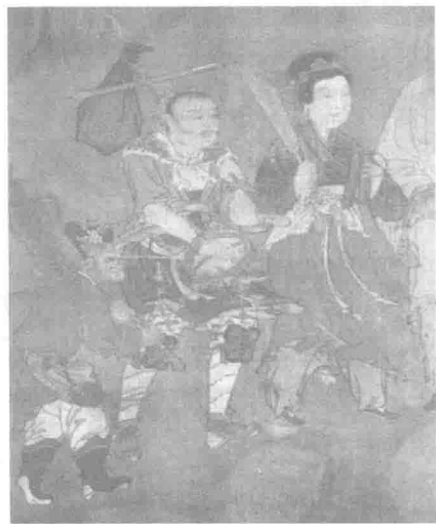
山西右玉宝宁寺水陆画元代戏班图