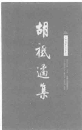
《胡祇通集》 吉林文史出版社 2008 年版