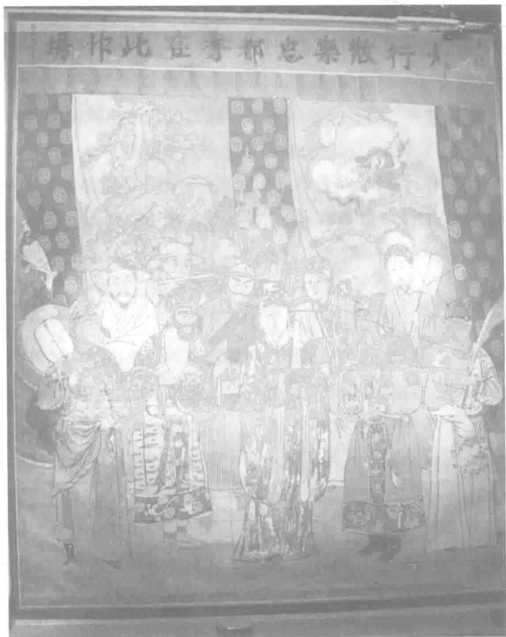
山西洪洞广胜寺明应王殿元代戏曲壁画