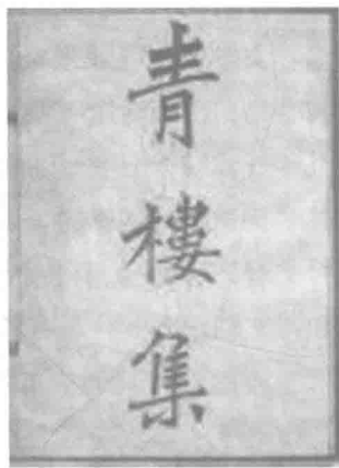
《青楼集》 宣统三年(1911)长沙叶氏校刻版

明人王骥德于《曲律·杂论第三十九上》中曾如此慨叹一夜间兴起的戏曲：“古之优人，第以谐谑滑稽供人主喜笑，未有并曲与白而歌舞登场如今之戏子者；又皆优人自造科套，非如今日习现成本子，俟主人拣择而日日此伎俩也。……至元而始有剧戏，如今之所搬演者。是此窍由天地开辟以来，不知越几百千万年，俟夷狄主中华，而于是诸词人一时林立，始称作者之圣。呜呼异哉！” ① 直至宋代，优人依然是为人主提供喜笑的一种工具；至元代，昔日无自由之工具应时而变，成为“并曲与白而歌舞登场”之戏子，尽管地位依然低下，然自我开始出现，职业开始固定；与此相应，“诸词人一时林立”，作曲者甚至以“振鬣长鸣，万马齐喑”的洒然风姿笑傲文坛，将坛主玉玺牢牢掌握，令后人既惊又羨，且叹且惑。为元杂剧的艺术魅力所吸引的不只是跃隔时空的明人，实际上，元代艺术研究者早已感受到了同时代艺术发展的脉搏，其眼光早已为元杂剧的千姿百态所吸引。胡祇通和夏庭芝就是其中较早的两个。