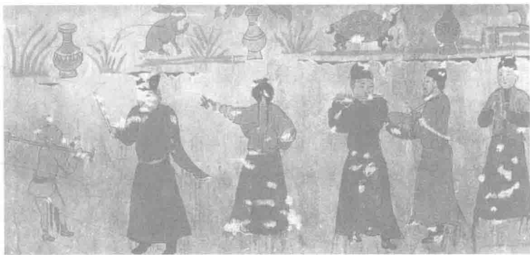
山西运城元墓杂剧壁画