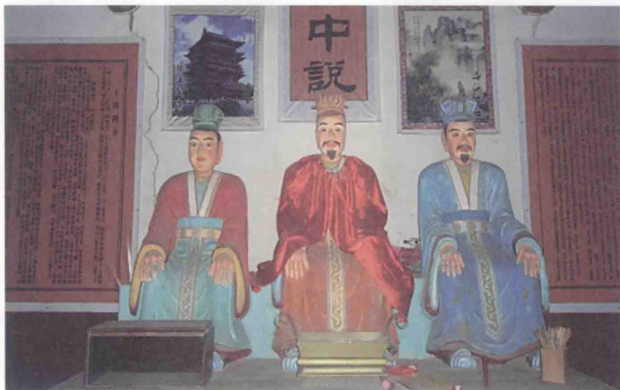
三王塑像（从左至右：王勃、王通、王绩）