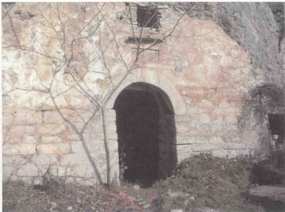
文中子讲学时居住的“飞云洞”