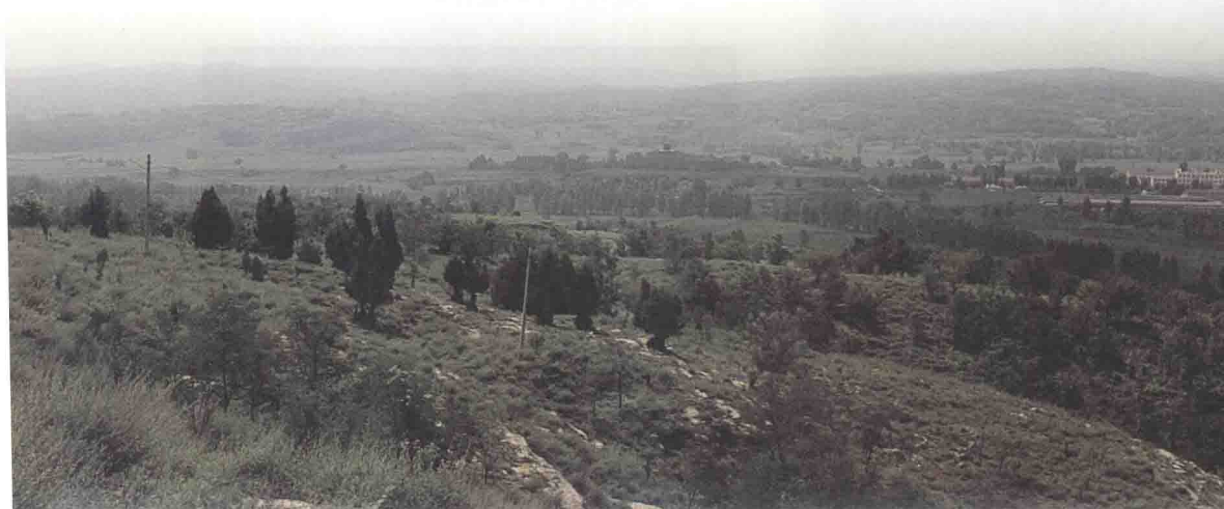
沁县故城镇，近处是铜鞮山，远处是龙门山和石梯山