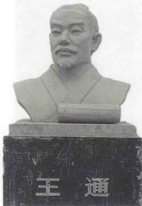
万荣县广场的王通塑像