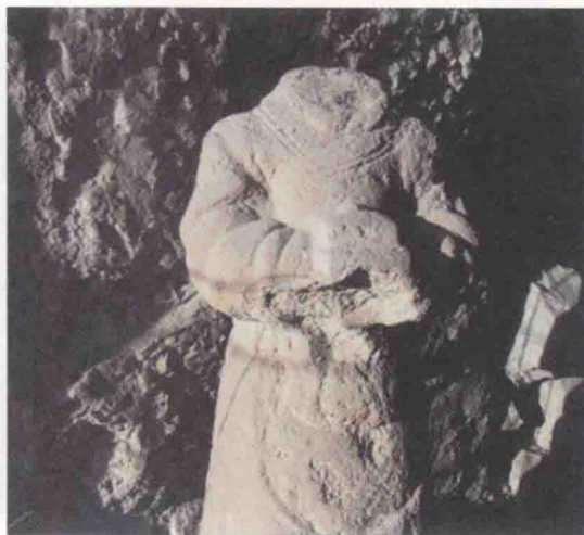
飞云洞中的塑像，疑似文中子像