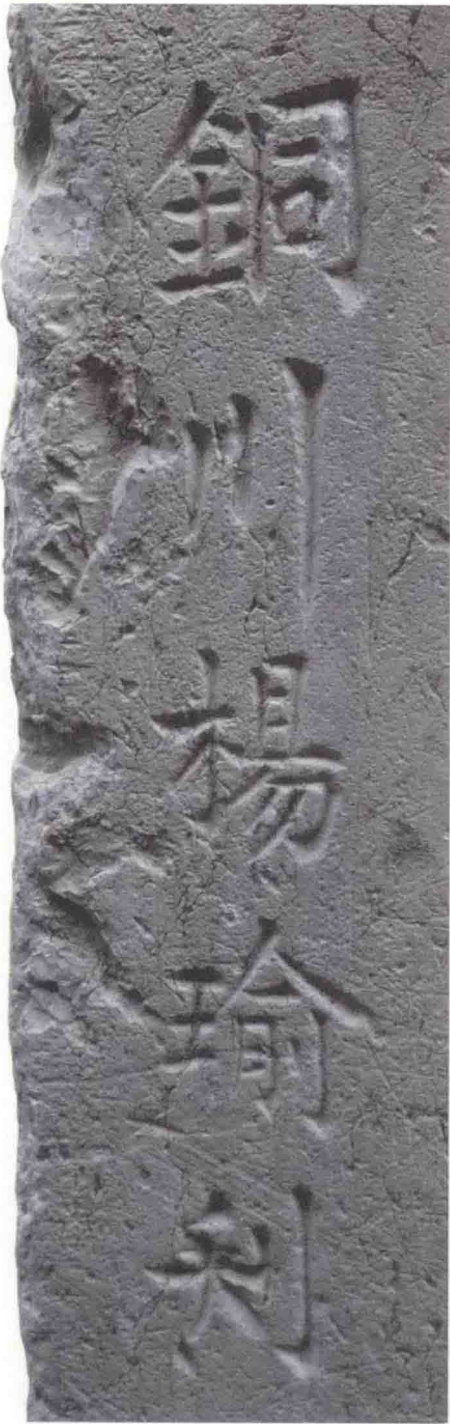
沁县郭村大云院中保存的金代残碑， 末署“铜川杨瑜刊”