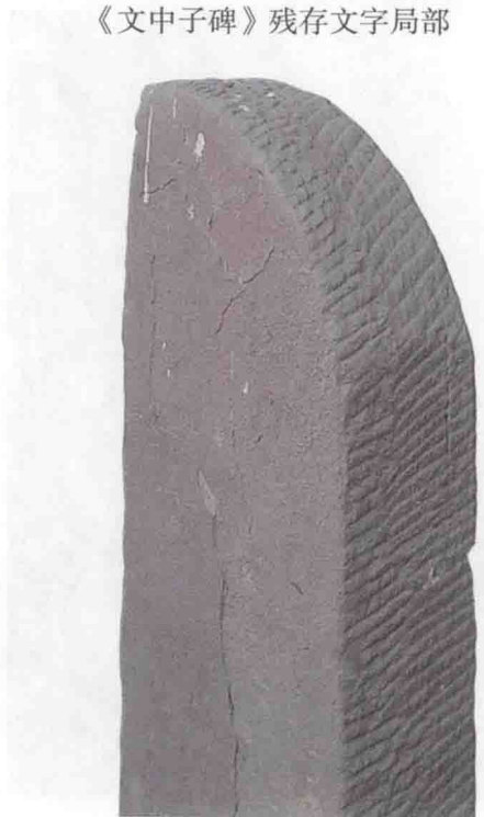
沁县大云院中现存的皮日休《文中子碑》 只存右上部四分之一