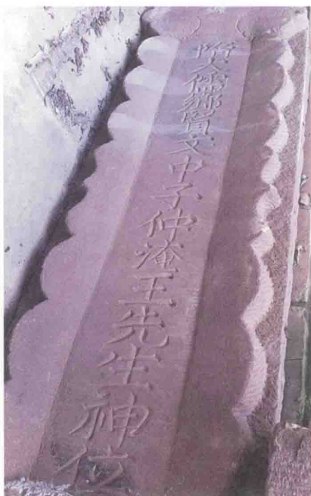
原文中子祠中的王通牌位