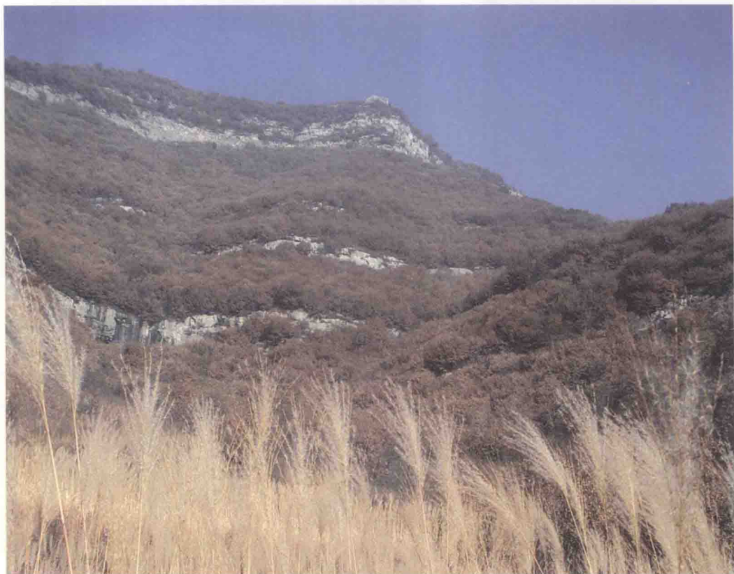
文中子讲学地——紫金山中的黄颡山