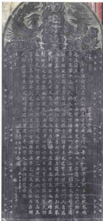
2000年8月当地百姓在疏属山巔重建汾亭时所立碑志

文武兼知君將門相門公 櫛干尋波濶萬頃寔惟那 調清潤稟自生知性好陸 彼藏牛有莊周之感觀茲 經隨季絲增效曠更重棲 操有志林泉樂道忘憂禮 居闕川長逝桑榆未迫辰