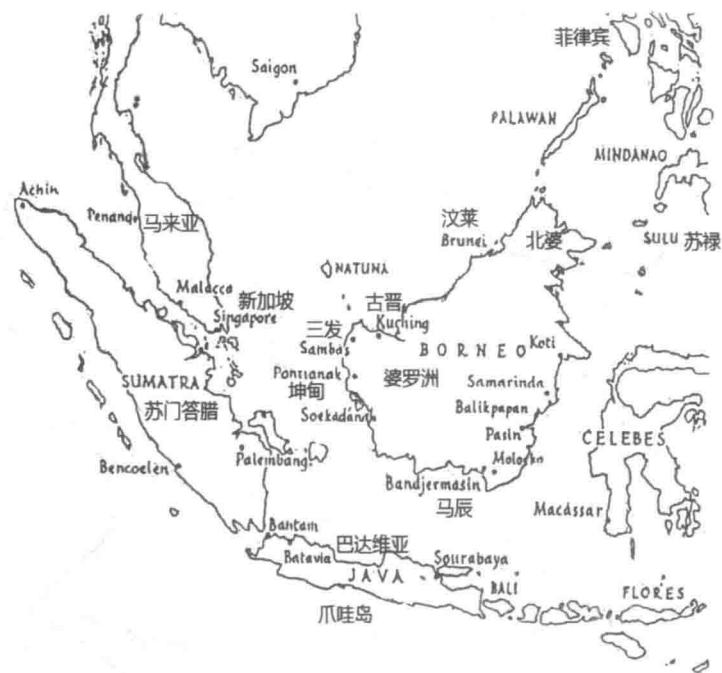
19 世纪婆罗洲岛位置图