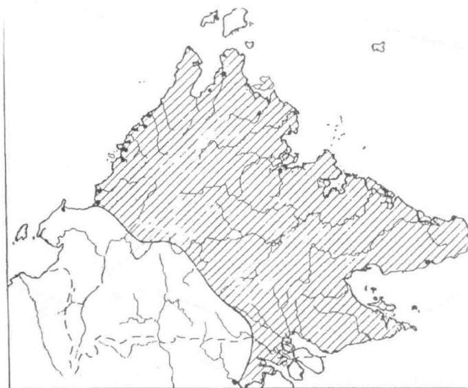
1704 年汶莱苏丹割让给苏禄苏丹的领土

苏丹睦希丁所割让的领土包括整个婆罗洲岛北部，从东部的史巴迪岛到西岸的京马尼士河，这片领土几相等于 1865 年汶莱苏丹割让给美国商人托里的领土之面积，其中包括山打根、京那巴丹干河、巴拉望岛、万宜岛及巴拉巴岛。不过，随后即位的汶莱苏丹，不承议这项领土的割让，而苏禄苏丹则坚持该领土主权。此亦是现今菲律宾索取沙巴领土之根由。