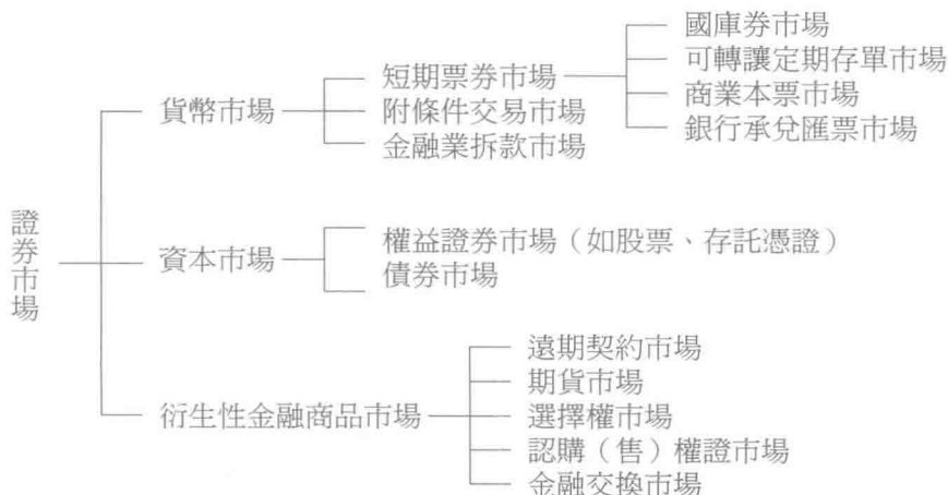
圖1-2 證券市場的結構

經濟體中同時存在著資金需求者（如政府或企業）及資金供給者（如社會大眾），為了促進資金的運用效率及降低交易成本，便形成了所謂的證券市場。證券市場提供了各種金融工具交易的場所，包括貨幣市場、資本市場及衍生性金融商品市場等，其結構如圖1-2所示。其中貨幣市場是由到期期間在1年以內的金融工具所組成的市場。資本市場則是由到期期間在1年以上的金融工具所組成的市場。