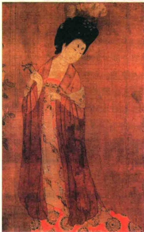
唐代周昉 簪花仕女图(局部)

有一种形象说法，就是服饰时尚是女人的专属玩物。无论是神秘古老的文化，还是新潮前卫的科技，统统都可以融进服饰之中，成为女人最得意的专属玩物，这就是说女人是服饰时尚的最大玩家，如果离开了这个大玩家，服饰时尚自然也会黯然失色，唐代女性就是这样的服饰时尚大玩家，因为追求时尚不仅是今天女子的专利，在唐代已得到充分体现。当我们放宽历史的视野，回眸一千三百多年前的世界，那时的全球化的时尚中心就是大唐长安，作为时尚中心、