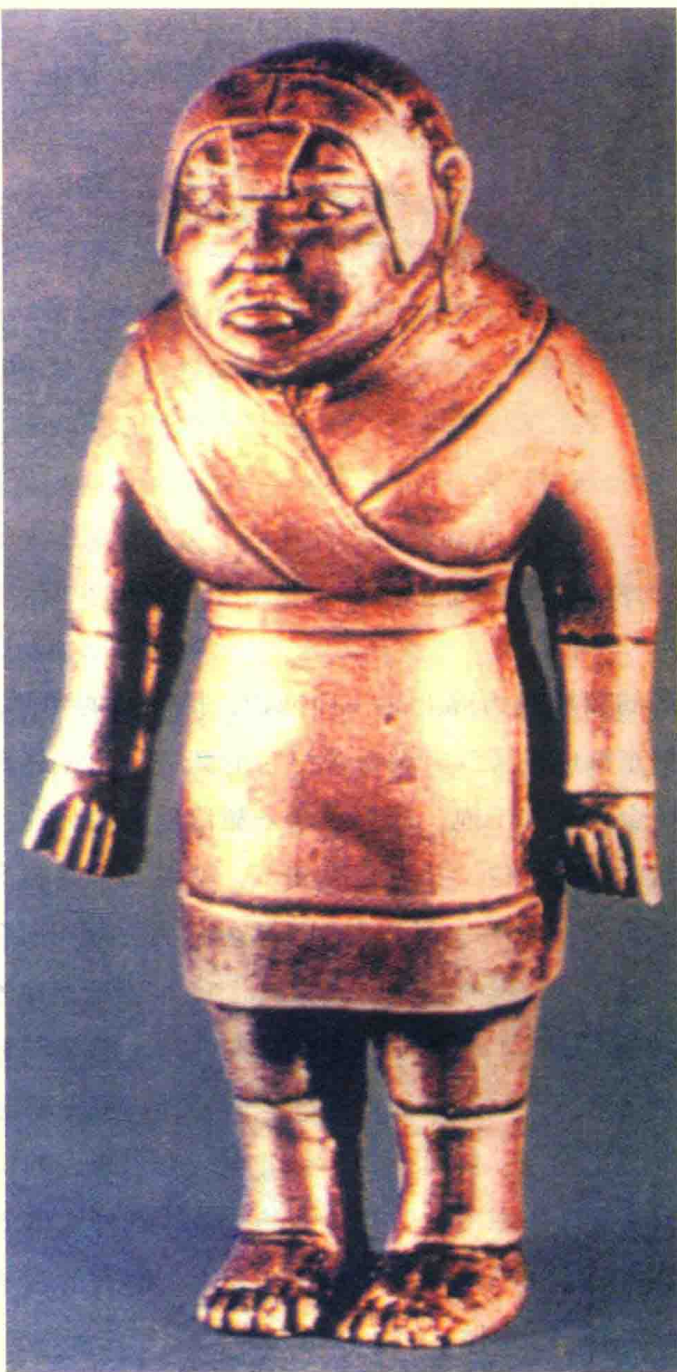
河南洛阳金村出土战国胡人武士像

赵武灵王“易胡服”为中原的生活方式带来了新的因素。赵武灵王是中国服饰史上最早一位改革者，最先采用胡服，这种服装最初用于军中，但上行下效，赵国百姓纷纷效仿，貉服、胡服之冠、爪牙帽子、带钩等胡人风格的服饰开始在赵国百姓中流行，成为一种普遍的时尚服饰。正如华梅所言：“由军服而民服，胡服的引进使中国汉族服饰文化增添了新气象。这次民族服饰融合，奠定了中华民族服饰由交流而互进的良好基础。”