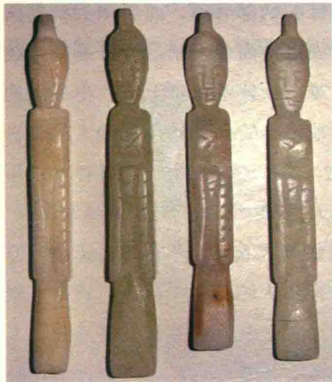
春秋战国玉俑戴幘，幘是用来包住头发的头巾

君主的喜好往往带动了一拨又一拨时尚潮流的兴起，一旦在上者兴趣转移了，在下者随着趋于新花样。汉代长安民谣：“城中好高髻，四方高一尺；城中好大眉，四方高半额；城中好广袖，四方全匹帛。”这首长安民谣原载《后汉书·马廖传》，说明“上行下效”的意义。足见时尚的流传，从宫中到宫外，从首都到地方，从城市到乡村，从社会上层到社会下层，而且是“上有所好，下必甚焉”，这就是说处于上层和高位的人喜欢什么，或有什么爱好，下层社会的人就一定会对什么喜欢，就会爱好得更厉害、更强烈、更极端。就这样愈传得广，比原样愈厉害。时尚从更新流行到普泛化，再到被大众化消解，这个过程愈短，表明这个社会的发展速度愈快。