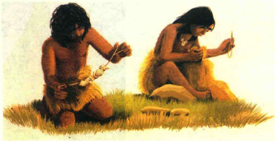
原始人缝制衣服想象图

服饰的发明是一次革命。在古代文明尚未建立起来的蒙昧时代，西方与中国的服饰都是以满足人的生理需要为目的的。最初的原始先民茹毛饮血，没有制衣的能力，也没有穿衣服的概念，他们都是赤身裸体地过日子，围捕野兽与打鱼捞虾。某个炎热的夏天，某个女性先民拣取树叶串在一起披在身上遮掩阳光，以避免皮肤受到烈日晒伤，同时她的羞耻感使她用树叶衣遮住了她的敏感部位，她的这一新颖举动引起周围人的注目，人们好奇地围着她欣赏她的这件树叶衣，渐渐地，纷纷效仿，都穿起树叶衣。人类祖先从穿树叶衣的那一天开始，就有了衣服。某个寒冷的冬天，某个冷得直打哆嗦的男性先民看到树上挂着一块晒干的兽皮，他取下兽皮披在身上用来遮体御寒，当他身披兽皮衣向人群走来时，立即引起人们的震动，他的这件兽皮衣也引起了人们的竞相效仿，于是，穿兽皮衣成为流行时尚。伏羲是传说中人类文明的始祖，被尊为“三皇”之首，神农氏也是一个对中华民族颇多贡献的传奇人物，当年他们就是身着兽皮衣、肩披树叶穿行在茫茫大森林之中。显而易见，这个女性先民和这个男性先民发明的树叶衣和兽皮衣就是人类最早的时尚服饰，开启了人类服饰时尚的先河，