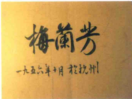
1956年10月26日晚，梅兰芳在后台的签名

我演牡丹亭 梅兰芳 ——纪念汤祖先生 再 希 望 我演牡丹亭 梅兰芳 纪念汤祖先生 再 希 望