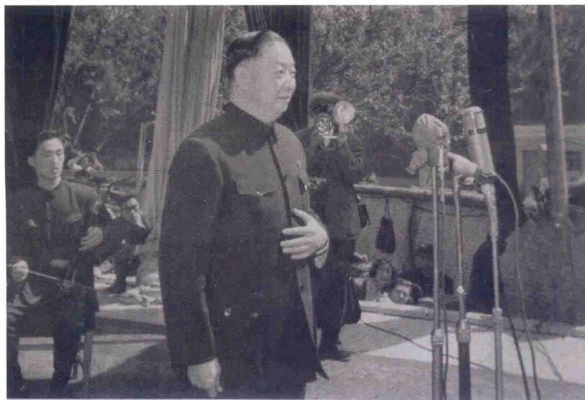
1960年五一节在中山公园为群众清唱