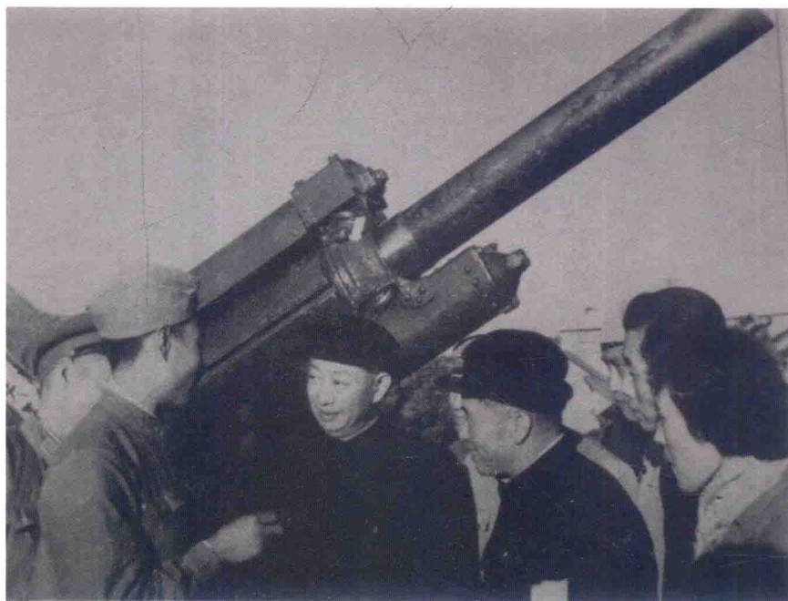
梅兰芳在福建前线炮兵阵地参观，与战士们亲切交谈