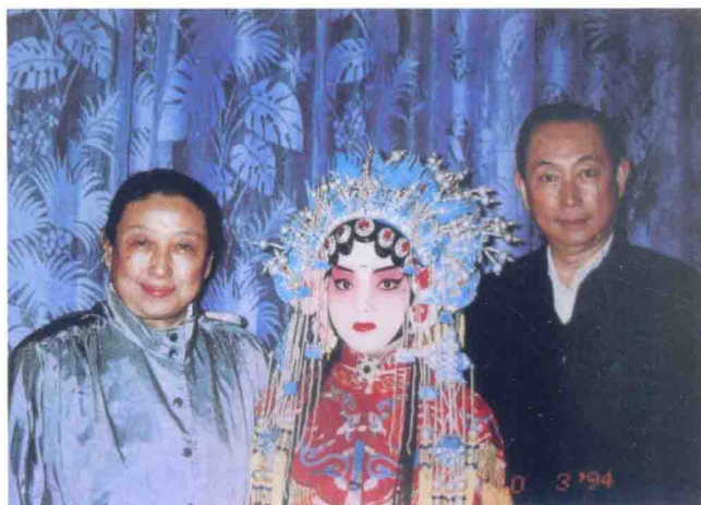
梅葆玥、梅葆玖和梅玮