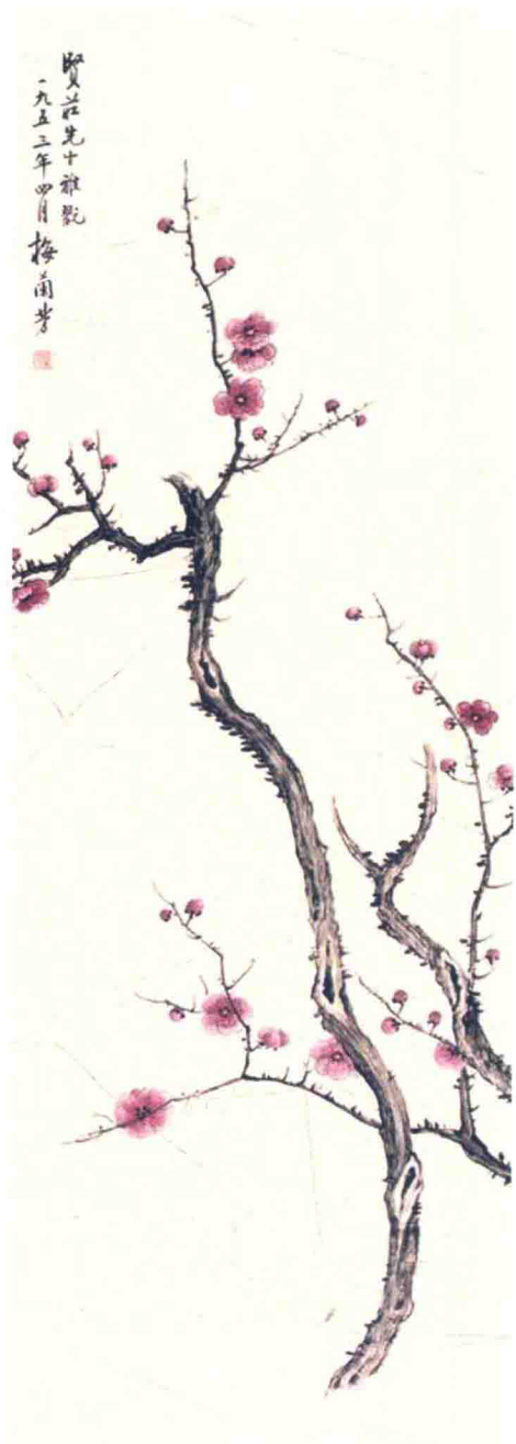
梅兰芳与杨小楼在浙江演出的海报