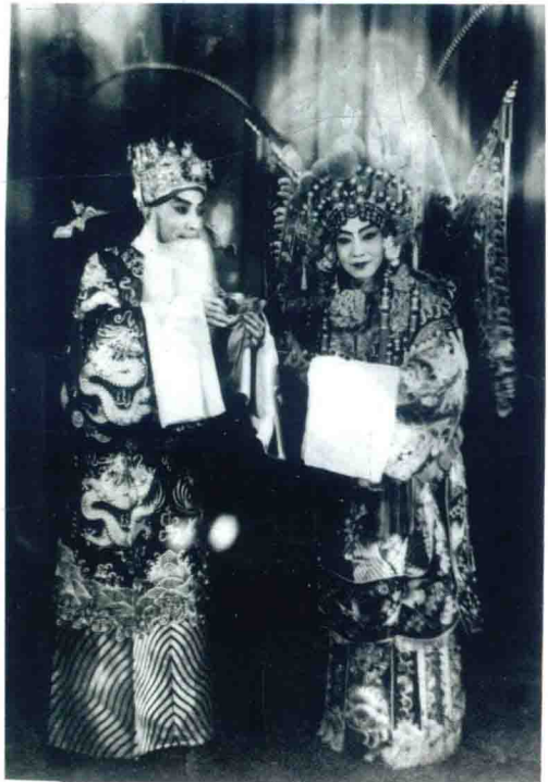
《北京晚报》1960年1月2日第2版刊载《元旦书红二首》