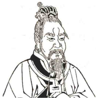
④ 颛顼：中国上古部落联盟首领，为五帝之一

颛顼生性沉稳，深谋远虑，通达而知事理。作为黄帝的孙子，颛顼非常注重治理天下。颛顼充分开发利用土地，种植各种庄稼，顺应自然，制定礼仪，教化民众。为了让天下太平，颛顼敬仰鬼神，经常虔诚地进行祭祀活动。在颛顼的统治之下，疆域得到了进一步的拓展：北至幽陵（幽州），南到交阯（泛指岭南及越南北部地区），西达流沙（在今甘肃张掖），东抵蟠木（传说在东海山上）。因此，凡