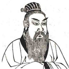
帝喾：上古时期“三皇五帝”之一，华夏民族的人文始祖

帝喾娶陈锋氏的女子，生下放勋；娶嫫（jū zī）氏的女儿，生下挚。帝喾死后，挚接替帝位。帝挚登基后，没有干出什么政绩。于是弟弟放勋即位，这就是帝尧。