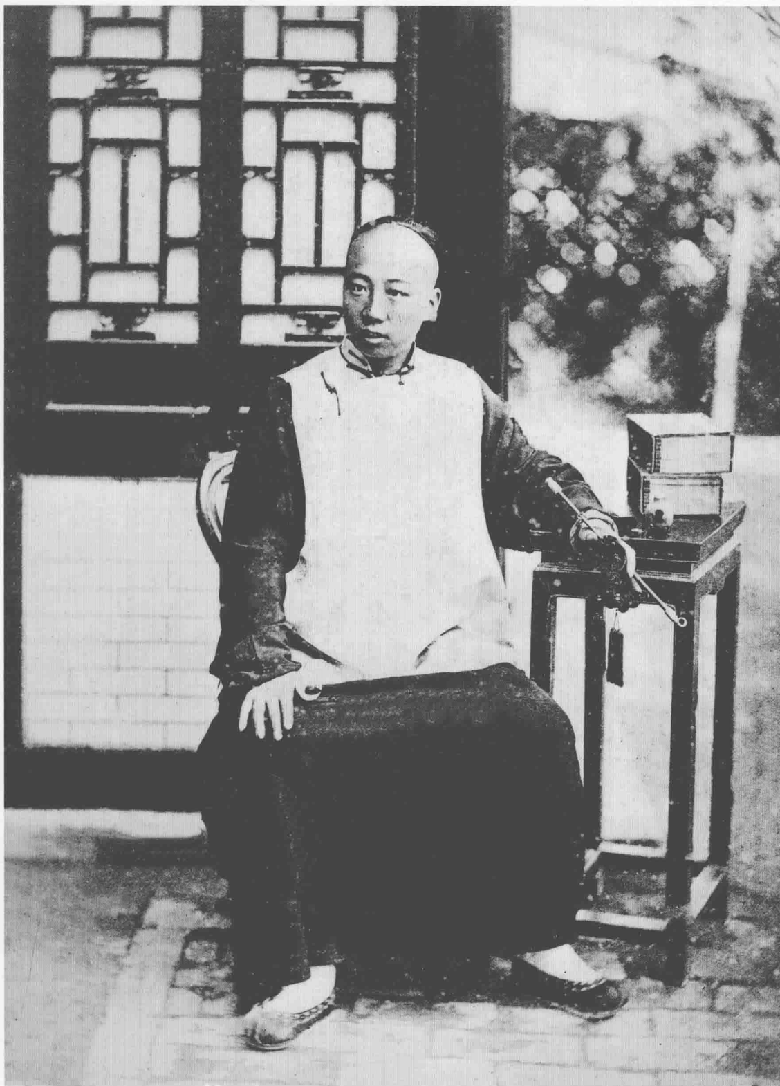
阿拉善亲王的儿子，拍摄于亲王的府邸中 > The son of the Prince of Alashan in the Prince Mansion