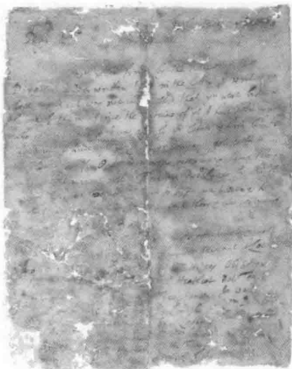
· 洛克手稿 1685 ·

洛克原本没有将他的教育信件付诸出版的计划。但洛克的随从及读过信件者(包括克拉克本人)都一致要求洛克将书信整理出版,以让更多的人从中受益。洛克最终接受了朋友们的意见,将有关书信整理后,于1693年正式出版,并谦虚地命名为《关于教育的若干思考》( Some Thoughts Concerning Education ,中译本定名为《绅士的家庭教育》)。这就是本书的由来。在本书的附录《洛克致爱德华·克拉克先生的一封信》中,将有关过程说得非常清楚,读者可参阅。本书在洛克生前,曾作过5次修改。