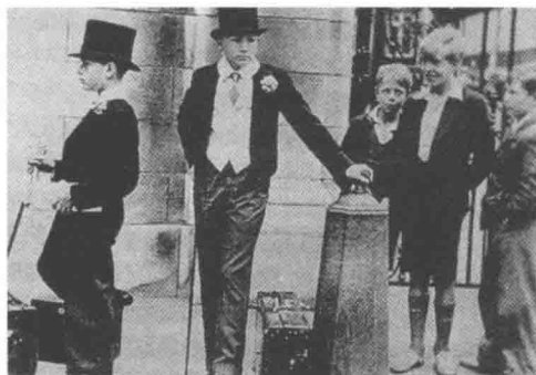
· 英国的年轻绅士 ·