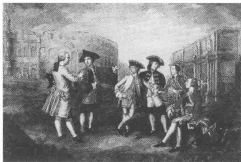
· 绅士子弟到国外旅行 ·