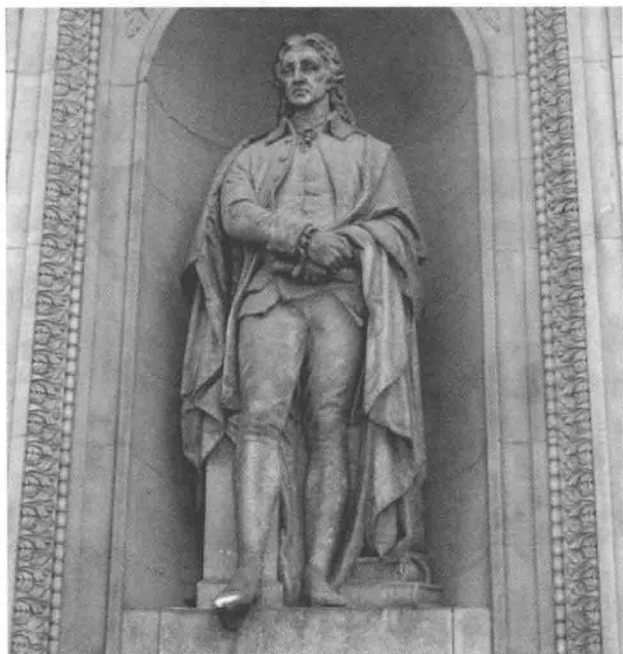
· 英国皇家学会洛克石像 ·

在教育实践上，洛克也有过长期耕耘的记录。1666年，洛克结识了英国自由主义政治家沙夫茨伯里伯爵（First Earl Shaftesbury，