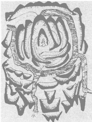
理想风水的景观模式

可以说,风水学说源于人类早期的择地定居。早自旧石器、新石器时代之交,采集狩猎的攫取经济被农耕畜牧的生产经济替代之际,相对稳定的定居生活开始需要注意对居