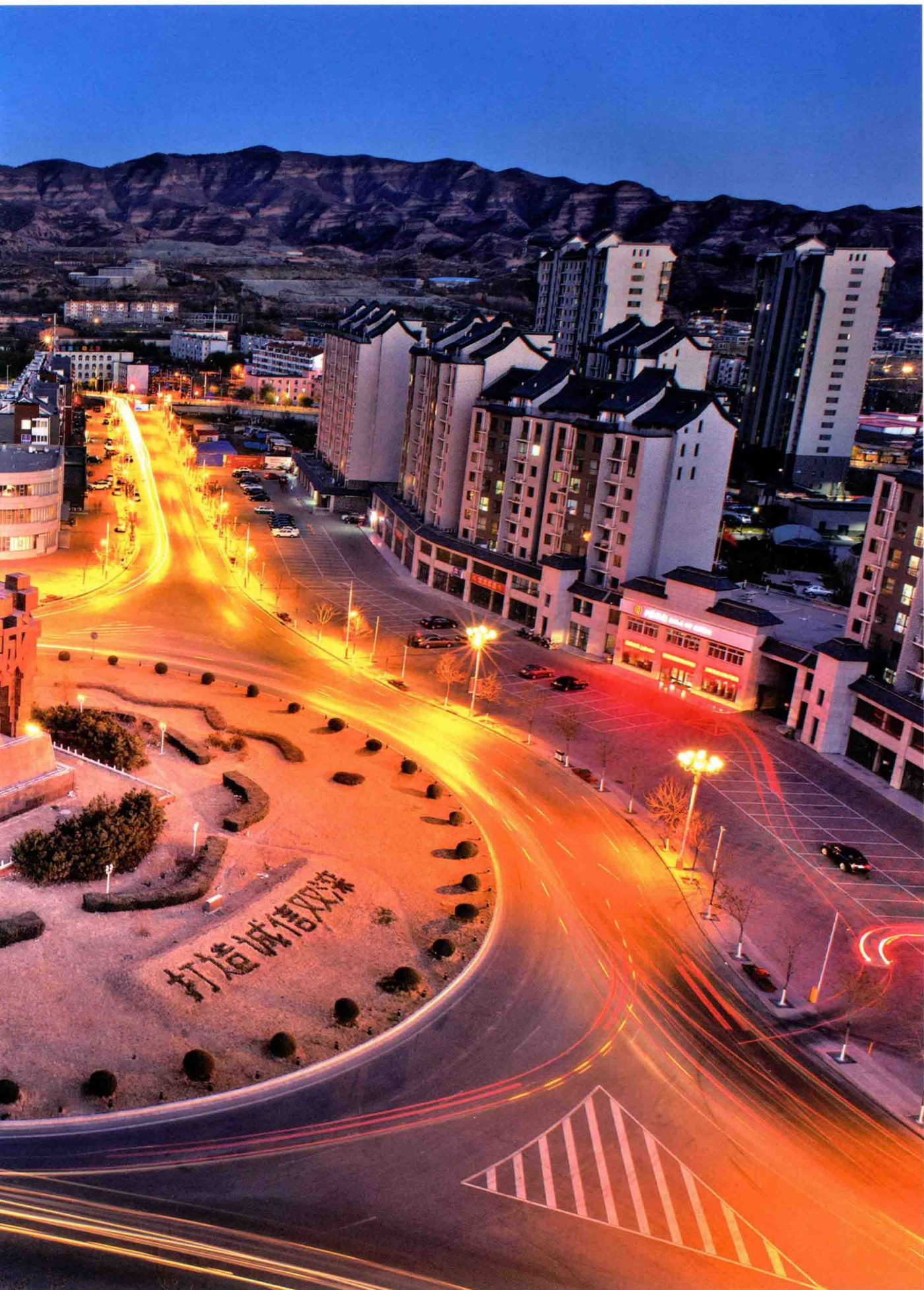
诚信双滦