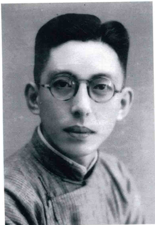
青年时代的干祖望 (摄于 1932 年)