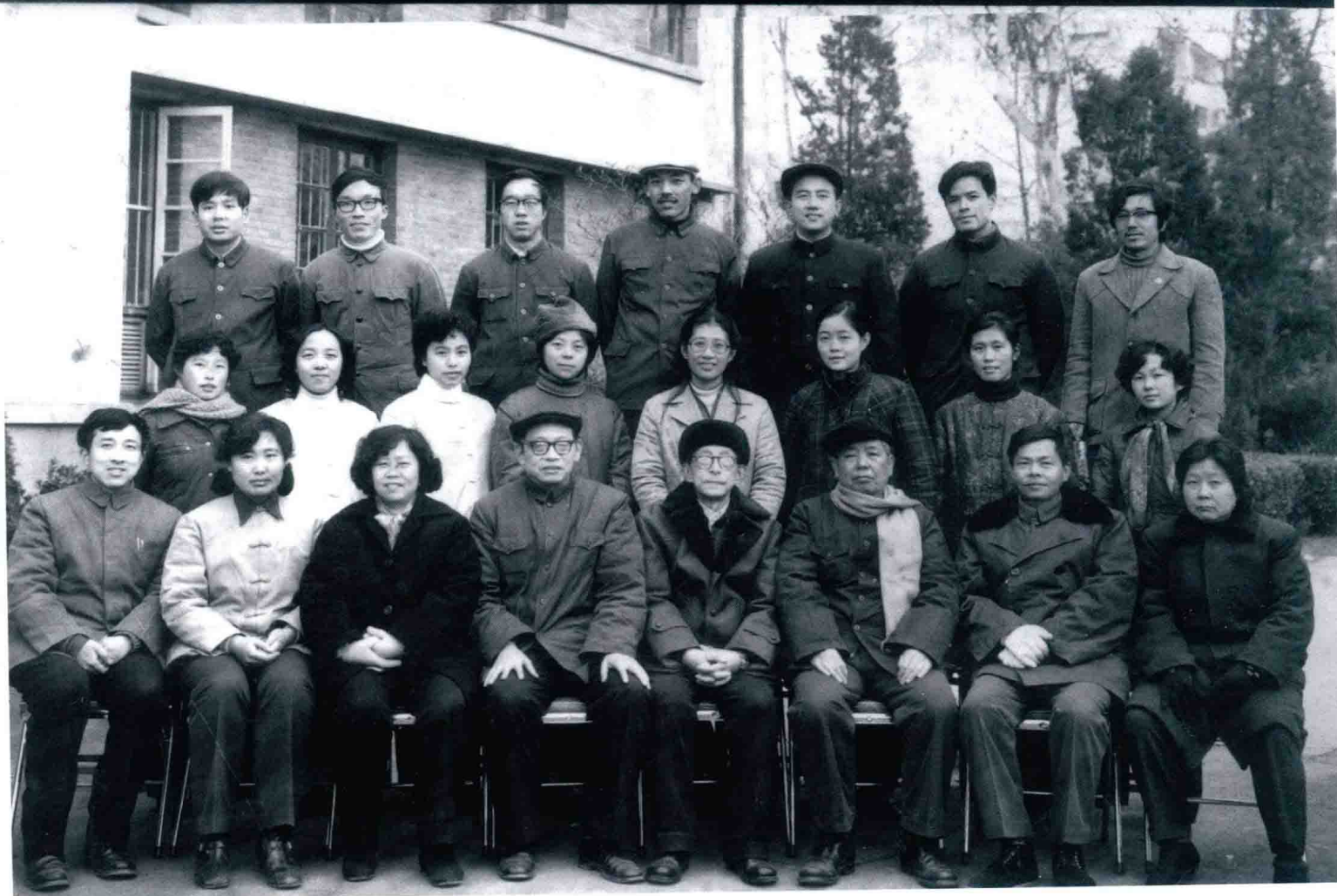
1985 年第三届全国中医耳鼻喉 科进修班结业留影