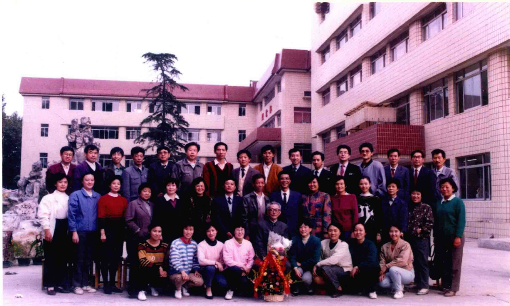
1992年干祖望教授80华诞庆贺会时与学生们合影