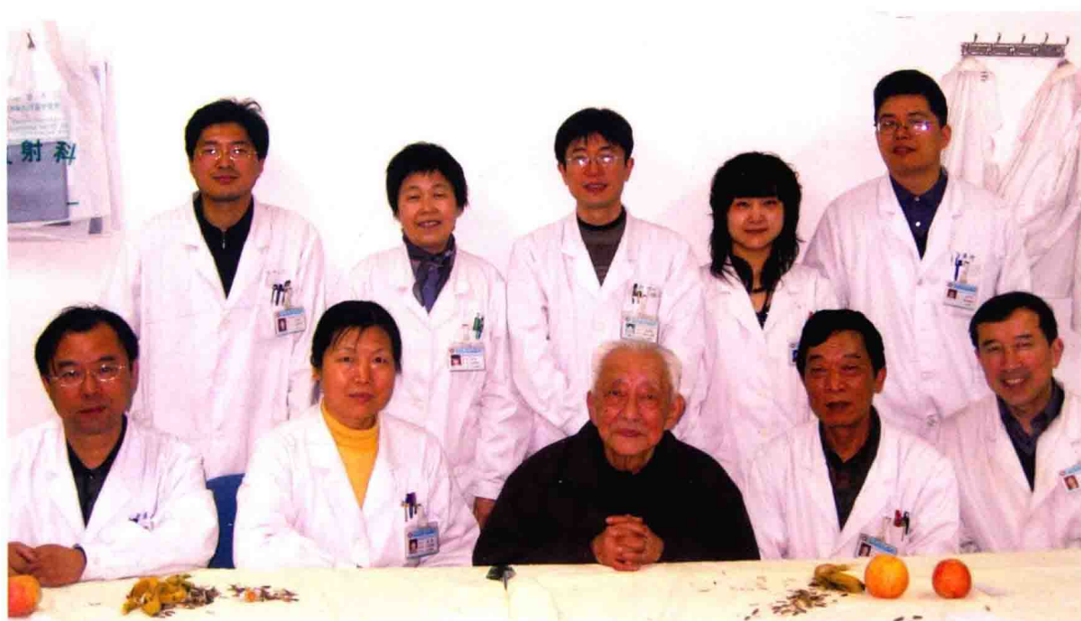
干祖望教授和他的团队成员