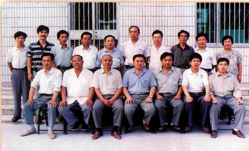
临邑县邮电局邮电志编纂委员会全体成员