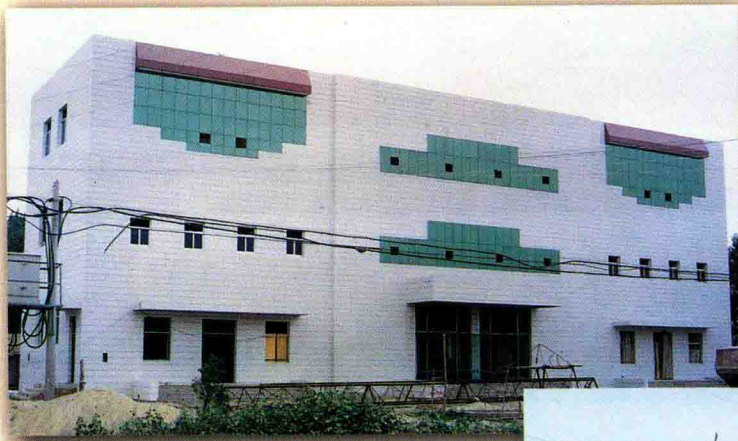
夏口邮电支局外景