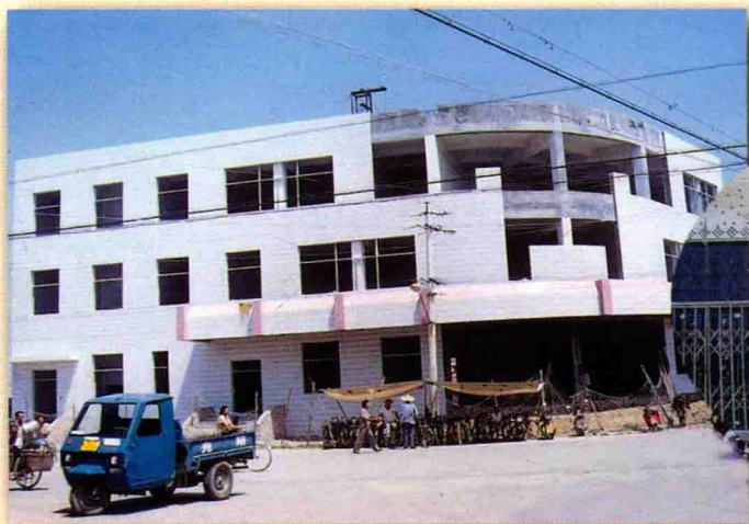
建设中的德平邮电支局