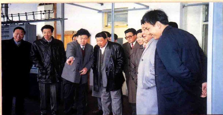
临邑县委、县政府领导视察 邮电局节日生产情况