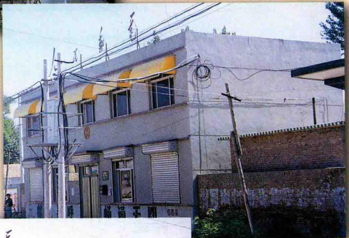
理合邮电支局外景