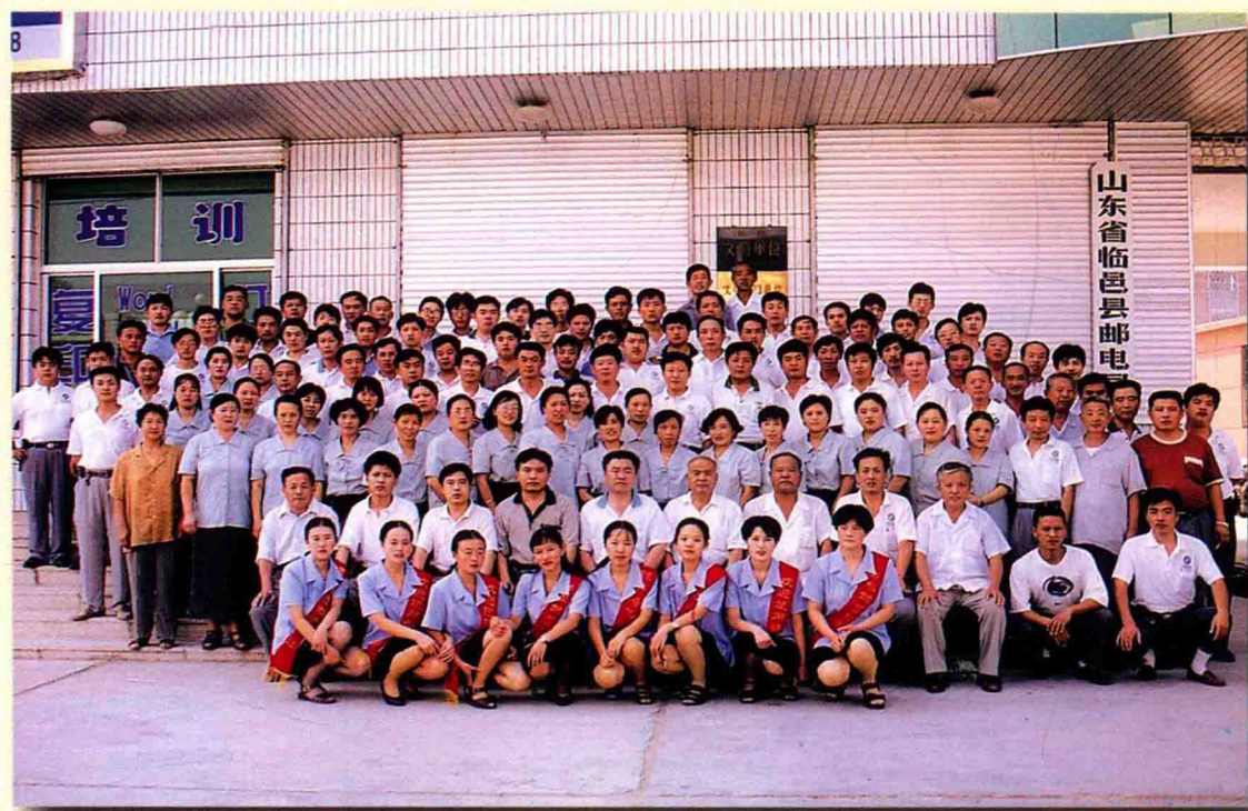
1998年9月11日全局职工合影