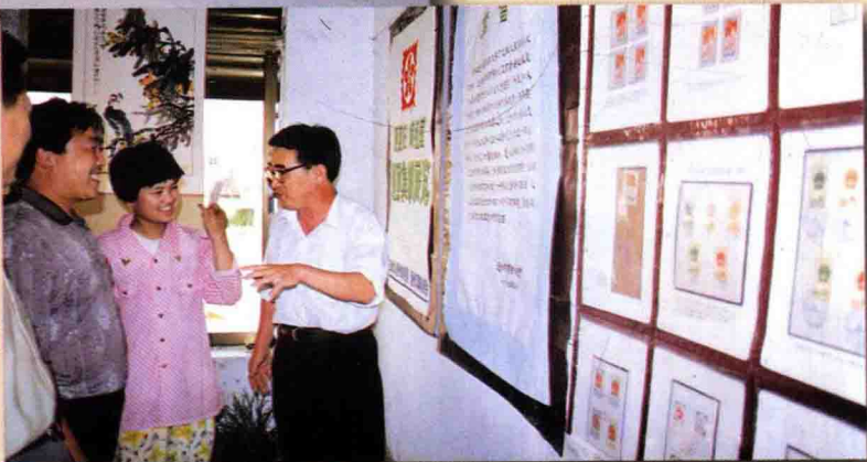
1997年6月7日全市集邮展览 在临邑开幕