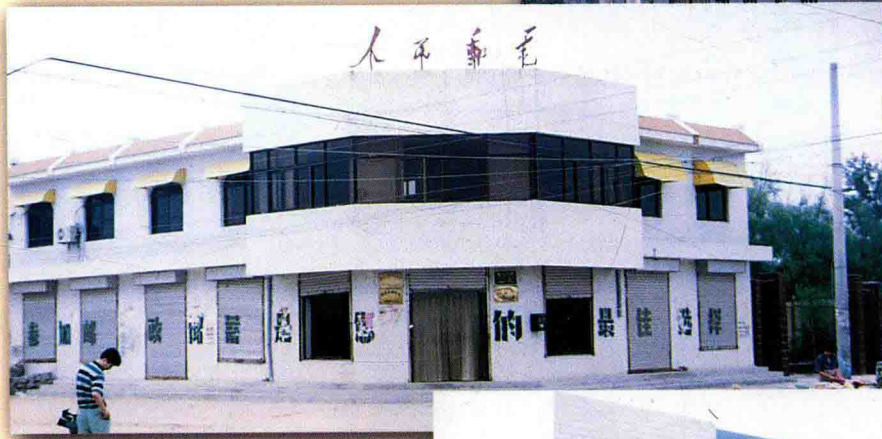
兴隆邮电支局外景