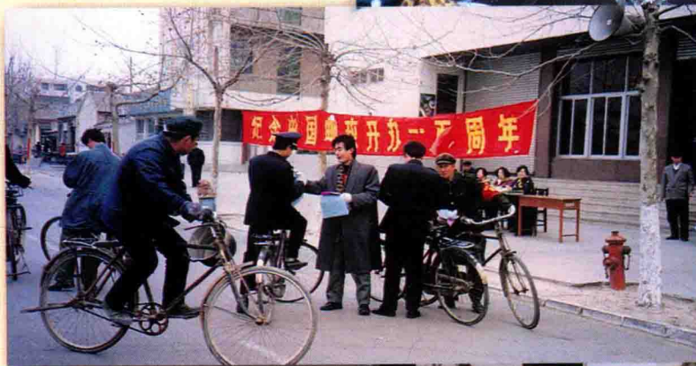
利用一切节日进行邮电业务宣传