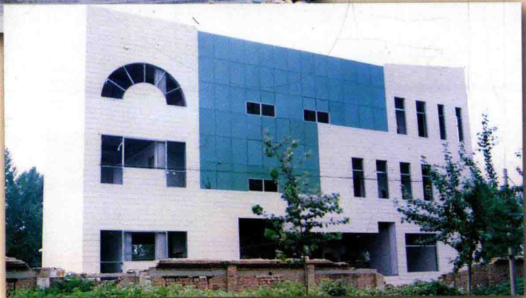
营子邮电支局外景