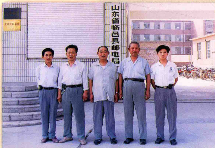
临邑县邮电局邮电志编纂人员