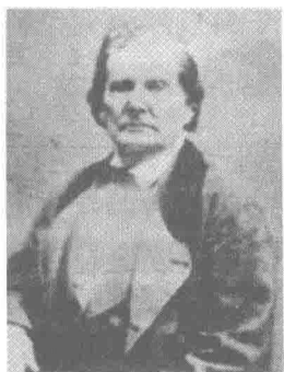
林肯的父亲托马斯·林肯。

因为人们爱听他讲故事。每一次，男孩都非常认真地跟大家一起听，他对这些故事太熟悉了，以至于他能够察觉父亲对故事情节的细微变动。然而，让男孩迷惑不解的是：父亲看到黑人时，总要拦住他们，让他们出示一种许可证，以证明他们有权在这里居住和工作。男孩问父亲为什么要这样，父亲回答说：“你这小子！说了你也不懂！”