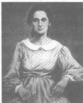
林肯母亲南茜的肖像画。

孩子们是不可以在马路上玩很长时间的，玩耍中妈妈常会喊他们回去，让他们到菜地里锄草，或是采些草莓和蘑菇什么的。妈妈会把这些东西晾干，以备冬天食用。男孩六七岁时，父亲就带他下地干活了，他再也不能一天到晚总是玩了，而必须认真地挽起袖子帮父亲播种。播种可是个辛苦活儿，必须一行播得深些，一行播得浅些。男孩很要强，他一定要把活干得更好，因为他愿意而且也有能力做到这一点。他在地里干活儿的时候，萨拉则呆在家里，帮妈妈给奶牛挤奶，晚上再和妈妈一道纺线。到了星期天，他们全家都坐到屋前面，妈妈会用她婉转的歌喉给他们小声哼唱古老的歌谣，有时候还会讲一些《圣经》里的故事，她有着未受过教育的聪明人所特有的那种超凡的记忆力。在男孩的脑海里，《圣经》上的诗句总是和妈妈那温柔的声音联系在一起。这时候，爸爸总是坐在一边，抽他的烟。此情此景，男孩常常有意识地比较爸爸和妈妈。他不得不承认，自己更喜欢妈妈，虽然她实际年龄并不比爸爸小，但在孩子们心目中，妈妈更年轻，也更温柔。当男孩暗自审视的目光注视着妈妈时，总会被她那黯淡的略带黄色的皮肤、那轮廓分明的面容、那粗大的骨骼和那灰暗的眼睛里发散出来的奇怪又略显忧伤的目光深深