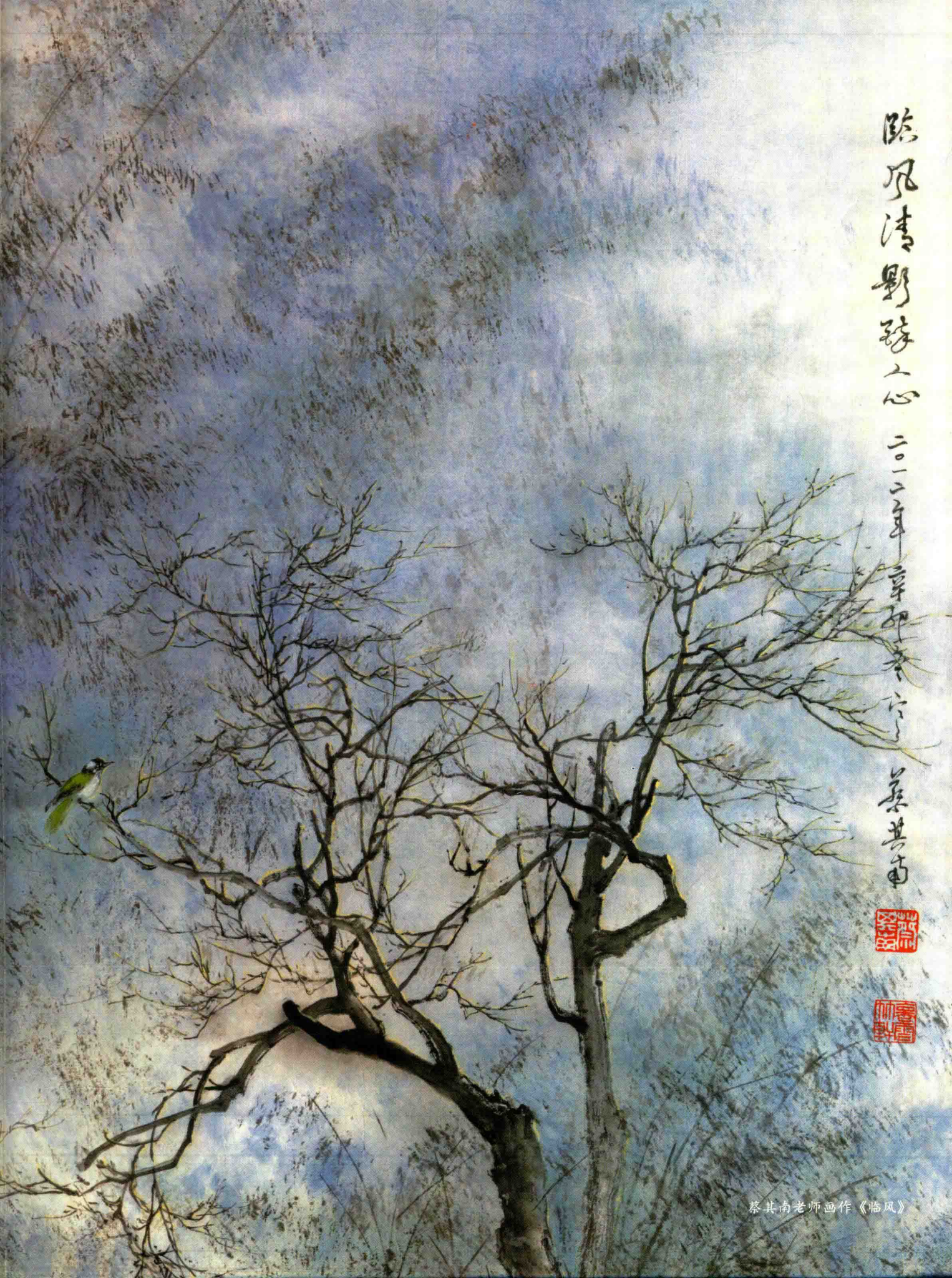
蔡其南老师画作《临风》