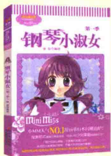
《钢琴小淑女（第一季）》

……为了考勤，为了英语成绩，为了拿奖学金，为了快点摆脱被他监督的命运，我一瞬间动力满满，只用了两个月的时间就将这个故事写了出来，让它提前跟淑女们见面了。不过，淑女们千万不要感谢那个家伙，因为我真的被他压迫得很惨啊……（哭）