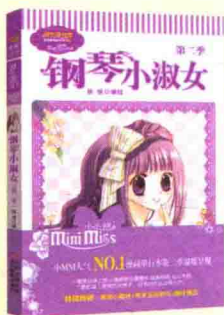
《钢琴小淑女（第二季）》