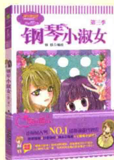
《钢琴小淑女（第三季）》