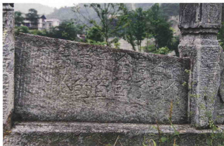
▲ 福缘桥上的红军石刻标语