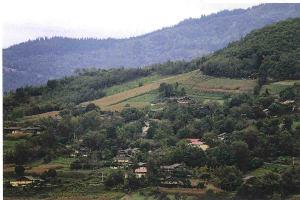
▲ 茂县东兴乡四坪村赤土坡红军指挥部旧址