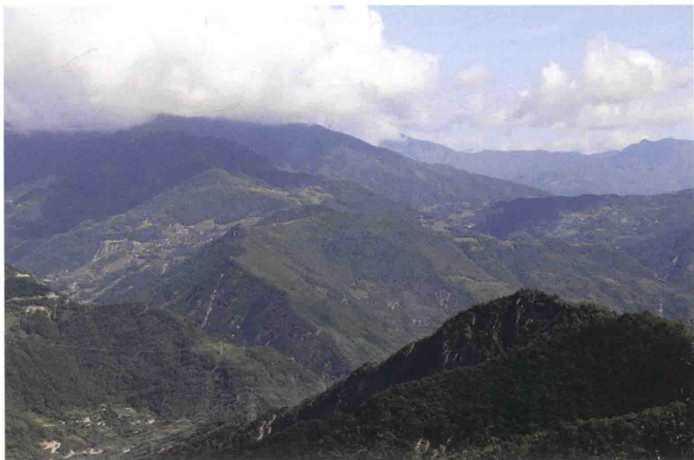
▲ 北川县墩上乡的川军北川河谷布防要点老水洞（北川县马槽乡）、蒿坪（今茂县东兴乡境内）遗址