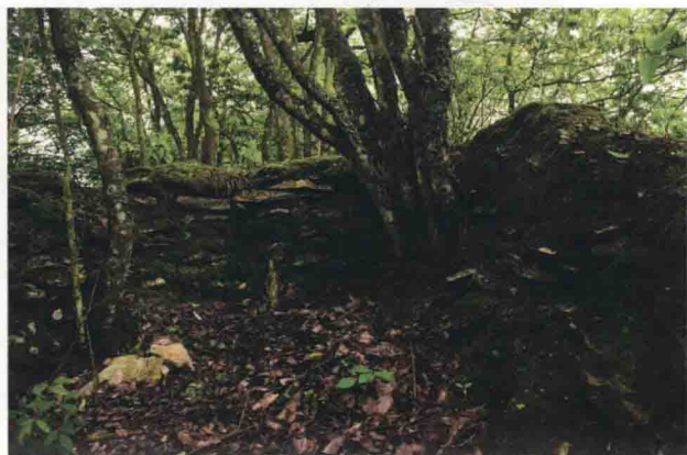
▲ 茂县土门乡洋坪村红军战壕遗迹