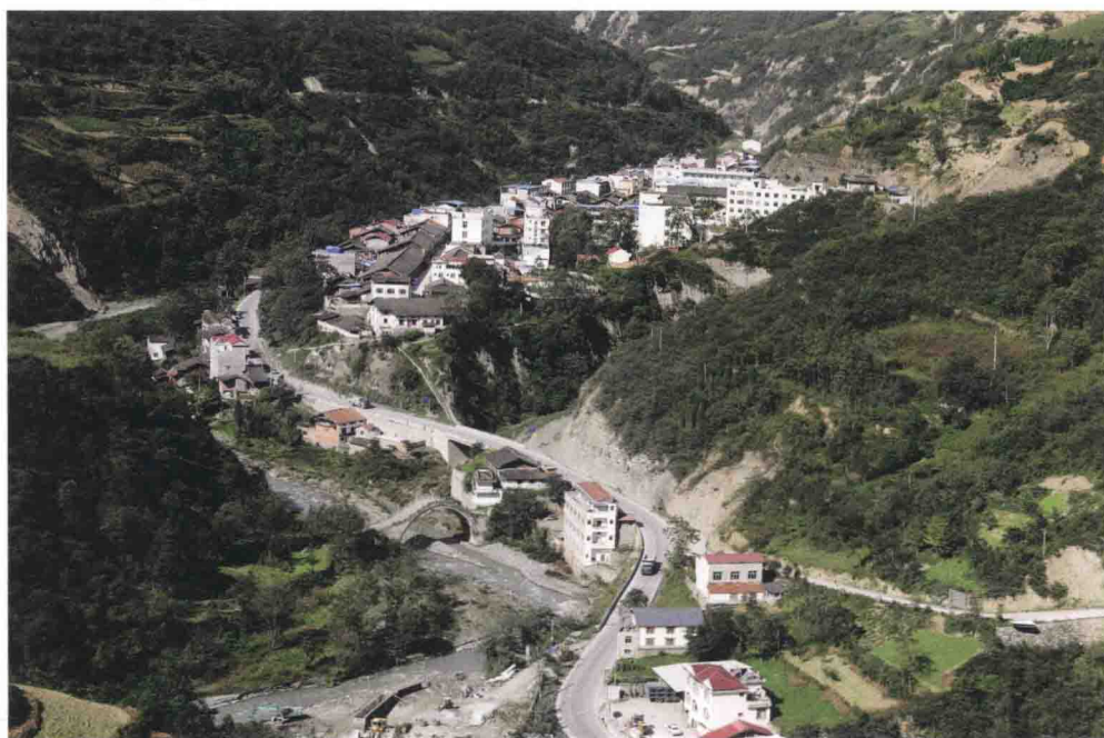
▲ 茂县土门乡的北川河谷西部要隘土门今貌