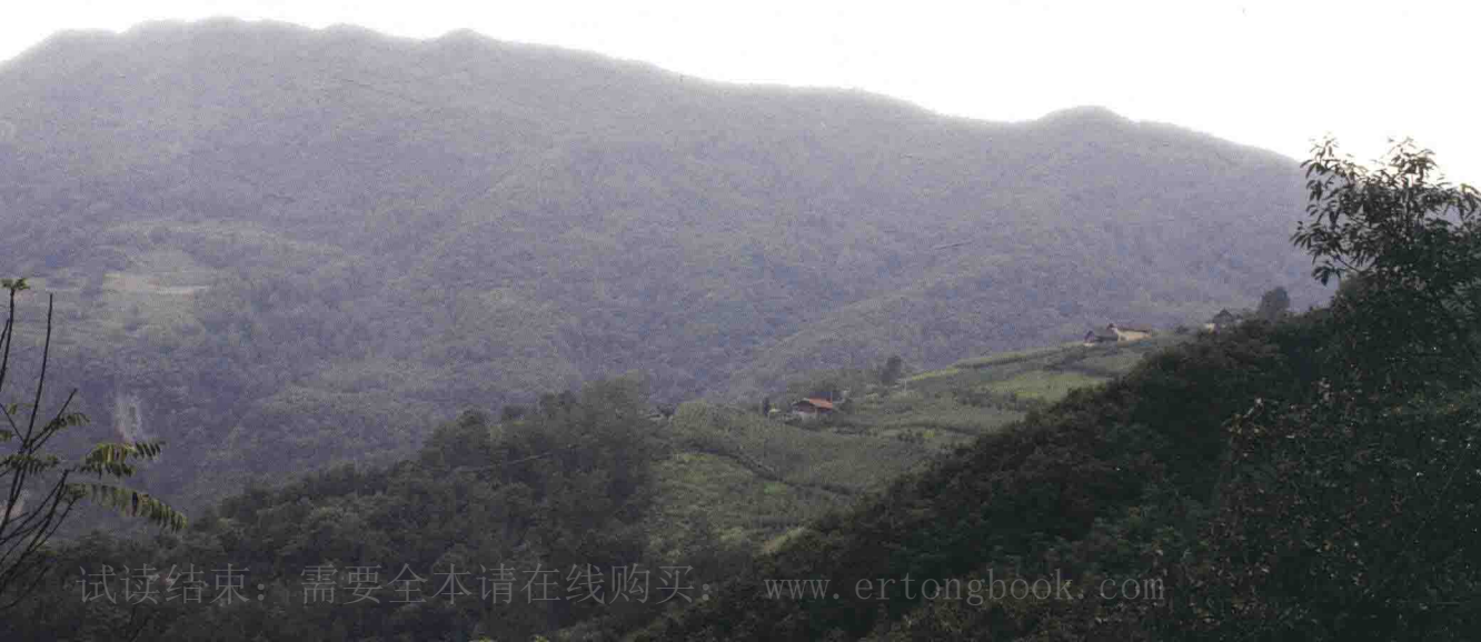
▼ 茂县东兴乡红军七星包战斗遗址