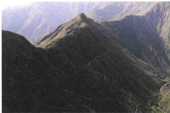
▲ 茂县洼底乡雅珠村红军观音梁子战斗遗址