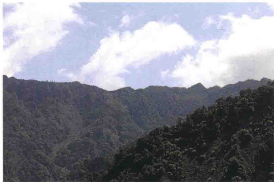
▲ 茂县东兴乡红军观音梁子战斗遗址