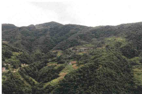
▲ 茂县东兴乡岭岗村红军战斗遗址