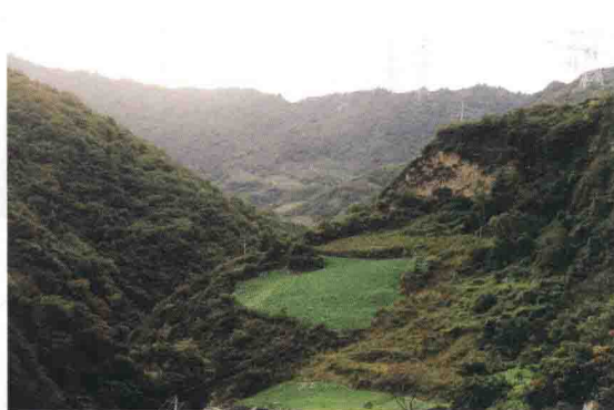
▲ 茂县光明镇红军土地岭战斗遗址