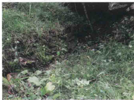
▲ 千佛山红军战壕遗迹