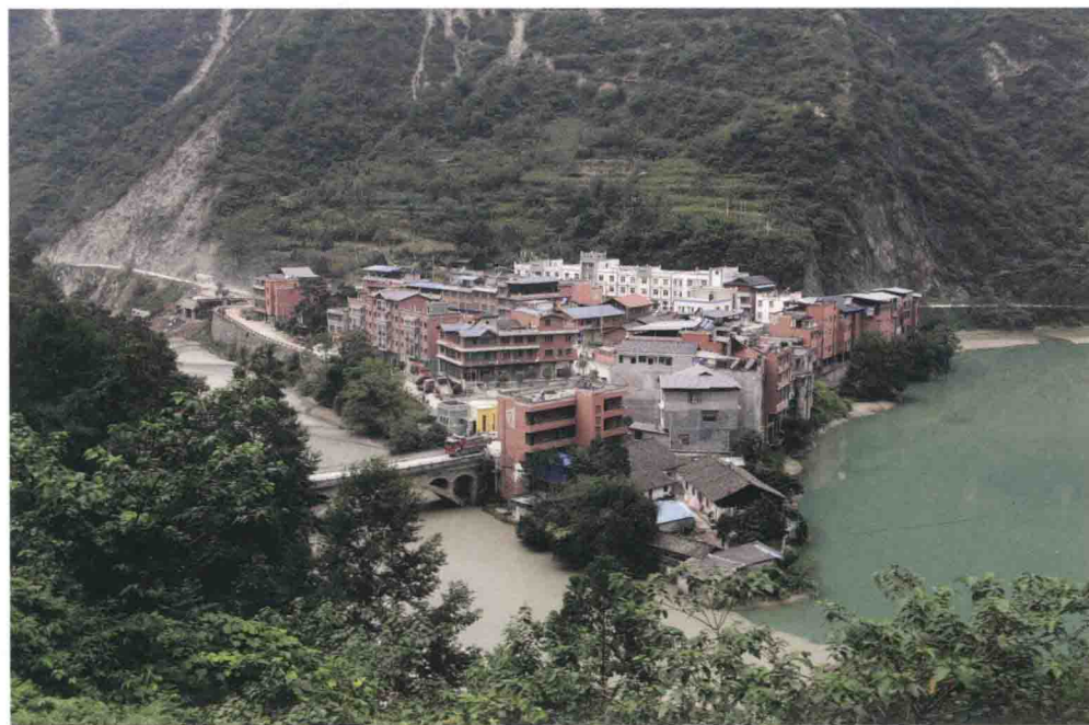
▲ 北川县墩上乡红军战斗遗址墩上今貌