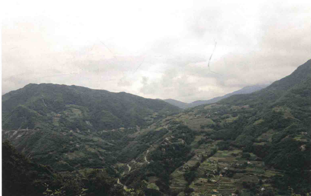
▲ 茂县东兴乡的国民党川军北川河谷设防要地赤土坡遗址