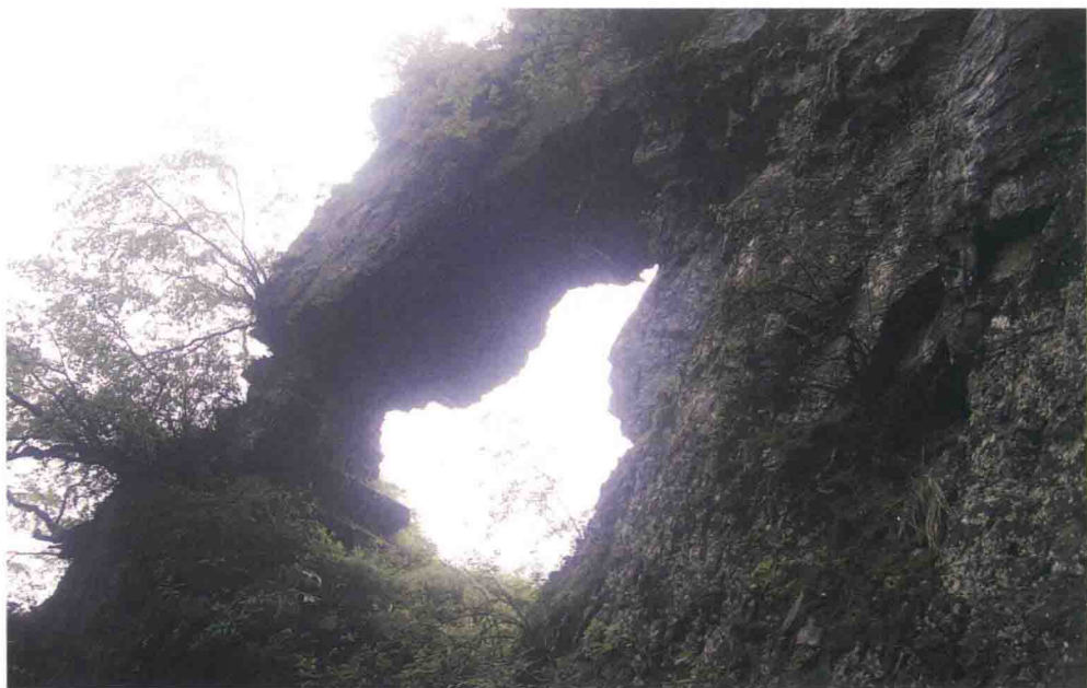
▲ 千佛山天门洞战斗遗址