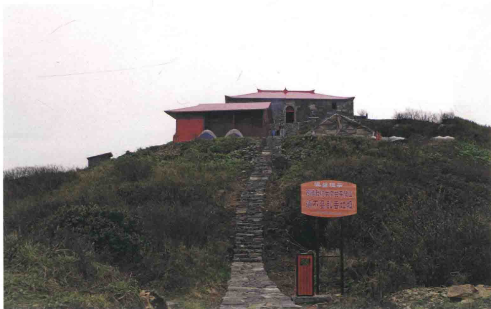
▲ 千佛山战斗遗址主峰佛祖庙今貌