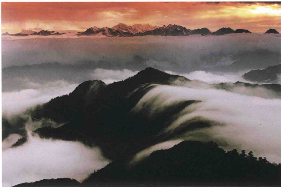
▲ 位于绵竹市、北川县、茂县交界处的北川河谷东端要隘千佛山

北川河谷是红四方面军西进岷江流域的唯一通道，南面耸立着伏泉山、千佛山、观音梁子等高山，山峰陡峭，东西蜿蜒百余里，是南扼川西平原、北控北川河谷的天然屏障，地形十分险要。土门地处北川河谷中段，是东达北川、西进茂县的要隘。国民党军察觉红四方面军有西移动向，即令川军严防北川河谷。红四方面军为了打破国民党军固守北川河谷的计划，于1935年4月底发动土门战役，于5月初开始夺取了伏泉山、千佛山、观音梁子，继而连续突破敌军土门要隘三道防线，实现控制北川战役目标。5月15日开始，红四方面军坚守伏泉山、千佛山、观音梁子、土门要隘，击溃敌军重兵反扑，主力乘胜西进，直到7月14日全部撤离。土门战役是红军长征中的一个重要战役，为保障红四方面军西进并与党中央和红一方面军胜利会师起到了重要作用。